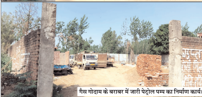
गैस गोदाम के बराबर में जारी पेट्रोल पंप का निर्माण कार्य।