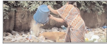
शहर की सेहत ठीक नहीं: हमारी आदतें इसका सम्पादकीय