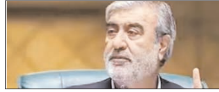
कूटनीतिक बातचीत सैन्य संघर्ष का ही एक विस्तार: अजीजी