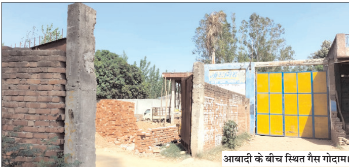
आबादी के बीच स्थित गैस गोदाम