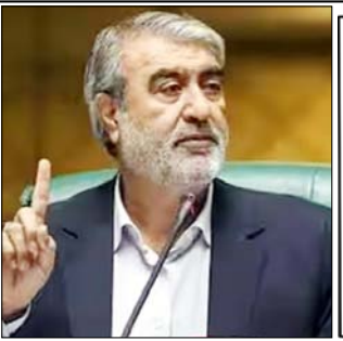
ईरान को अपने शांतिपूर्ण उद्देश्यों के लिए परमाणु उपकरणों के उपयोग का पूरा अधिकार: काजेम जलाली ईरान अपने राष्ट्रीय हितों के आधार पर काम करता है अगर बातचीत से ऐसे नतीजे निकलते हैं जो युद्ध के मैदान की उपलब्धियों को सुरक्षित रखते हैं, तो यह एक अवसर है: अजीजी

तेहरान/मास्को। ईरान के वरिष्ठ सांसद इब्राहिम अजीजी ने सोमवार को अमेरिका के साथ चल रही कूटनीतिक बातचीत को सैन्य संघर्ष का ही एक विस्तार बताया है। उन्होंने जोर देकर कहा कि कोई भी बातचीत तभी होगी जब वह पूरी तरह से ईरान के राष्ट्रीय हितों और सुरक्षा के पक्ष में हो।