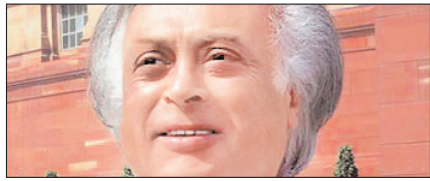
मोदी सरकार की विदेश नीति पर कांग्रेस ने उठाए सवाल

नई दिल्ली, मुजफ्फरनगर, देहरादून, हल्द्वानी, मुगदाबाद, बरेली, मेरठ व लखनऊ से प्रकाशित