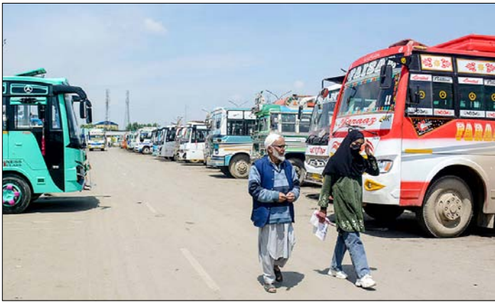
श्रीनगर। मिजी बसों के चालकों और कंडक्टरों द्वारा सरकार के स्टाटो सिटी बस सेवाओं को अन्य जिलों में विस्तारित करने के प्रस्ताव के खिलाफ विरोध प्रदर्शन के बाद बस स्टैंड के पास से गुजरते लोग।

नई दिल्ली। प्रधानमंत्री नरेन्द्र मोदी और दक्षिण कोरिया के राष्ट्रपति ली जे म्युंग ने सोमवार को यहां द्विपक्षीय मुद्दों पर व्यापक वार्ता कर दोनों देशों के संबंधों को 'भविष्योन्मुखी साझेदारी' में बदलने का संकल्प लिया और कहा कि भारत तथा दक्षिण कोरिया के बीच के ये संबंध प्रौद्योगिकी, व्यापार और हिंद-प्रशांत क्षेत्र में साझा रणनीति, तिक हितों पर आधारित होंगे। बैठक के बाद संयुक्त संवाददाता सम्मेलन को संबोधित करते हुए मोदी ने कहा कि आठ वर्ष बाद दक्षिण कोरिया के राष्ट्रपति को यह भारत यात्रा, अत्यंत महत्वपूर्ण है और दोनों देशों के बीच के गहरा तालमेल को दर्शाती है। उन्होंने कहा कि लौकतांत्रिक मूल्य, बाजार अर्थव्यवस्था और कौशल के शासन के प्रति सम्मान दोनों देशों की मूल पहचान का हिस्सा है।