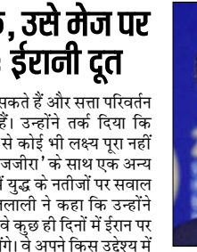
जैसी रणनीतिक चिंताओं तक आ गए हैं। उन्होंने तर्क दिया कि अमेरिका की एमहत्वाकांक्षाएँ भी पूरी नहीं हुईं। उन्होंने कहा कि शुरूआत में वे सत्ता परिवर्तन चाहते थे, लेकिन अब वे उस स्थिति में आ गए हैं, जहाँ वे केवल हॉर्मुज जलडमरूमध्य को खोलना चाहते हैं।