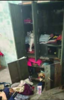
आमोर में चाचा की शादी के मंडप में शामिल होने गए हुए थे। सोमवार को बारात जानी थी, इसी दौरान उनका घर बंद पड़ा था, जिसका फायदा उठाकर चोरों ने घटना को अंजाम दिया। सोमवार सुबह जब वह घर लौटे तो मुख्य दरवाजे का ताला टूटा हुआ मिला। घर के अंदर जाने पर सामान बिखरा पड़ा था। अलमारी में रखी 5 जोड़ी पसल, एक सोने का मंगलसूत्र, घर में लगी एक एलसीडी और 30,900 रुपये

नाम चोरी हो चुके थे। घटना की सूचना पीड़ित ने तत्काल 112 नंबर पर दी। सूचना पर पहुंची पुलिस ने घटनास्थल का मुआयना किया। पीड़ित ने अज्ञात चोरों के खिलाफ थाने में तहरीर देकर कार्रवाई की मांग की है। पुलिस आसपास लगे सीसीटीवी कैमरों के माध्यम से चोरों की तलाश कर रही है।