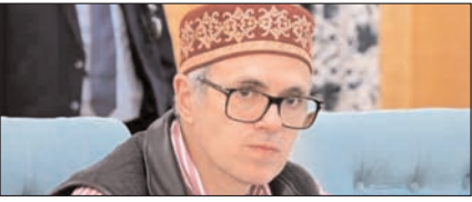
कश्मीर को राज्य का दर्जा न देना 'सजा' के समान : उमर अब्दुल्ला

नई दिल्ली, मुजफ्फरनगर, देहरादून, हल्द्वानी, मुतादाबाद, बरेली, मेरठ व लखनऊ से प्रकाशित