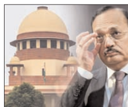
SIR लिस्ट से बाहर चुनाव अधिकारियों की याचिका पर कहा: इस बार वोट नहीं डाल पाएंगे

नई दिल्ली। सुप्रीम कोर्ट ने पश्चिम बंगाल विधानसभा चुनाव के पहले चरण में हुई रिकॉर्ड वोटिंग की तारीफ की। शुक्रवार को हुई सुनवाई के दौरान सीजेआई सुर्यकांत, जस्टिस जयमाल्या बागची और जस्टिस विपिन पंचोली की बेंच ने राज्य में चुनावी हिंसा न होने पर संतोष जताया। सीजेआई ने कहा कि भारत के नागरिक के रूप में, मुझे मतदान प्रतिशत देखकर बहुत खुशी हुई। जब लोग अपने मताधिकार का प्रयोग करते हैं, तो इससे लोकतांत्रिक व्यवस्था मजबूत होती है। सुप्रीम कोर्ट ने कहा कि जिनके नाम वोट लिस्ट से हटा दिए गए हैं, तो लोग समाधान के लिए कोर्ट की तरफ से नियुक्त 19 अपीलीय ट्रिब्यूनलों से संपर्क करें। कोर्ट बंगाल में एसआईआर को चुनौती देने वाली याचिकाओं को सुनवाई कर रहा था। सुप्रीम कोर्ट ने चुनाव से पहले इस प्रक्रिया को रोकने से इन्कार कर दिया था। कोर्ट ने अपीलीय ट्रिब्यूनलों से कहा कि वे उन लोगों को पहले सुनवाई का मौका दें, जो वोट लिस्ट में नाम