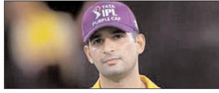
चेन्नई के अंशुल कम्बोज का पर्पल कैप पर फिर कब्जा