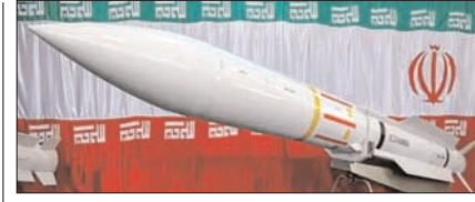
ईरान जंग में खर्च हुई चीन के लिए रिजर्व अमेरिकी मिसाइलें