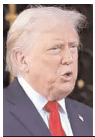
हेरिस की डेमोक्रेटिक पार्टी के पास 47 हैं। ट्रम्प की रिपब्लिकन पार्टी के ही लगभग 10 सांसद ईरान युद्ध के विरोध में आवाज उठा चुके हैं।

अब एक मई से पहले उन्हें संसद से युद्ध की मंजूरी लेनी है। रिपोर्ट्स के मुताबिक ट्रम्प संसद का सामना नहीं करना चाहते हैं। 100 सदस्यों वाली सीनेट में ट्रम्प के 53 सांसद हैं। जबकि विपक्षी कमला