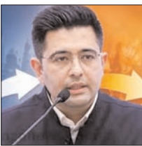
सात सांसदों ने राज्यसभा के सभापति को सौंपे दस्तावेज

नई दिल्ली। आम आदमी पार्टी के नेता और राज्यसभा सांसद राघव चड्ढा ने शुक्रवार को पार्टी से इस्तीफा दे दिया। इसके साथ ही वो भाजपा में शामिल हो गए। राघव के अलावा संदीप पाठक, अशोक मित्तल, हरभजन सिंह, विक्रजित सिंह साहनी, राजेंद्र गुप्ता के अलावा दिल्ली से आप की राज्यसभा सांसद स्वाति मालिवाल भी भाजपा में शामिल हो गईं। राघव ने एक्स पर जानकारी देते हुए लिखा, आज संविधान के प्रावधानों के तहत यह बड़ा राजनीतिक घटनाक्रम हुआ। आम आदमी पार्टी के दो-तिहाई से अधिक राज्यसभा सांसद भाजपा में शामिल हो गए। कुल सात सांसदों ने इस विलय संबंधी दस्तावेज पर हस्ताक्षर किए। इन