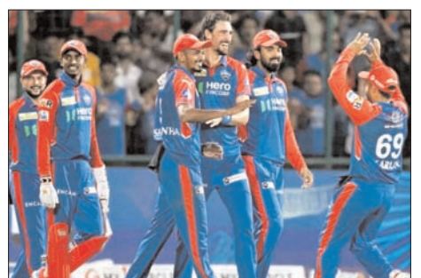
नाबाद पारी खेलने वाले-जो आईपीएल के इतिहास में किसी भी भारतीय खिलाड़ी का अब तक का सबसे बड़ा व्यक्तिगत स्कोर है, राहुल दिल्ली की बल्लेबाजी की रीढ़ बनकर उभरे हैं। उन्होंने इस सीजन में कई मैचों में अकेले दम पर टीम को जीत दिलाई है। सात पारियों में 357 रन और एक बेहतरीन स्ट्राइक रेट के

आरसीबी के खिलाफ मुकाबला आज अरुण जेटली स्टेडियम में नई दिल्ली, वार्ता। रिकॉर्ड स्कोर बनाने के बावजूद दिल्ली कैपिटल्स को पंजाब किंग्स के खिलाफ कल हार का सामना करना पड़ा और अब सोमवार को मौजूदा चैंपियन रॉयल चैलेंजर्स बंगलुरु के खिलाफ यहां अरुण जेटली स्टेडियम में इंडियन प्रीमियर लीग 2026 सीजन के 39वें मैच में उसे अपनी फील्डिंग, खास तौर पर कैचिंग में सुधार करना होगा तभी वह जीत की उम्मीद कर पाएगा। इस मुकाबले में सभी की निगाहें पूरी तरह से केएल राहुल पर टिकी हैं, जिनकी रिकॉर्ड तोड़ फॉर्म इस टूर्नामेंट की सबसे बड़ी चर्चा का विषय रही है। पंजाब के खिलाफ 152 रनों की शानदार