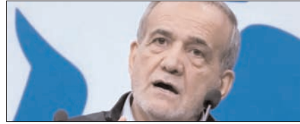
दबाव में युद्धविराम पर वार्ता नहीं करेगा तेहरान: पेंजेशिकयन