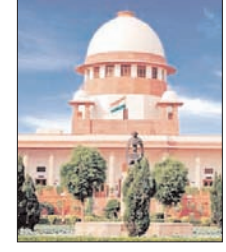
कहा: किसी भी आरोपी की अग्रिम जमानत याचिका को खारिज करना अदालत का अधिकार

शाह टाइम्स ब्यूरो नई दिल्ली। सुप्रीम कोर्ट ने अग्रिम जमानत और अदालती क्षेत्राधिकार को लेकर महत्वपूर्ण टिप्पणी की है। सुप्रीम कोर्ट ने कहा है कि किसी भी आरोपी को अग्रिम जमानत याचिका को खारिज करना अदालत का अधिकार है। हालांकि, याचिका खारिज करते समय अदालत के पास यह शक्ति नहीं है कि वह आरोपी को संबंधित ट्रायल कोर्ट के सामने आत्मसमर्पण करने का निर्देश दे। जस्टिस जेजी पारदीवाला और जस्टिस उज्ज्वल भुइयां की खंडपीठ ने एक मामले की सुनवाई के दौरान यह टिप्पणी की। यह मामला घोखाघड़ी और जालसाजी के आरोपी एक व्यक्ति की ओर से दायर की गई विशेष अनुमति याचिका से जुड़ा था। पीठ ने सुनवाई के दौरान न्यायिक सीमाओं के बारे में बात की। सुप्रीम कोर्ट ने कहा कि यदि अदालत अग्रिम जमानत खारिज करना चाहती है, तो वह ऐसा कर सकती है। लेकिन अदालत के पास यह कहने का कोई कानूनी अधिकार नहीं है कि याचिकाकर्ता अनिवार्य रूप से सरेंडर करे। यह पूरा मामला