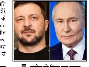
यूक्रेन के लिए यह बहुत जरूरी है कि रूस इस गलत युद्ध को खत्म करने की ताकत पाए

50 माह से जारी जंग के बीच रूस-यूक्रेन में सुलह के प्रयास तेज मास्को/कीव। यूक्रेन के राष्ट्रपति वोलोदिमिर जेलेंस्की अजरबैजान के दौर पर हैं, जहां उन्होंने अजरबैजान के राष्ट्रपति इल्हाम अलीयेव से मुलाकात की और ऊर्जा सुरक्षा को लेकर बातचीत की। राष्ट्रपति जेलेंस्की ने दक्षिण काकेशस के अपने पहले दौर पर कहा कि वह अजरबैजान में व्लादिमीर पुतिन से मिलने के लिए तैयार हैं। बता दें कि बीते कुछ समय से रूस और यूक्रेन के बीच सुलह कराने के लिए अमेरिकी की मध्यस्थता में बातचीत हो रही थी, लेकिन हाल फिलहाल में ईरान के साथ तनाव के बीच यह रुकी हुई है। पिछले कुछ हफ्तों में अमेरिका की अगुवाई वाली कूटनीतिक बातचीत रुकने के बाद जेलेंस्की का यह बयान सामने आया है। राष्ट्रपति वोलोदिमिर