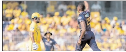
चेन्नई सुपर किंग्स को हराकर गुजरात टाइटंस ने चौथी जीत दर्ज की