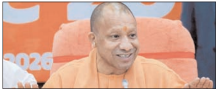
अनुशासन व टीमवर्क का उत्कृष्ट भाव सबसे बड़ी ताकत: योगी

नई दिल्ली, मुजफ्फरनगर, देहरादून, हल्द्वानी, मुगदाबाद, बरेली, मेरठ व लखनऊ से प्रकाशित