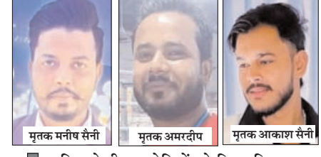
पुलिस ने तीन आरोपियों को किया गिरफ्तार