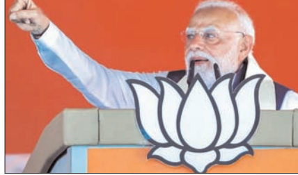
पीएम का आरोप: टीएमसी शासन में छोटे-छोटे नेता और गुंडे खुद को सरकार समझने लगे

कोलकाता, वार्ता पीएम नरेंद्र मोदी ने रविवार को पश्चिम बंगाल के नार्थ 24 परगना जिले के बर्नागांव और हुगली के हरिपाल में रैली की। उन्होंने बर्नागांव में कहा कि पहले फेज के मतदान में टीएमसी का घमंड टूट चुका है। दूसरे चरण में भाजपा की जीत तय होती दिख रही है। उन्होंने कोलकाता में रोड शो भी किया। पीएम ने आरोप लगाया कि टीएमसी शासन में छोटे-छोटे नेता और गुंडे खुद को सरकार समझने लगे हैं। 15 साल पहले टीएमसी' मां, माटी, मानुष' का नारा देकर सत्ता में आई थी, आज वे इन शब्दों को बोल भी नहीं पाते। अगर बोलेंगे, तो इनके पाप सामने आ जाएंगे। टीएमसी के राज में मामता सरकार में मां-माटी और मानुष का सम्मान नहीं है। हुगली में पीएम ने कहा कि टीएमसी सरकार ने अपने कुकर्मों को वजह से बंगाल के लोगों का भरोसा खो दिया है। यही कारण है कि लोगों को बार-बार कोर्ट का दरवाजा जगत खट्टन पड़ता है। 15 साल तक टीएमसी ने बंगाल के लोगों को डराकर रखा, लेकिन वे एक बात लोगों से बात करते मोबाइल एप में सारी जानकारी दर्ज करेंगे। वहीं, इस बार लोगों को खुद भी अपनी जानकारी डिजिटली अपलोड करने की सुविधा दी गई है। कर्मचारी को आने से 15 दिन पहले यह सुविधा शुरू होगी। पीएम अपने हिस्से से अपने समय में सारी जानकारी भर सकते हैं। इसको बाद उन्हें मोबाइल या ई-मेल पर एक विशेष आईडी मिलेगी। भूल गए। जब अत्याचार अपनी सीमा पर करता है, तो जनता मां दुर्गा का रूप लेकर अन्याय का अंत करती है।