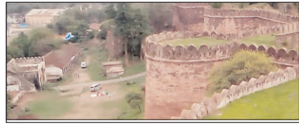
अब बदलाव की प्रयोगशाला बनने को तैयार है मप्र का धार सम्पादकीय