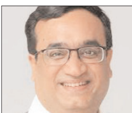
आप 'अरबपतियों की पार्टी': अजय माकन

कांग्रेस पार्टी के राष्ट्रीय कोषाध्यक्ष अजय माकन ने पंजाब के हालात को लेकर गंभीर चिंता जताते हुए कहा है कि पंजाब में अलगाववादी ताकतें एक बार फिर सिर उठाने लगी हैं। माकन ने सोमवार को एक संबोधन में आरोप लगाया कि देश को सहृदय की रक्षा करने वाले अहम राज्य पंजाब में गैंगवार, ड्रोन के जरिए ड्रग्स की सप्लाई और बढ़ती अपराध 1980 के दशक जैसे हालात की ओर इशारा कर रहे हैं। उन्होंने कहा कि इतिहास गवाह है कि जब भी अलगाववाद बढ़ता है, उससे पहले ड्रग्स और अपराध का ग्राफ ऊपर जाता है। उन्होंने भाजपा पर निशाना साधते हुए कहा कि 2022 के पंजाब विधानसभा चुनाव में मात्र 6.6 प्रतिशत वोट हासिल करने वाली पार्टी को अब राज्यसभा में 85.7 प्रतिशत प्रतिनिधित्व मिल गया है, जो लोकतांत्रिक भावना के खिलाफ है। माकन ने सवाल उठाया कि प्रधानमंत्री नरेंद्र मोदी और बीजेपी इस असंतुलन को जनता के सामने कैसे जायज ठहराएंगे। इसके साथ ही, माकन ने आम आदमी पार्टी पर भी हमला बोला। उन्होंने आप को 'बीजेपी की बी टीम' और