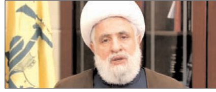
इजरायल के साथ सीधी बातचीत की संभावना नहीं: हिजबुल्लाह पेज 12