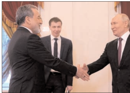
रूसी राष्ट्रपति का अराघची ने रूसी राष्ट्रपति का धन्यवाद किया। इस मीटिंग के बाद से पश्चिमी एशिया में चल रहा युद्ध का माहौल एक बार फिर गर्म हो गया है, क्योंकि सभी जानते हैं कि इस युद्ध में ईरान का समर्थन रूस कर रहा है। साथ ही चीन भी रूस के पीछे-पीछे चल रहा है।

तेहरान/ मास्को। ईरान के विदेश मंत्री अब्बास अराघची ने सोमवार को रूसी राष्ट्रपति व्लादिमीर पुतिन से मुलाकात की। बैठक में रूस ने ईरान के प्रति खुला समर्थन जताया। रूसी मीडिया के मुताबिक, पुतिन ने कहा कि ईरानी जनता साहस और वीरता के साथ अपनी आजादी और संप्रभुता के लिए लड़ रही है। उन्होंने यह भी कहा कि उन्हें ईरान के सुप्रीम लीडर मुज्तबा खामनेई का संदेश मिला है। अराघची की यह यात्रा ऐसे समय हुई है, जब अमेरिका और ईरान के बीच हालिया बातचीत किसी नतीजे पर नहीं पहुंच सकी। ऐसे में ईरान रूस का समर्थन मजबूत करने