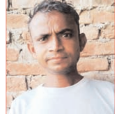
शव कई टुकड़ों में कटा

शाह टाइम्स संवाददाता रेहड़। नेशनल हाईवे पर बस स्टैंड के पास बीती रात दिल दहला देने वाली घटना हुई। प्राप्त समाचार के अनुसार स्थानीय निवासी युवक की अज्ञात वाहन से टक्कर हो गई। इसके बाद वह हाईवे पर पड़ा रहा। आधे घंटे तक वाहन उसके शव को रौंदते हुए गुजरते रहे। जिससे शव पूरी तरह क्षत-विक्षत हो गया और उसका सिर, धड़ व पैर आदि कई टुकड़ों में बट गए। सूचना पर पहुंची पुलिस ने पहचान का प्रयास किया, लेकिन बुरी हालत हो जाने की वजह से शव की पहचान नहीं हो सकी। पुलिस ने रात में ही शव को पोस्टमार्टम के