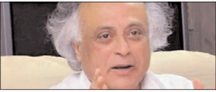
इजरायल पर भारत के रुख को नहीं मिला समर्थन: कांग्रेस पेज 2

नई दिल्ली, मुजफ्फरनगर, देहरादून, हल्द्वारी, मुतादाबाद, बरौली, मेरठ व लखनऊ से प्रकाशित