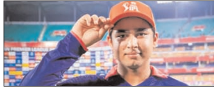
राजस्थान रॉयल्स के सूर्यवंशी ने फिर किया ऑरेंज कैप पर कब्जा खेल टाइम्स