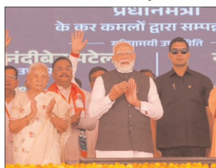
केशव प्रसाद मौर्य और वृजेश पाठक, साथ ही भाजपा के प्रदेश अध्यक्ष और केंद्रीय मंत्री पंकज चौधरी भी उपस्थित थे।

हरदोई। प्रधानमंत्री नरेंद्र मोदी ने बुधवार को यहाँ 594 किलोमीटर लंबे गंगा एक्सप्रेसवे का उद्घाटन किया और इसी के साथ ही उत्तर प्रदेश के अवसंरचना विकास में एक ऐतिहासिक अध्याय जुड़ गया। यह राज्य की कोकटिविटी और आर्थिक महत्वाकांक्षाओं में एक महत्वपूर्ण कदम है। प्रधानमंत्री ने स्थल पर एक पौधा लगाया और मुख्यमंत्री योगी आदित्यनाथ के साथ एक्सप्रेसवे पर पैदल चलकर इसके डिजाइन और विशेषताओं का जायजा लिया। इस अवसर पर राज्यपाल आनंदीबेन पटेल, केंद्रीय मंत्री जितिन प्रसाद, उपमुख्यमंत्री