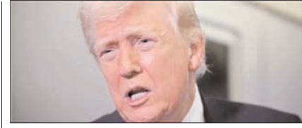
ईरान में हार से बचने को अमेरिका रास्ता तलाश रहा: अमेरिकी विशेषज्ञ पेज 12