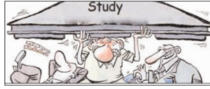
स्कूल की चौखट पर खड़ा बाजार, भीतर सिमटती शिक्षा सम्पादकीय