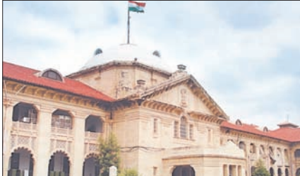
श्रम चिकित्सा सेवा के डाक्टरों की तुलना प्रांतीय चिकित्सा एवं स्वास्थ्य सेवा के डाक्टरों से नहीं की जा सकती।