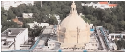
यूपी विधानसभा के विशेष सत्र की तैयारी, महिला आरक्षण पर सियासी घमासान तय पेज 2

नई दिल्ली, मुम्बई, देहरादून, हल्द्वानी, मुम्बई, बरेली, मेरठ व लखनऊ से प्रकाशित