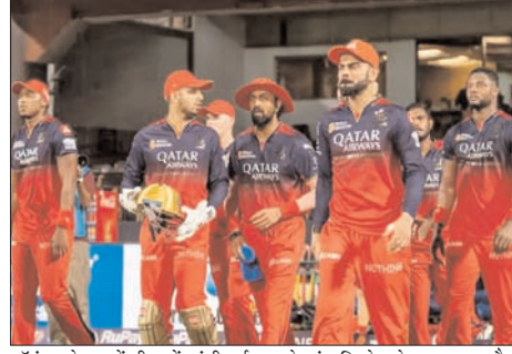
पॉइंट्स टेबल में बीच में फंसी हुई है और उसका नेट रेट भी नेगेटिव है। बंगलुरु की टीम ने इसी सीजन में पहले गुजरात टाइटन्स को पांच विकेट से हराया था और इस बार भी वह अपनी बल्लेबाजी की ताकत और अनुशासित गेंदबाजी के संतुलित तालमेल पर ही भरोसा करेगी। विराट कोहली

अहमदाबाद, वार्ता। मौजूदा चैपियन रॉयल चैलेंजर्स बंगलुरु आईपीएल 2026 प्लेऑफ की दौड़ में अपनी पकड़ और मजबूत करने की कोशिश करेगी, जब गुरुवार को यहां नरेंद्र मोदी स्टेडियम में सीजन के 42वें मैच में उसका सामना गुजरात टाइटन्स से होगा। आरसीबी इस मुकाबले में जबरदस्त फॉर्म में उतर रही है, उसने अपने आठ में से छह मैच जीते हैं और 1-919 के शानदार नेट रेट के साथ पॉइंट्स टेबल पर दूसरे स्थान पर है। वहीं, गुजरात टाइटन्स का प्रदर्शन इस सीजन में उतार-चढ़ाव भरा रहा है, जिसमें उसे चार जीत और चार हार मिली हैं, जिससे वह