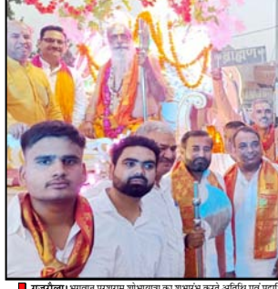
गजरीली। भगवान परशुराम शोभायात्रा का शुभारंभ करते अतिथि एवं पर्यटकों।