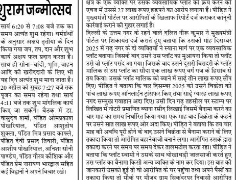
शोभायात्राओं के स्वगत के लिए रेलवे रोड पर विशेष स्वागत पॉइंट प्रदान जाएगा। इस वर्ष तृतीया तिथि 19 अप्रैल को सुबह 10:49 बजे से प्रारंभ होकर 20 अप्रैल को सुबह 7:27 बजे तक रहेगी, इसलिए पूजन का श्रेष्ठ समय 10:49 बजे के बाद माना जाता है। जन्मदिन के दिन विशेष पूजन के लिए दोपहर 11:33 से 12:24 बजे तक तथा