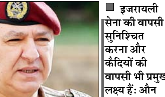
साथ-साथ अंतर्राष्ट्रीय व क्षेत्रीय राजनयिक जुड़ाव को दिया। आउन ने स्पष्ट किया कि बातचीत कमजोर हो सकती नहीं है, बल्कि यह लेबनान के हितों की रक्षा करने और जानमाल के नुकसान व विस्थापन को रोकने का एक संप्रभु निर्णय है। उन्होंने कहा कि हजारों लेबनानी मारे गए हैं और विदेशी हितों के लिए अब और जानें नहीं जानी चाहिए। राष्ट्रपति औन ने कहा कि मैं इन फैसलों की पूरी जिम्मेदारी लेने के लिए तैयार हूँ। उन्होंने एक

बेरूत। लेबनान के राष्ट्रपति जोसेफ औन ने इजरायल के साथ सीजफायर के बाद स्थायी समझौते पर बातचीत करने का ऐलान किया है। उन्होंने कहा कि यह कदम लेबनान के लोगों के अधिकारों, क्षेत्रीय एकता और देश की संप्रभुता की सुरक्षा के लिए उठाया गया है। यह घोषणा गुरुवार और शुक्रवार की आधी रात से लागू हुए 10 दिवसीय सीजफायर के बाद आई है, जिसका उद्देश्य इजरायल और हिजबुल्लाह के बीच भीषण तनाव को कम करना है। राष्ट्रपति औन ने लेबनान के लोगों को संबोधित करते हुए कहा कि देश अब सीजफायर लागू करने से आगे बढ़कर लंबे समय तक स्थिरता बनाए रखने के बड़े चरण की ओर बढ़ रहा है। उन्होंने सीजफायर का श्रेय लेबनान के लोगों के संयुक्त प्रयासों और कुर्बानियों के