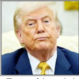
जॉनसन के लिए यह स्थिति राजनीतिक रूप से चुनौतीपूर्ण मानी जा रही है

वाशिंगटन। अमेरिका के राष्ट्रपति डोनाल्ड ट्रम्प को उस समय अपनी ही पार्टी के भीतर दुर्लभ विरोध का सामना करना पड़ा, जब रिपब्लिकन सांसदों ने फॉरेन इंटरलैंग्वेज सर्विलांस ऐक्ट (फिसा) के नवीनीकरण को रोक दिया। इस घटनाक्रम से न सिर्फ सदस्य अध्यक्ष माइक जोनसन को बड़ा झटका लगा, बल्कि ट्रम्प के प्रभाव पर भी सवाल खड़े हो गए, क्योंकि अब तक अधिकांश मामलों में रिपब्लिकन सांसद उनके समर्थन में एकजुट रहते थे। विवाद के केंद्र में फिसा की धारा 702 है, जिसका उपयोग अमेरिकी खुफिया एजेंसियां विदेशी व्यक्तियों की निगरानी के लिए करती रही हैं। व्हाइट हाउस के जोरदार प्रयासों के बावजूद 20 से ज्यादा रिपब्लिकन सांसदों ने पार्टी लाइन से हटकर मतदान किया और प्रक्रिया को रोक दिया। इस असफलता के बाद पार्टी नेतृत्व को मजबूरन इस निगरानी कार्यक्रम के लिए 10 दिन का अस्थायी विस्तार लागू करना पड़ा, जो आंशिक विकल्प था। यह घटनाक्रम इसलिए भी महत्वपूर्ण रहा, क्योंकि ट्रम्प, जो आमतौर पर प्रमुख मतदानों में पार्टी को एकजुट रखने में सफल रहते हैं, इस बार असंतुष्ट सांसदों को मनाने में विफल रहे। जोनसन के लिए यह स्थिति राजनीतिक रूप से चुनौतीपूर्ण मानी जा रही है, क्योंकि उनकी रणनीति काफी हद तक ट्रम्प के प्रभाव पर निर्भर रही है। प्रशासन ने सांसदों को मनाने के लिए व्यापक प्रयास