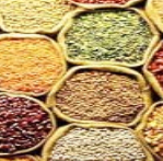
निसल गयी। वनस्पति 71 रुपये और सूखमुखी तेल 55 रुपये महंगे हुआ। सोया तेल की कीमत 53 रुपये और सरसों तेल की 45 रुपये प्रति क्विंटल बढ़ गई। मीठे के बाजार में आज गूड़ का औसत भाव 27 रुपये प्रति क्विंटल बढ़ गया। चीनी भी छह रुपये महंगी हुई।

पेरु, थोस थोस बाजारों में शनिवार को चावल का औसत भाव घट गया। चावल के साथ गेहूं भी सस्ता हुआ। चूनी चीनी में तेजी रही जबकि दालों और खाद्य तेलों में उतार-चढ़ाव का रुख देखा गया। औसत दर्जे के चावल की औसत कीमत सात रुपये घटकर 3,84.8 रुपये प्रति क्विंटल रह गई। गेहूं भी 1 रुपये सस्ता हुआ और 2,77.9 रुपये प्रति लखनवल होला गया। आठ की कीमत चार रुपये में उतार-चढ़ाव नरम आया। मूंग दाल 25 रुपये प्रति क्विंटल महंगी हुई। मसूर दाल की कीमत 12 रुपये और चना दाल सात रुपये प्रति क्विंटल सस्ती हुई। स्थानीय मुंफली दाल की औसत कीमत 159 रुपये और चाम दाल की 31 रुपये प्रति क्विंटल