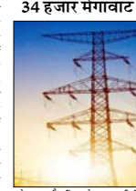
हुं चुका है, जिससे राज्य की बिजली उत्पादन क्षमता में उल्लेखनीय वृद्धि हुई है...