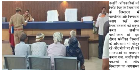
समस्याओं को गूँज सुनाई दी। क्षेत्राधिकारी गढ़मुक्तेश्वर स्तुति सिंह ने मौके पर पहुंचकर फरियादियों को समस्याएँ गंभीरता से सुनीं और संबंधित अधिकारियों को उनके त्वरित एवं गुणवत्तापूर्ण निराकरण के लिए स्पष्ट दिशा-निर्देश दिए।

गढ़मुक्तेश्वर। गहरी गहरी गढ़मुक्तेश्वर में आयोजित समाधान दरबार दिवस के दौरान शनिवार को जनसमस्याओं को गूँज सुनाई दी। क्षेत्राधिकारी गढ़मुक्तेश्वर स्तुति सिंह ने मौके पर पहुंचकर फरियादियों को समस्याएँ गंभीरता से सुनीं और संबंधित अधिकारियों को उनके त्वरित एवं गुणवत्तापूर्ण निराकरण के लिए स्पष्ट दिशा-निर्देश दिए।