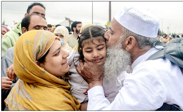
श्रीनगर। जम्मू-कश्मीर में हज यात्रियों का पहला जत्या मत्का के लिए रवाना होते समय एक हज यात्री बच्ची को दुलारते हुए।

वाशिंगटन। अमरीकी वित्त मंत्रालय ने शुक्रवार को 17 अप्रैल तक जहाजों पर पहले से लदे रूसी कच्चे तेल और पेट्रोलियम उत्पादों की आपूर्ति और बिक्री को इजाजत के लिए एक अस्थायी छूट देने की घोषणा की है। यह छूट 16 मई तक मान्य है। यह छूट सुनिश्चित करती है कि समुद्र में अभी मौजूद तेल अंतर्राष्ट्रीय खरीदारों तक पहुंच सके, साथ ही रूस पर कुल मिलाकर रोक का दबाव बना रहे। मंत्रालय के एक प्रवक्ता ने कहा कि जैसे-जैसे बातचीत आगे बढ़ रही है, मंत्रालय यह सुनिश्चित करना चाहता है कि तेल उन लोगों को मिले जिन्हें इसकी जरूरत है कि उन्होंने इस बात पर जोर दिया कि यह कदम बाजार को स्थिर करने के लिए है, न कि रोक नीति में बदलाव के लिए। यह फैसला अमरीकी वित्त मंत्री स्कॉट बसेंट के इस संकेत के कुछ ही दिनों बाद आया है कि प्रशासन रूसी तेल के लिए जनरल लाइसेंस नहीं बढ़ाएगा। इस मामले से जुड़े सूत्रों ने कहा कि ईरान युद्ध के बीच एशिया में बढ़ती ऊर्जा लागत का सामना कर रहे कई साझेदार देशों ने जी-20, विश्व बैंक और अंतर्राष्ट्रीय मुद्रा कोष की बैठक में चर्चा के दौरान वाशिंगटन पर छूट बढ़ाने का दबाव डाला। यह घोषणा ईरान के विदेश मंत्री के इस टिप्पणी के बाद आई है कि युद्धविरोध के दौरान होर्मुज जलमार्ग वाणिज्यिक जहाजों के लिए खुला रहेगा।