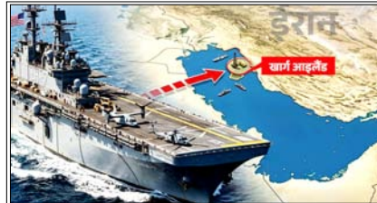
इस सबसे ताकतवर मारने वाले अमेरिकी जहाज का इतना लंबा रूट लेना कोई आम बात नहीं है

वाशिंगटन। समुद्र में दुनिया के सबसे ताकतवर जंगी जहाजों में शामिल अमेरिका का विशाल एयक्राफ्ट कैरियर यूएसएस जार्ज एच डब्ल्यू बुश सीधा रास्ता छोड़कर लंबा चक्कर लगा रहा है। यह जहाज अब डेह गुना ज्युदा दूरी तय करते हुए अफ्रीका का पूरा चक्कर लगाकर ईरान के करीब पहुंच रहा है। रिपोर्ट्स के मुताबिक रेड सी का रास्ता हूती विद्रोहियों के खतरों से भरा है। जिससे बचने के लिए यह अमेरिकी सुपरकैरियर लंबा रास्ता लेने को मजबूर है। फोर्ब्स की रिपोर्ट के मुताबिक अमेरिकी कैरियर जिब्राल्टर, भूमध्य सागर और अल-अल-रुस स्ट्रेट से बच रहे हैं। लेकिन इस बार अमेरिकी नौसेना ने यह रास्ता नहीं चुना है। इस कैरियर के साथ तीन डेस्ट्रॉयर और करीब 6000 नाविक हैं। जो अमेरिकी अधिकारियों ने एपी को बताया कि यह स्ट्राइक ग्रुप मिडिल ईस्ट तैनाती के लिए रवाना हुआ है। इस सबसे ताकतवर मारने वाले अमेरिकी जहाज का इतना लंबा रूट लेना कोई आम बात नहीं है। पेंटागन ने आधिकारिक तौर पर वजह नहीं बताई है, लेकिन संकेत साफ हैं कि अफ्रीका का रास्ता लेने से यह जहाज लाल सागर और बाब-अल-मंदेब स्ट्रेट से बच रहा है। हाल के सालों में इस इलाके को यमन के