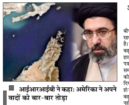
आईआरआईवी ने कहा: अमेरिका ने अपने वादों को बार-बार तोड़ा

तेहरान में पहले इस जलमार्ग को फिर से खोलने की घोषणा की थी। ईरानी सरकारी मीडिया इस्तामिक रिपब्लिक ऑफ ईरान ब्रॉडकास्टिंग (आईआरआईवी) ने इस संबंध में जानकारी दी है। ईरान के सेंट्रल हेडक्वार्टर ऑफ द होली प्रॉफेट के