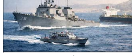
अफ्रीका के रास्ते मिडिल ईस्ट जा रहा अमेरिकी वॉरशिप, हमले के डर से रास्ता बदला