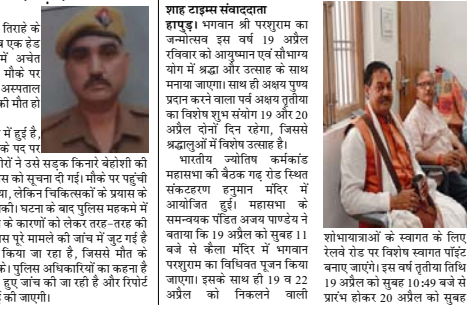
मौत को पहचाना धमनीवर के रूप में हुई है, जो जिला बागपत में हेड कॉन्स्टेबल के पद पर तैनात था। बताया जा रहा है कि रातगोरी में उसे सड़क किनारे बेहोशी की हालत में पड़े देखा, जिसके बाद पुलिस को सूचना दी गई। मौके पर पहुंची टीम ने तत्काल उसे अस्पताल पहुंचाया, लेकिन चिकित्सकों के प्रयास के बावजूद उसकी जान नहीं बचाई जा सकी। घटना के बाद पुलिस महकमे में शोक को लहर दौड़ा गई है। वहीं, मौत के कारणों को लेकर तहत-तहत की जांच भी हो रही है। फिलहाल पुलिस पूरे मामले को जांच में जुट गई है और पोस्टमॉर्टम रिपोर्ट का इंतजार किया जा रहा है, जिसमें मौत के वास्तविक कारणों का खुलासा हो सके। पुलिस अधिकारियों का कहना है कि सभी चरतुओं को ध्यान में रखते हुए जांच की जा रही है और रिपोर्ट आने के बाद आगे की विधिक कार्रवाई की जाएगी।

हापुड़। नगर कोवाली क्षेत्र के मेरठ विहार के पास उम्र समथ सनसनी फेल गई, जब एक हडकड़ केन्द्रीला सिद्धिग परिवारियों में अचानक अस्वस्थता से निराश। सड़क किनारे ही मौके पर पहुंची पुलिस ने उसे तत्काल अस्पताल भिजवाया, जहाँ उपचार के दौरान उसकी मौत हो गई।