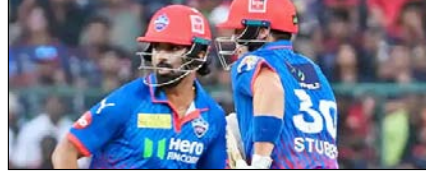
दिल्ली ने बेंगलुरु को रोमांचक मुकाबले में हराया