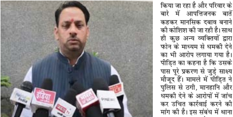
आरोप है कि रकम लौटाने का आश्वासन दिया गया, लेकिन लंबे समय बीतने के बाद भी पैसा वापस नहीं किया गया। पॉइंट ने यह भी आरोप लगाया कि अब पैसा मांगने पर उसे टालमटोल किया जा रहा है और परिवार के बारे में आपत्तिजनक बातें कहकर मानसिक दबाव बनाने की कोशिश की जा रही है। साथ ही कुछ अन्य व्यक्तियों द्वारा फोन के माध्यम से धमकी देने का भी आरोप लगाया गया है। पॉइंट का कहना है कि उसके पास पूरे प्रकरण से जुड़े सबूत मौजूद हैं। मामले में पॉइंट ने पुलिस से ठगी, मानहानि और धमकी देने के आरोपों में जांच कर उचित कार्रवाई करने की मांग की है। इस संबंध में थाना पुलिस का कहना है कि तहरीर प्राप्त हुई है और मामले को जांच कर आवश्यक विधिक कार्रवाई की जाएगी।

हापुड़। सिम्हाणवली। क्षेत्र के एक व्यक्ति ने कुछ लोगों पर छूट को प्रभावशाली संकेतों से जोड़कर उत्तर प्रदेश सरकार में राज्य मंत्री बनवाने का झंझा देने और लाखों रुपये की ठगी करने का आरोप लगाया है। पॉइंट का थाना सिम्हाणवली में तहरीर देकर मामले में कार्रवाई की मांग की है। तहरीर के अनुसार, आरोपी ने कथित रूप से पॉइंट को कुछ लोगों से मिलवाया और भरोसा दिलाया कि हमसे मंत्री पद दिलाया जा सकता है। इस प्रक्रिया के नाम पर उससे करीब 3 लाख 95 हजार रुपये लिए गए। पॉइंट का आरोप है कि रकम लौटाने का आश्वासन दिया गया, लेकिन लंबे समय बीतने के बाद भी पैसा