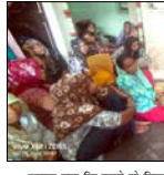
काफ़ी आक्रोश देखते को मिला और परिजनों ने लापरवाही का आरोप लगाया।

काफ़ी आक्रोश देखते को मिला और परिजनों ने लापरवाही का आरोप लगाया। हालांकि बाद में परिजनों ने किसी भी प्रकार को कांफ्यूरी कार्रवाई से इंकार कर दिया और बिना पोस्टमॉर्टम के ही बच्चे को अंतिम संस्कार कर दिया गया। पुलिस का जवाब है कि मामले में कोई शिफ्टिंग विकल्प नहीं है। वहीं घटना के बाद गांव में शोक और देहव्रत का माहौल बना हुआ है।