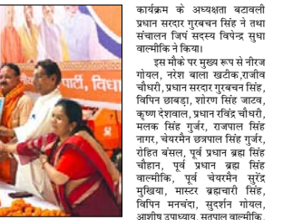
राजा का बेटा राजा नहीं होता असली राजा बड़ा होगा जो जनात बेटे डालकर निकले।