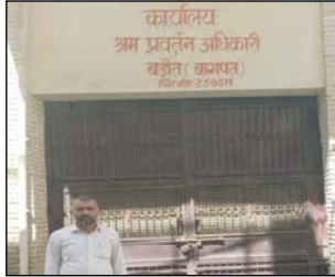
सोपान है। उन्होंने बताया कि बंद पड़े कार्यालय का हर महीने लगभग 3500 किराया देना पड़ता है, जबकि वहाँ कोई अधिकारी या कर्मचारी मौजूद नहीं रहता।

शाह टाइम्स संवाददाता बागपट। रिविवा को बहूतों में श्रम विभाग का प्रवर्तन अधिकारी कार्यालय पिछले चार साल से बंद पड़ा है। इसके बावजूद सरकार हर महीने किराए के रूप में हजारों रुपये खर्च कर रही है, जिससे अब तक उहे लाख रुपये से अधिक का नुकसान हो चुका है। इस स्थिति के कारण क्षेत्र के किसानों को अपनी समस्याओं से समाधान के लिए बागपट प्रशासन के चक्कर लगाने पड़े रहें।