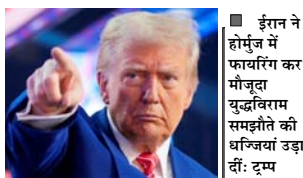
होर्मुज स्ट्रेट किसी बेतकूप के दबीट पर नहीं खुलेगा

अमेरिकी राष्ट्रपति डोनाल्ड ट्रम्प ने ईरान के खिलाफ अब तक का सबसे आक्रामक रुख अतिरिक्त किया है। उन्होंने ईरान को नैन्य शक्ति की चेतावनी दी है। ट्रम्प ने कहा कि अगर ईरान ने मौजूदा समझौते की शर्तों को स्वीकार नहीं किया, तो अमेरिका उसके तमाम पावर प्लांट और पुलों को जमींदोज कर देगा।