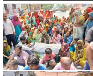
नंगला हट्टे में धरने पर बैठे मृतक के परिजन।