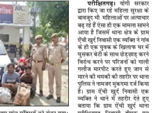
कर अंधेरे रूप से बंचे होते थे। गिरोह लंबे समय से इस प्रकार की बदायतों को अंजाम दे रहा था।