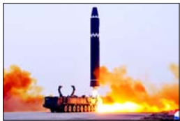
यह इलाका पहले भी मिसाइल परीक्षणों के लिए जाना जाता रहा है

सियोल। एशिया में एक बार फिर तनाव की लहर तेज हो गई है। रविवार को दक्षिण कोरिया ने दावा किया कि उत्तर कोरिया ने अपनी पूर्वी समुद्री सीमा की ओर कई बैलिस्टिक मिसाइलें दागी हैं। यह कदम ऐसे समय पर उठाया गया है, जब क्षेत्र पहले से ही सुरक्षा चुनौतियों और शक्ति संतुलन के दबाव से जूझ रहा है। लगातार हो रहे मिसाइल परीक्षण ने केवल पड़ोसी देशों के लिए चिंता का कारण बन रहे हैं, बल्कि वैश्विक स्तर पर भी अस्थिरता की आशंका को बढ़ा रहे हैं। दक्षिण कोरियाई सेना के जाईट चीफ्स ऑफ स्टाफ के अनुसार ये मिसाइलें रविवार सुबह उत्तर कोरिया के पूर्वी तटीय इलाके सिनपो से छोड़ी गईं। यह इलाका पहले भी मिसाइल परीक्षणों के लिए जाना जाता रहा है। दक्षिण कोरिया ने कहा है कि वह इस स्थिति पर लगातार नजर बनाए हुए है और अपनी निगरानी व्यवस्था को