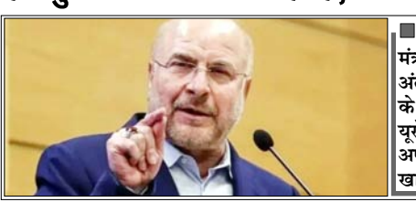
ईरानी विदेश मंत्रालय ने अंतरराष्ट्रीय कानून के अनुपालन की यूरोपीय संघ की अपील को किया खारिज

हमें दुश्मन पर भरोसा नहीं है, अमी मी, जब हम यहां बैठे हैं, युद्ध छिड़ सकता है: संसद अध्यक्ष