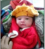
मासूम का फाइल फोटो।

टीकाकरण के बाद बिगड़ी हालत, ग्रामीणों में आक्रोश