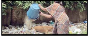
शहर की सेहत ठीक नहीं: हमारी आदतें डूस्कवा संपादकीय