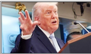
ईरान युद्ध के दौरान अमेरिकी राष्ट्रपति डोनाल्ड ट्रम्प का रवैया सार्वजनिक रूप से बेहद आक्रामक रहा है

आलम यह था कि राष्ट्रपति लगातार अपने सहयोगियों पर चिल्लाते जा रहे थे। नतीजतन उनके सहयोगियों ने उन्हें एक बहुत अहम बैठक वाले कमरे से बाहर तक करने से गुरेज नहीं किया। इस पूरे घटनाक्रम से जुड़ा खुलासा किया है अमेरिकी अखबार-द वॉल स्ट्रीट जर्नल ने। अमेरिकी अधिकारियों और व्हाइट हाउस से जुड़े स्रोतों के हवाले से छपी इस रिपोर्ट में ट्रम्प के लगातार बदलते रवैये का उदाहरण देने के लिए जिस घटनाक्रम की बात की गई है, वह था-ईरान में एक अमेरिकी एफ-15ई लड़ाकू विमान को क्रेश होने और इसके पायलट-एयरमैन