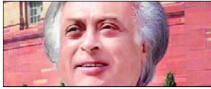
मोदी सरकार की विदेश नीति पर कांग्रेस ने उठाए सवाल

नई दिल्ली, मुम्बयनगर, देहरादून, हदगाँव, मुद्रावहार, बरेली, मेरठ व सतलुज से प्रकाशित