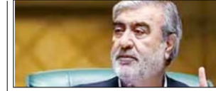
कूटनीतिक बातचीत सैन्य संघर्ष का ही एक विस्तार: अजीजी