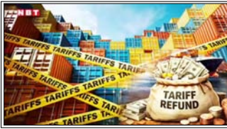
रिफंड लौटाने का यह फैसला सुप्रीम कोर्ट के आदेश के बाद लागू हुआ है

वाशिंगटन। अमेरिका में राष्ट्रपति डोनाल्ड ट्रम्प के कार्यकाल में लगाए गए टैरिफ को अवैध ठहराने के बाद रिफंड की प्रक्रिया शुरू हो गई है। अमेरिकी कंपनियां सोमवार से नए ऑनलाइन पोर्टल के जरिए आवेदन कर सकती हैं। इस अमेरिकी इतिहास का सबसे बड़ा टैरिफ रिफंड माना जा रहा है, जिसमें 166 अरब डॉलर (करीब 13.8 लाख करोड़ रुपये) लौटाए जा रहे हैं। रिफंड लौटाने का यह फैसला सुप्रीम कोर्ट के आदेश के बाद लागू हुआ है। कोर्ट ने कहा था कि ट्रम्प प्रशासन ने आपातकालीन शक्तियों का गलत इस्तेमाल कर टैरिफ लगाए थे। इसके बाद कोर्ट ऑफ इंटरनेशनल ट्रेड ने इंपोर्ट्स को उनकी जमा राशि और ब्याज लौटाने के निर्देश दिए थे। इस फैसले के तहत करीब 3.3