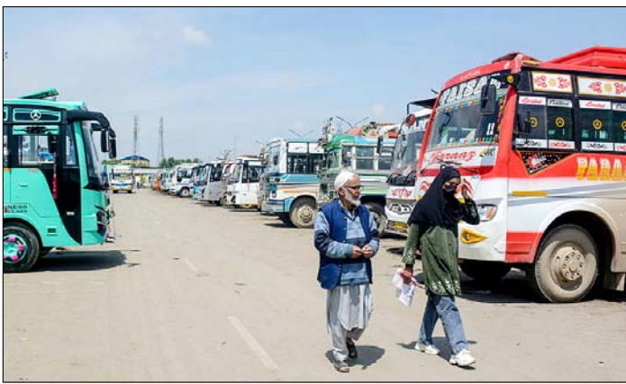
श्रीनगर। गिजी बसों के चालकों और कंडक्टरों द्वारा सरकार के स्टाफ सिटी बस सेवाओं को अन्य जिलों में विस्तारित करने के प्रस्ताव के खिलाफ विरोध प्रदर्शन के बाद बस स्टैंड के पास से गुजरते लोग।

नई दिल्ली। प्रधानमंत्री नरेन्द्र मोदी और दक्षिण कोरिया के राष्ट्रपति ली जे म्युंग ने सोमवार को यहां द्विपक्षीय मुद्दों पर व्यापक वार्ता कर दोनों देशों के संबंधों को 'भविष्योन्मुखी साझेदारी' में बदलने का संकल्प लिया और कहा कि भारत तथा दक्षिण कोरिया के बीच के ये संबंध प्रौद्योगिकी, व्यापार और हिंद-प्रशांत क्षेत्र में साझा रणनीति, तिक हितों पर आधारित होंगे। बैठक के बाद संयुक्त संवाददाता सम्मेलन को संबोधित करते हुए मोदी ने कहा कि आठ वर्ष बाद दक्षिण कोरिया के राष्ट्रपति को यह भारत यात्रा, अत्यंत महत्वपूर्ण है और दोनों देशों के बीच के गहरा तालमेल को दर्शाती है। उन्होंने कहा कि लौकतांत्रिक मूल्य, बाजार अर्थव्यवस्था और कौशल के शासन के प्रति सम्मान दोनों देशों की मूल पहचान का हिस्सा है।