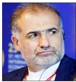
जैसी रणनीतिक चिंताओं तक आ गए हैं। उन्होंने तर्क दिया कि अमेरिका की ए महत्वाकांक्षाएँ भी पूरी नहीं हुईं। उन्होंने कहा कि शुरूआत में वे सत्ता परिवर्तन चाहते थे, लेकिन अब वे उस स्थिति में आ गए हैं, जहां वे केवल हॉर्मुज जलडमरूमध्य को खोलना चाहते हैं।