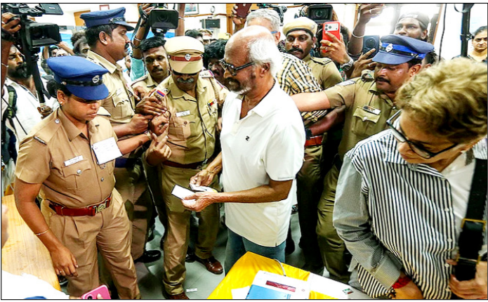
तमिलनाडू विधानसभा चुनाव में अपना वोट डालने के लिए वेनू के लिए रोजन केन्द्र पर पहुंचे अभिनेता राजनीकांत।

होर्मुज में विदेशी जहाजों पर सवार भारतीय नागरिक सुरक्षित- सरकार नई दिल्ली। सरकार ने आखिरी बार कहा है कि पश्चिम एशिया के होर्मुज जलडमरूमध्य में जिन दो विदेशी जहाजों पर हमला किया गया है उन पर सवार सभी भारतीय नागरिक सुरक्षित हैं और सरकार स्थिति पर नजर बनाए हुए है। दूसरी ओर रसाई गैस की कालाबाजारी और जमाखोरी के खिलाफ देश भर में अभियान जारी है और अब तक 1.5 लाख से अधिक