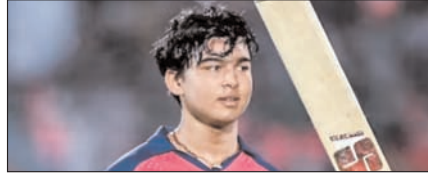
बैभव के सबसे तेज 500 आईपीएल रन खेल टाइम्स