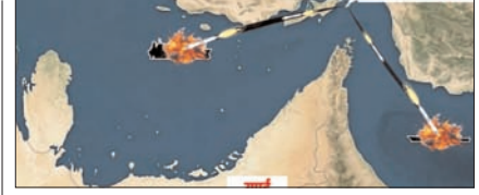
फारस की खाड़ी- होर्मुज स्ट्रेट में तेल रिसाव का खतरा पेज 12