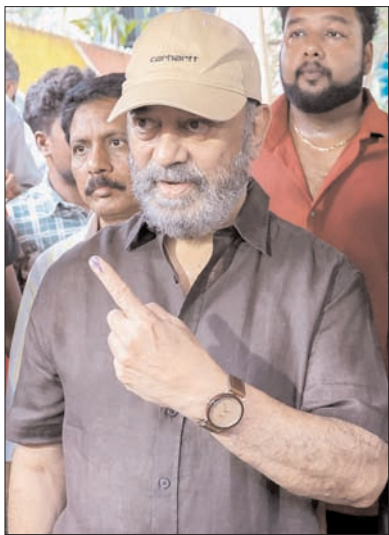
चेन्नई। अभिनेता कमल हासन मतदान के बाद फोटो खिंचवाते हुए।