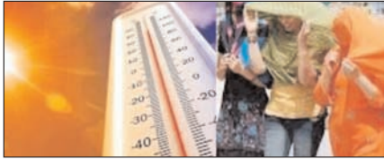
यूपी में अगले तीन दिनों तक भीषण हीटवेव! पेज 2

नई दिल्ली, मुजफ्फरनगर, देहरादून, हल्द्वारी, मुतादाबाद, बरेली, मेरठ व लखनऊ से प्रकाशित