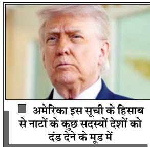
अमेरिका इस सूची के हिसाब से नाटो के कुछ सदस्यों देशों को सजा देने के मुद्दे में

वाशिंगटन। अमेरिकी राष्ट्रपति डोनाल्ड ट्रम्प प्रशासन ने नाटो (नाटो) देशों की एक खास सूची तैयार की है। इस सूची को शरारती और अच्छे सहयोगियों का नाम दिया गया है। कथित तौर पर इस सूची के जरिए उन देशों की पहचान की गई है जिन्होंने ईरान के साथ चल रहे युद्ध में अमेरिका का साथ दिया है। इस एक ऐसे कदम के तौर पर देखा जा रहा है, जिसका मकसद, अमेरिका के साथ खड़े देशों को इनाम मिलेगा और पीछे हट गए देशों को सजा भुगतनी पड़ सकती है। बताया जा रहा है सूची नाटो के महासचिव मार्क स्टे की इसी महीने हुई वाशिंगटन यात्रा से पहले तैयार की गई थी। रिपोर्ट के मुताबिक, इस विचार की शुरुआत दिसम्बर में अमेरिकी युद्ध सचिव पीट हेगसेथ ने की थी। उन्होंने एक रक्षा मंच पर कहा था कि जो देश आदर्श सहयोगी की तरह व्यवहार करेंगे, अमेरिका उन्हें विशेष सुविधाएं देगा। वहीं, जो देश अपनी सामूहिक रक्षा को जिम्मेदारी पूरी नहीं करेंगे, उन्हें इसके गंभीर नतीजे झेलने होंगे। अमेरिका इस सूची के हिसाब से नाटो के कुछ सदस्यों देशों को सजा देने के लिए कदम उठा सकता है। इसमें उन