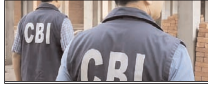
सीबीआई अधिकारियों को सजा संस्थागत भ्रष्टाचार पर सवाल सम्पादकीय