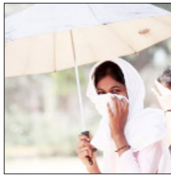
कृषि या बागवानी फसलों पर इसका प्रभाव सामान्यतः मामूली रहने की संभावना है, हालांकि लगातार गर्मी रहने पर जोखिम बढ़ सकता है। मौसम विभाग ने कहा है कि लोगों को खासकर दोपहर के समय लंबे समय तक धूप में रहने से बचना चाहिए और हल्के रंग के ढीले-ढाले सूती कपड़े पहनने चाहिए। बाहर निकलते समय सिर को कपड़े, टोपी या छतरी से ढककर रखना चाहिए। शरीर में पानी की कमी से बचने के लिए पर्याप्त मात्रा में तरल पदार्थ का सेवन करना जरूरी है। किसानों को खड़ी फसलों में नमी बनाए रखने के लिए शाम के समय हल्की सिंचाई करते रहना चाहिए, जबकि खेती, खनन और अन्य खुले क्षेत्रों को मौसम के अनुसार समायोजित करना चाहिए। वहीं पशुओं को दोपहर में चराने से बचना चाहिए और उन्हे छाया में रखकर पर्याप्त पानी उपलब्ध कराना जरूरी है।

लखनऊ, वार्ता उत्तर प्रदेश के अधिकांश जिलों में भीषण गर्मी और उष्ण लहर (हीट वेव) का प्रकोप जारी है। मौसम विभाग ने 24 अप्रैल से 26 अप्रैल तक के लिए रेड अलर्ट जारी किया है। 24 अप्रैल से 26 अप्रैल तक बांदा, चित्रकूट, कोशाम्बी, प्रयागराज, फतेहपुर, प्रतापगढ़, सोनभद्र, मिर्जापुर, चंदौली, वाराणसी, संत रविदास नगर, जौनपुर, गाजीपुर, आजमगढ़, मऊ, बलिया, बहराइच, लखीमपुर खीरी, सीतापुर, हरदोई, फर्रुखाबाद, कन्नौज, कानपुर देहात, कानपुर नगर, उन्नाव, लखनऊ, बाराबंकी, रायबरेली, अमेठी, सुल्तानपुर, अयोध्या और अंबेडकर नगर में लू का असर देखने को मिल सकता है।