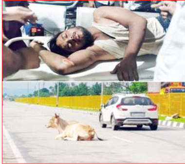
आक्रोशित ग्रामीणों ने प्रशासन से की सड़कों पर घूम रहे आवारा गोवंश को पकड़कर गौशाला में भेजने की मांग