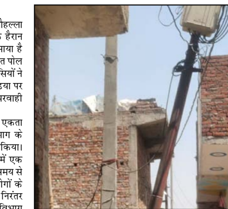
पोल लगाया गया था, लेकिन महीने बीत जाने के बाद भी लाईन को नए पोल पर

शाह टाइम्स संवाददाता बागपत। शहर कोतवाली क्षेत्र के मोहल्ला मुगलपुरा एकता कॉलोनी से एक हैरान करने वाला एक मामला सामने आया है जहां काफी समय से लोहे के विद्युत पोल की समस्या से झूज रहे मोहल्ले वासियों ने एक वीडियो बनाकर सोशल मीडिया पर वायरल कर विद्युत विभाग की लापरवाही उजागर की है।