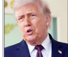
इसके साथ ही ट्रम्प ने 158 जहाजों का आंकड़ा भी दिया था

ट्रम्प का दावा: ईरान सैन्य और अन्य रूप से 'पूरी तरह से तबाह' हो चुका है