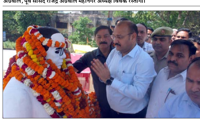
अंबेडकर मूर्ति पर माल्यार्पण करते जिलाधिकारी।