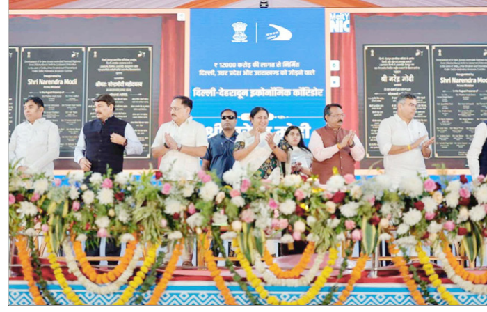
बाबासाहेब डॉ. भीमराव अंबेडकर की जयंती के अवसर पर प्रधानमंत्री नरेन्द्र मोदी के करकमलों से दिल्ली-देहरादून एक्सप्रेसवे को जनता को समर्पित किया गया, दिल्ली की मुख्यमंत्री रेखा गुप्ता भी इस कार्यक्रम में वचुंअली जुड़ीं।