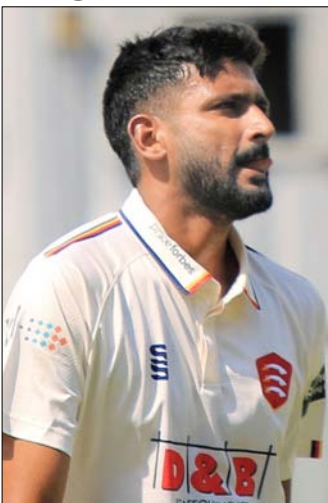
इसी ट्रान्शमेंट में उन्होंने मुंबई के खिलाफ 27 गेंदों पर नाबाद 64 रन भी बनाए थे। सीएसके ने अब तक पांच मैचों में दो जीत हासिल की है।