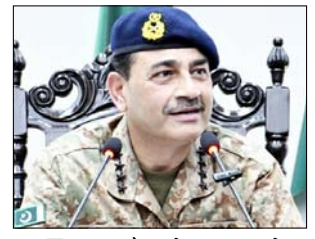
सात अप्रैल को शुरू हुआ दो सप्ताह का नाजुक युद्धविराम 20 अप्रैल को समाप्त होने वाला है

तेहरान। अमेरिका से मिले एक नए संदेश के साथ, पाकिस्तान के सेना प्रमुख आसिम मुनीर के नेतृत्व में एक उच्च स्तरीय पाकिस्तानी प्रतिनिधिमंडल पश्चिम एशिया में तनाव कम करने के प्रयास में इरान और अमेरिका के बीच वार्ता के एक नए दौर की संभावना पर ईरानी अधिकारियों के साथ बातचीत कर रहा है। सात अप्रैल को शुरू हुआ दो सप्ताह का नाजुक युद्धविराम 22 अप्रैल को समाप्त होने वाला है। इस्लामाबाद में रविवार को बिना किसी समझौते के समाप्त हुई प्रारंभिक वार्ता के बाद पाकिस्तान आगे की वार्ता के लिए समन्वय कर रहा है। पाकिस्तान के गृह मंत्री मोहसिन नकवी भी मध्यस्थता प्रयासों में शामिल हैं जबकि प्रधानमंत्री शहबाज शरीफ राजनयिक वार्ता को आगे बढ़ाने के लिए चार दिवसीय खाड़ी दौर के पहले पड़ाव के रूप में सऊदी अरब में हैं। पाकिस्तानी अधिकारी दूसरे दौर की वार्ता के लिए युद्धविराम को बढ़ाने की उम्मीद कर रहे हैं और क्षेत्रीय साझेदारों को यह समझाने की कोशिश कर रहे हैं कि वे अमेरिका पर प्रभाव का इस्तेमाल करके इरान के साथ