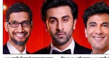
100 सूची में पहले शाहरुख खान, सचिन तेंदुलकर, नरेंद्र मोदी, दीपिका पादुकोण और महात्मा गांधी भी शामिल हो चुके हैं। मशहूर शोफ विकास खन्ना ने इसे गर्व का क्षण घोषित किया। उन्होंने कहा

शाह टाइम्स ब्यूरो नई दिल्ली। दुनिया की प्रतिष्ठित टाइम मैगजीन ने 2026 की टाइम 100 सूची जारी की, जिसमें भारत से जुड़ी कई प्रमुख हस्तियों को शामिल किया गया। इस साल सुंदर पिचाई, रणबीर कपूर और शोफ विकास खन्ना को वैश्विक प्रभाव के लिए सम्मानित किया गया। हर साल जारी होने वाली यह सूची मनोरंजन, तकनीक, विज्ञान, खेल, एंक्टिविज्म और अकादमिक क्षेत्रों के 100 सबसे प्रभावशाली लोगों को सूची होती है। टाइम मैगजीन की सूची