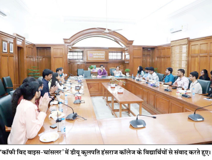
'कॉफी विद वाइस-चांसलर' में डीयू कुलपति हंसराज कॉलेज के विद्यार्थियों से संवाद करते हुए।