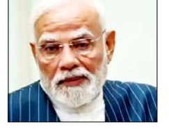
दोनों देश रक्षा, समीकन-डक्ट, क्वांटम और जैव प्रौद्योगिकी के क्षेत्र में भी अपनी साझेदारी को सुदृढ़ करेंगे

नई दिल्ली। प्रधानमंत्री नरेंद्र मोदी ने कहा है कि ऑस्ट्रिया के चांसलर क्रिश्चियन स्टॉकर की भारत यात्रा से दोनों देशों के बीच व्यापार और निवेश के क्षेत्र में नई ऊर्जा आएगी और ऑस्ट्रिया की विभिन्न क्षेत्रों में विशेषज्ञता तथा भारत की गति और पैमाना दुनिया के लिए विश्वसनीय आपूर्ति श्रृंखला सुनिश्चित करेगा। दोनों देश रक्षा, समीकन-डक्ट, क्वांटम और जैव प्रौद्योगिकी के क्षेत्र में भी अपनी साझेदारी को सुदृढ़ करेंगे।