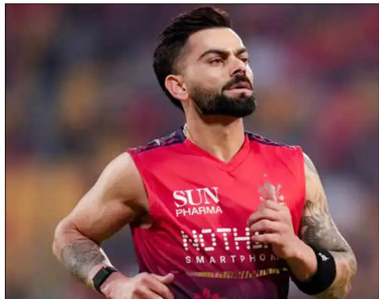
मैच में भी वह मैदान से बाहर रहे थे। कोहली ने बताया कि उस मैच में उनके घुटने में दर्द हुआ था और बुधवार के मैच से पहले भी वह पूरी तरह फिट नहीं थे। रजत पाटीदार बुधवार को एलएसजी के घुटने में दर्द हुआ था और बुधवार के मैच खिलाफ 13 गेंदों पर 27 रन बनाकर

बेंगलुरु, वार्ता। विराट कोहली आईपीएल में रन बनाने वालों की सूची में शीर्ष पर पहुंच गए और ऑरेंज कैप अपने नाम कर ली। उन्होंने लखनऊ सुपर जायंट्स के खिलाफ 34 गेंदों पर 49 रन बनाए और रॉयल चैलेंजर्स बेंगलुरु (आरसीबी) को चिन्नास्वामी स्टेडियम में 147 रन का लक्ष्य हासिल करने में मदद की। इम्पैक्ट प्लेयर के रूप में पहली बार उतरते हुए कोहली ने आरस. 10वीं के लिए सबसे ज्यादा रन बनाए और इस सीजन में अपने कुल रन 228 तक पहुंचा दिए।