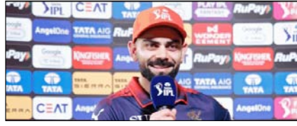
विराट कोहली ऑरेंज कैप की रेस में शीर्ष पर पहुंचे