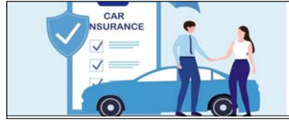
मोटर इंश्योरेंस में रखें इन बातों का ध्यान सम्पादकीय