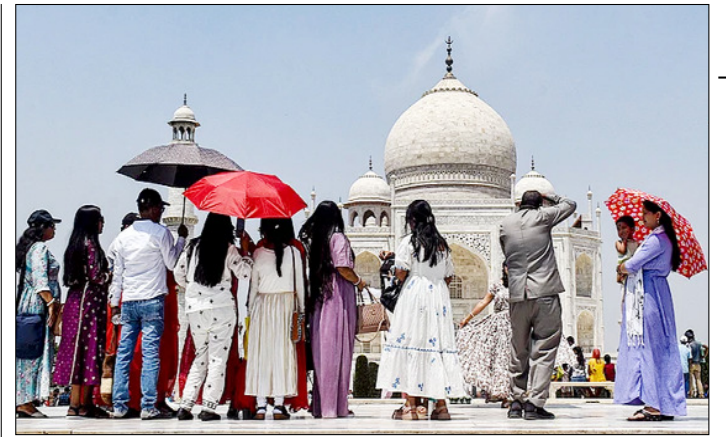
अगरा। गीष्ण गर्मी के बीच ताजमहल का दौरा करते पर्यटक।