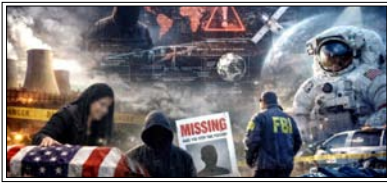
वैज्ञानिकों के लापता या मौत के सभी मामलों में अमेरिका की हाई-सिक्क्योरिटी रिसर्च संस्थाओं से जुड़े बताया जा रहा है।

वाशिंगटन। अमेरिका में न्यूक्लियर और स्पेस रिसर्च से जुड़े वैज्ञानिकों की मौत और गुमशुदगी के मामलों पर अब व्हाइट हाउस सवालियों के घेरे में है। 2023 से अब तक ऐसे 10 मामलों सामने आए हैं, जिनमें वैज्ञानिक या अधिकारी या तो लापता हो गए या संदिग्ध हालात में मरे। व्हाइट हाउस ब्रीफिंग में पहली बार प्रेस सचिव कैरोलिन लेविट से इन घटनाओं पर सवाल पूछा गया। जबकि उन्होंने कहा कि मैंने अभी संबंधित रिसर्चियों से इस बारे में बात नहीं की है। मैं ऐसा करूंगी और आपको जवाब दूंगी। उन्होंने आगे कहा कि अगर यह सही है, तो यह निश्चित तौर पर ऐसी बात है जिसे सरकार जांच के लायक मानेगी। उनके इस जवाब के बाद लोगों में नाराजगी देखने को मिली। कई लोगों ने आरोप लगाया कि सरकारी एजेंसियां इस पैटर्न को गंभीरता से नहीं ले रही हैं या फिर इसे छुपाने की कोशिश कर रही हैं। वैज्ञानिकों के लापता या मौत के सभी मामलों में अमेरिका की हाई-सिक्क्योरिटी रिसर्च संस्थाओं से जुड़े बताया जा रहा है। इनमें लास एलासोस नेशनल लैब, नासा का जेट