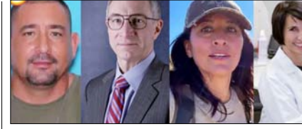
परमाणु-स्पेस पर रिसर्च करने वाले पांच अमेरिकी वैज्ञानिक गायब