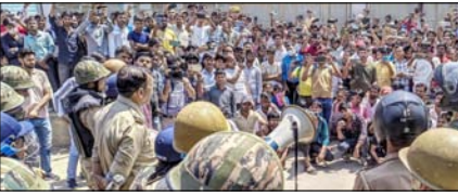
नोएडा प्रकरण: 66 गिरफ्तारियों में 45 गैर-श्रमिक

नई दिल्ली, मुजफ्फरनगर, देहरादून, हल्द्वानी, मुगदाबाद, बरेली, मेरठ व लखनऊ से प्रकाशित