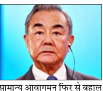
सामान्य आवागमन फिर से बहाल करने के प्रयास अंतर्राष्ट्रीय समुदाय की ओर से एक सर्वसम्मत आह्वान का प्रतिनिधित्व करते हैं। वांग ने कहा कि वर्तमान स्थिति युद्ध और शांति के बीच एक नाजुक मोड़ पर खड़ी है लेकिन इसके साथ उन्होंने यह भी कहा कि कूटनीतिक समाधान के लिए अवसर को धरवाजा भी खुल रहा है। इरानी

बीजिंग। चीन के विदेश मंत्री वांग इं ने अपने इरानी समकक्ष अब्बास अराघची से कहा है कि होमज जलडमरूमध्य को खोलना अंतर्राष्ट्रीय समुदाय की सर्वसम्मत मांग है। वांग ने इरान के विदेश मंत्री अब्बास अराघची से फोन पर बात करते हुए इस बात पर जोर दिया कि एक और जहां इरान की संप्रभुता, सुरक्षा और एक तटीय राज्य के रूप में उसके वैध अधिकारों के सम्मान की आवश्यकता है, वहीं दूसरी ओर इस जलडमरूमध्य से नौहन की स्वतंत्रता और समुद्री सुरक्षा को गारंटी भी दी जानी चाहिए वांग ने कहा कि इस जलडमरूमध्य से