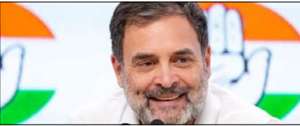
सैनिकों को मिले सम्मान जिसके हैं वे हकदार: राहुल गांधी

नई दिल्ली, मुजफ्फरनगर, देहरादून, हल्द्वानी, मुरादाबाद, बरेली, मेरठ व लखनऊ से प्रकाशित