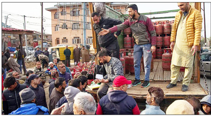
श्रीनगर। सड़क केनारे एक अधिकृत डीलर से घरेलू उपयोग के लिए तरलीकृत प्राकृतिक गैस के सिलेंडर लेने के लिए इंतजार कर रहे लोग।