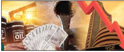
सुधार या बोझ? आम आदमी की जेब पर लगातार पड़ता भार