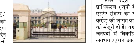
बड़ा फैसला सुनाया, मुस्लिम महिलाओं को राहत