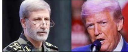
अमेरिका ने जमीनी हमला किया, तो कोई जिंदा नहीं बचेगा: ईरान