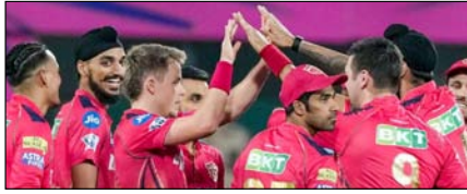
पंजाब किंग्स का हरफनमौला संतुलन रंग लाएगा