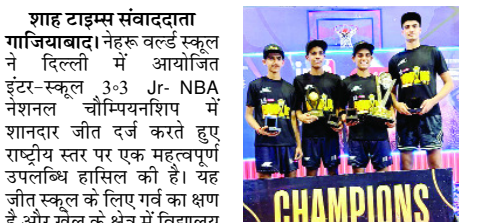
शाह टाइम्स संवाददाता गाजियाबाद। नेहरू वर्ल्ड स्कूल ने दिल्ली में आयोजित इंटर-स्कूल 3x3 JR- NBA नेशनल चैम्पियनशिप में शानदार जीत दर्ज करते हुए राष्ट्रीय स्तर पर एक महत्वपूर्ण उपलब्धि हासिल की है। यह जीत स्कूल के लिए गर्व का क्षण है और खेल के क्षेत्र में विद्यार्थियों की निरंतर प्रगति को दर्शाती है। हई की टीम ने जोनल राउंड में उत्कृष्ट प्रदर्शन करते हुए नेशनल चैम्पियनशिप में अपनी जगह बनाई। देशभर की लगभग 2,500 स्कूल टीमों के बीच प्रतिस्पर्धा करते हुए टीम ने पूरे टूर्नामेंट में शानदार निरंतरता, दृढ़ संकल्प और बेहतरीन टीमवर्क का प्रदर्शन किया। यह चैम्पियनशिप भारत में स्कूल स्तर की सबसे प्रतिष्ठित बास्केटबॉल प्रतियोगिताओं में से एक मानी जाती है और इसे वैश्विक स्तर पर भी बढ़ती पहचान मिल रही है। यह उपलब्धि खिलाड़ियों की कड़ी मेहनत, कौशलिंग स्टाफ के मार्गदर्शन और विद्यालय समुदाय के निरंतर सहयोग का परिणाम है। खिलाड़ियों ने कोर्ट पर उत्कृष्ट तालमेल, अनुशासन और खेल भावना का परिचय दिया। इस उपलब्धि को और