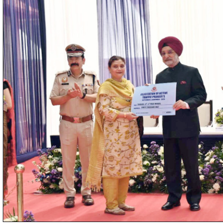
उपराज्यपाल तरनजीत सिंह संधू का ट्रैफिक मुख्यालय में ट्रैफिक पुलिस से जुड़े सबसे अच्छा प्रदर्शन करने वाले प्रहरियों को सम्मानित करते हुए।

भागीदारी को बढ़ावा देगी। सड़क पर उत्पन्न होने वाले संकटों के प्रबंधन में ट्रैफिक कर्मियों की आवश्यकताओं को पूरा करने के लिए, दो नए खरीदे गए 'आपदा प्रतिक्रिया वाहन' भी हरी झंडी दिखाकर रवाना किए गए। ये वाहन स्टील कटर, ट्री कटर, फ्लोटिंग वॉटर पंप, जनेरेटर, टावर लाइट आदि जैसी क्षमताओं और उपकरणों से सुसज्जित हैं। इस दौरान उपराज्यपाल को ट्रैफिक यूनिट के समग्र कामकाज के बारे में भी जानकारी दी गई, जिसमें यातायात विनियमन और नियमों को उल्लंघन पर कार्रवाई से जुड़े पहलू शामिल थे। उन्होंने ट्रैफिक मुख्यालय में 'प्रवर्तन इकाई' और 'जन इंटरफेस इकाई' का भी निरीक्षण किया।