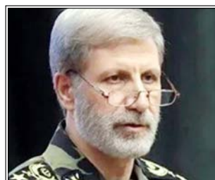
ईरान की सेना ने अमेरिकी जमीनी हमले की आशंका के मद्देनजर अपनी तैयारियाँ तेज कर दी हैं। आमीर हतामी ने सैन्य मुख्यालयों को अमेरिका और इजरायल की गतिविधियों पर 'पल-पल नजर' रखने के निर्देश दिए

तेहरान/वॉशिंगटन। अमेरिका-इजरायल के हमलों के 34वें दिन ईरान ने संभावित जमीनी अभियान को लेकर कड़ी चेतावनी देते हुए कहा है कि यदि अमेरिकी सेना ने जमीनी हमला करने की कोशिश की तो कोई भी जीवित नहीं बचेगा। ईरान की सेना ने अमेरिकी जमीनी हमलों की आशंका के मद्देनजर अपनी तैयारियाँ तेज कर दी हैं। सशस्त्र बलों के प्रमुख आमीर हतामी ने सैन्य मुख्यालयों को अमेरिका और इजरायल की गतिविधियों पर 'पल-पल नजर' रखने के निर्देश दिए हैं। सरकारी समाचार एजेंसी इरना द्वारा जारी वीडियो में हतामी ने कहा कि यदि दुश्मन जमीनी कार्रवाई करता है तो 'एक भी व्यक्ति को जीवित नहीं बचाना चाहिए।'