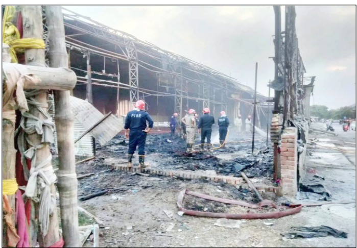
नंद नगरी स्थित पंडाल में लगी भीषण आग को बुझाते फायर ब्रिगेडियर के कर्मचारीगण।