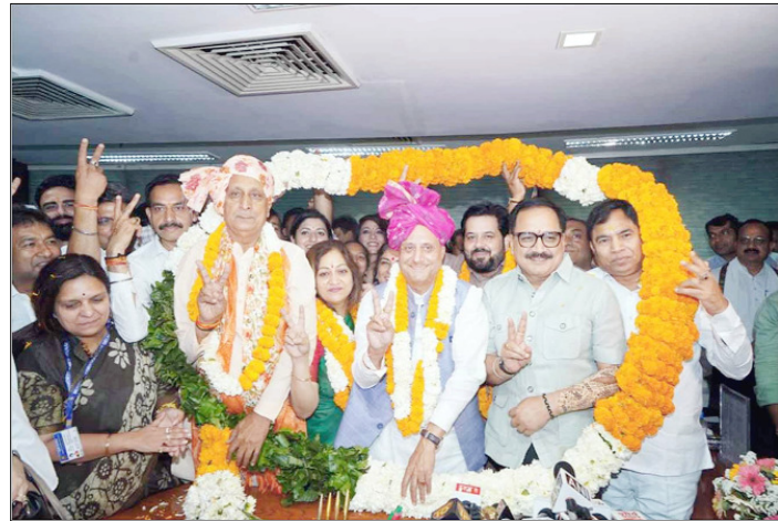
दिल्ली भाजपा अध्यक्ष नवनिर्वाचित महापौर, उपमहापौर, नेता सदन एवं स्थाई समिति सदस्यों का अभिनंदन करते हुए।

उन्हें बताया गया कि वे कर्नाट प्लेस पुलिस स्टेशन के पास एनडीएमसी की मल्टीलेवल कार पार्किंग और बाबा खड़क सिंह मार्ग पर श्री हनुमान मंदिर के सामने बनी पार्किंग में वाहन खड़े कर सकते हैं।