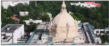
यूपी विधानसभा के विशेष सत्र की तैयारी, महिला आरक्षण पर सियासी घमासान तय पेज 2

नई दिल्ली, मुम्बई, देहरादून, हल्द्वानी, मुम्बई, बरेली, मेरठ व लखनऊ से प्रकाशित