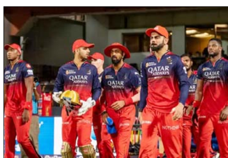
पॉइंट्स टेबल में बीच में फंसी हुई है और उसका नेट रन रेट भी नगेटिव है। बंगलुरु की टीम ने इसी सीजन में पहले गुजरात टाइटन्स को पांच विकेट से हराया था और इस बार भी वह अपनी बल्लेबाजी की ताकत और अनुशासित गेंदबाजी के संतुलित तालमेल पर ही भरोसा करेगी। विराट कोहली

अहमदाबाद, वार्ता। मौजूदा चैंपियन रॉयल चैलेंजर्स बंगलुरु आईपीएल 2026 प्लेऑफ की दौड़ में अपनी पकड़ और मजबूत करने की कोशिश करेगी, जब गुरुवार को यहां नरेंद्र मोदी स्टेडियम में सीजन के 42वें मैच में उसका सामना गुजरात टाइटन्स से होगा। आरसीबी इस मुकाबले में जबरदस्त फॉर्म में उतर रही है, उसने अपने आठ में से छह मैच जीते हैं और 1-919 के शानदार नेट रन रेट के साथ पॉइंट्स टेबल पर दूसरे स्थान पर है। वहीं, गुजरात टाइटन्स का प्रदर्शन इस सीजन में उतार-चढ़ाव भरा रहा है, जिसमें उसे चार जीत और चार हार मिली हैं, जिससे वह