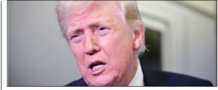
ईरान में हार से बचने को अमेरिका रास्ता तलाश रहा: अमेरिकी विशेषज्ञ पेज 12