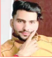
प्रेमिका और उसके पति के खिलाफ रिपोर्ट दर्ज

शाह टाइम्स संवाददाता नगीना। नगीना देहात थाना क्षेत्र के ग्राम जुलाहापुर के जंगल में आज सुबह एक 26 वर्षीय युवक का शव मिलने से सनसनी फैल गई। युवक के सिर में गोली मारकर हत्या की गई है। मृतक की मां की तहरीर पर पुलिस ने उसकी प्रेमिका बताई जा रही महिला और उसके पति के खिलाफ हत्या का मुकदमा दर्ज कर लिया है।