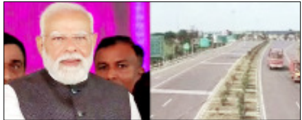
पश्चिमी उग्र के मेरठ को पूर्वी उत्तर प्रदेश के प्रयागराज से जोड़गा, 3.5 किमी लंबा इमरजेंसी लैंडिंग फैसिलिटी तैयार, वायुसेना के एयरक्राफ्ट को आपात स्थिति में लैंड कर सकेंगे

लखनऊ। उत्तर प्रदेश के सबसे बड़े ग्रीनफील्ड प्रोजेक्ट गंगा एक्सप्रेस का लोकार्पण प्रधानमंत्री नरेंद्र मोदी ने बुधवार को हरदोई में किया। 594 किलोमीटर लंबा गंगा एक्सप्रेसवे प्रदेश के सबसे बड़ी ग्रीनफील्ड इंफ्रास्ट्रक्चर प्रोजेक्ट में से एक है, जिससे 3-5 साल से भी कम समय में पूरा किया गया है।