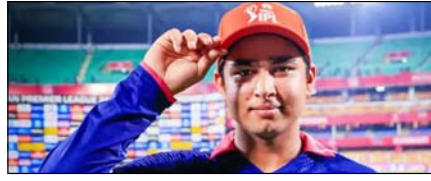
राजस्थान रॉयल्स के सूर्यवंशी ने फिर किया ऑरेंज कैप पर कब्जा खेल टाइम्स