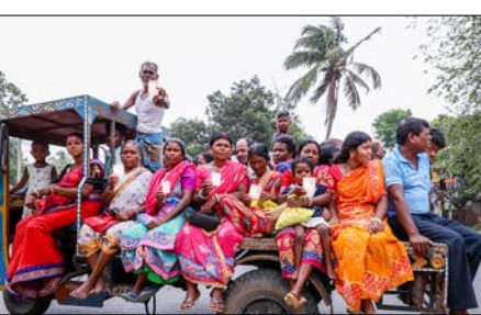
उदयनारायणपुर में एक बुजुर्ग की मौत हो गई। टीएमसी महासचिव अभिषेक बनर्जी ने दावा किया कि बुजुर्ग अपने बेटे के साथ वोट डालने गए थे। केंद्रीय बलों ने उन्हें धक्का दिया और मारपीट की। बुजुर्ग को अस्पताल ले जाया गया, जहां उन्हें मृत घोषित कर दिया गया। जिन 142 सीटों पर वोटिंग हो रही है, उनमें से 123 सीटों पर टीएमसी ने 2021 के विधानसभा चुनाव में जीत दर्ज की थी। पहले फेज की 152 सीटों पर 23 अप्रैल को रिकॉर्ड 93 फीसदी मतदान हुआ था। 4 मई को रिजल्ट आएंगे।

उत्तर 24 परगना में टीएमसी-भाजपा कार्यकर्ताओं में हिंसा दावा: हावड़ा में CRPF की पिटाई से बुजुर्गों की मौत