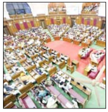
महिला आरक्षण को लेकर सियासी घमासान होना तय कांग्रेस भी अपने रुख को स्पष्ट करने की तैयारी में

लखनऊ। उत्तर प्रदेश विधानसभा का विशेष सत्र गुरुवार को आयोजित होने जा रहा है, जिसे लेकर सियासी सरगर्मियां तेज हो गई हैं। एक ओर जहां विपक्ष अपनी रणनीति तय करने में जुटा है, वहीं सत्तारूढ़ एनडीए में महिला आरक्षण के मुद्दे पर समाजवादी पार्टी और कांग्रेस को घेरने की पूरी तैयारी कर ली है।