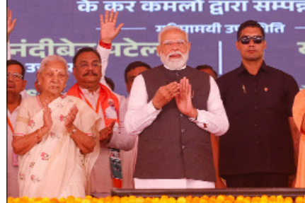
केशव प्रसाद मौर्य और वृजेश पाठक, साथ ही भाजपा के प्रदेश अध्यक्ष और केंद्रीय मंत्री पंकज चौधरी भी उपस्थित थे।

शहदोई। प्रधानमंत्री नरेंद्र मोदी ने बुधवार को यहाँ 594 किलोमीटर लंबे गंगा एक्सप्रेसवे का उद्घाटन किया और इसी के साथ ही उत्तर प्रदेश के अवसंरचना विकास में एक ऐतिहासिक अध्याय जुड़ गया। यह राज्य की कोकटिविटी और आर्थिक महत्वाकांक्षाओं में एक महत्वपूर्ण कदम है। प्रधानमंत्री ने स्थल पर एक पौधा लगाया और मुख्यमंत्री योगी आदित्यनाथ के साथ एक्सप्रेसवे पर पैदल चलकर इसके डिजाइन और विशेषताओं का जायजा लिया। इस अवसर पर राज्यपाल आनंदीबेन पटेल, केंद्रीय मंत्री जितिन प्रसाद, उपमुख्यमंत्री