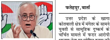
जयराम रमेश का दावा: एरना अमेरिका को खुश करने के लिए किया गया है

कांग्रेस ने आरोप लगाया है कि रक्षा मंत्री राजनाथ सिंह ने आतंकवाद के मामलों में पाकिस्तान को 'वलीन चिट' दे दी है और दावा किया कि ऐसा अमे. रिका को खुश करने के लिए किया गया है।