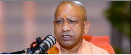
उत्तर प्रदेश पुलिस में जल्द पूरी होगी 81 हजार पदों पर भर्ती: योगी

नई दिल्ली, मुजफ्फरनगर, देहरादून, हल्द्वानी, मुतादाबाद, बरौली, मेरठ व लखनऊ से प्रकाशित