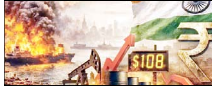
ईरान-अमेरिका युद्ध से दुनिया में लगा महंगाई का तड़का