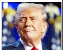
कहा: अगर उनकी शर्तें नहीं मानी तो वह उनके नागरिक बुनियादी ढांचे-जैसे पुलों और विद्युत पावर प्लांट्स को निशाना बनाकर नष्ट कर देंगे

वाशिंगटन। अमेरिका के राष्ट्रपति डोनाल्ड ट्रम्प ने शुक्रवार को ईरान को चेतावनी दी है कि वह ईरान के और भी पुलों और बिजलीघरों को तबाह कर देंगे। उन्होंने ईरान से कहा है कि जो 'किया जाना चाहिए', उसे 'तेजी' से करे। अमेरिका के राष्ट्रपति डोनाल्ड ट्रम्प ने ईरान को चेतावनी दी है कि अगर उनकी शर्तें नहीं मानी तो वह उनके नागरिक बुनियादी ढांचे-जैसे पुलों और विद्युत पावर प्लांट्स को निशाना बनाकर तबाह कर देंगे। ट्रम्प ने सोशल मीडिया पर लिखा कि अमेरिकी सेना ने 'ईरान में अभी तक नष्ट करने की प्रक्रिया भी शुरू नहीं की है' और कहा 'पहले पुल, फिर पावर प्लांट्स' को लक्ष्य बनाया जाएगा। उन्होंने लिखा कि अगला नंबर पुलों का है, फिर बिजलीघरों का। ईरान के नए शासन को पता है कि क्या