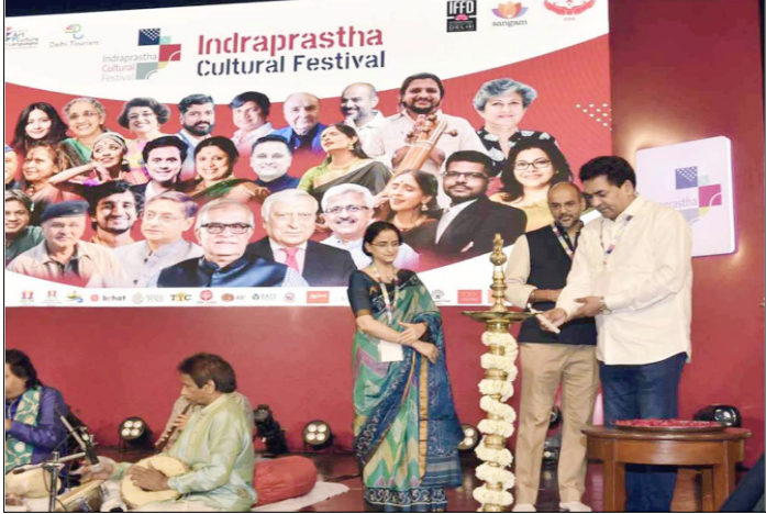
इंद्रप्रस्थ कल्चरल फेस्टिवल 2026 का शुभारंभ करते कला, संस्कृति एवं भाषा, पर्यटन एवं श्रम मंत्री कपिल मिश्रा।

होते हैं, जो जल्दी खत्म हो जाते हैं। ठेला चलाने वालों, छोटे दुकानदारों और किसान पर रहने वाले लोगों के लिए एक स्थिति ज्यादा गंभीर है, क्योंकि वह बड़े सिलिंडर का खर्च नहीं उठा सकते। मजदूरी में उन्हें महंगे विकल्पों का सहारा लेना पड़ रहा है। अभी तक पुलिस की सख्ती नहीं होने से गैस की कालाबाजारी करने वालों को खुली छूट थी, जिसकी वजह से हर गली और मोल्ले में 80 से 90 रुपये में एक किलो गैस मिले जाती थी लेकिन गैस किल्लत होते ही अवैध रिफिलिंग करने वालों प्रति किलो गैस के दाम बढ़कर 200 से 400 रुपये कर दिए।