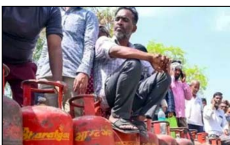
वाले उपभोक्ता न्यूनतम 35 दिनों में बुकिंग करा सकते हैं। इसके अलावा उच्चवला योजना और ग्रामीण एजेंसियों से गैस कनेक्शन प्राप्त करने वाले उपभोक्ता न्यूनतम 45 दिनों में बुकिंग करा सकते हैं। एलपीजी के घरेलू कनेक्शन के

शाह टाइम्स संवाददाता नोएडा। जिले में घरेलू एलपीजी गैस सिलेंडर की किल्लत बरकरार बनी हुई है। उपभोक्ताओं का कहना है कि बुकिंग से लेकर सिलेंडर लेने तक में दिक्कतें आ रही हैं। इससे उपभोक्ताओं को समय पर सिलेंडर की आपूर्ति नहीं हो पा रही है। जिले में इंडेन गैस, भारत गैस और एचपी गैस की 64 गैस एजेंसियां हैं। इन तीनों एजेंसियों के जिले में करीब 10 लाख एलपीजी के घरेलू उपभोक्ता हैं। वहीं, आठ हजार वाणिज्यिक कनेक्शन के उपभोक्ता हैं। गैस एजेंसियों के अनुसार घरेलू कनेक्शन पर एकल सिलेंडर प्राप्त करने वाले उपभोक्ता न्यूनतम 25 दिनों में बुकिंग करा सकते हैं। वहीं दो सिलेंडर प्राप्त करने