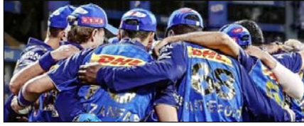
मुंबई के खिलाफ दिल्ली का लक्ष्य इतिहास बदलना