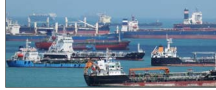
होर्मुज स्ट्रेट में ईरान-ओमान के साथ मिलकर करेगा खेल