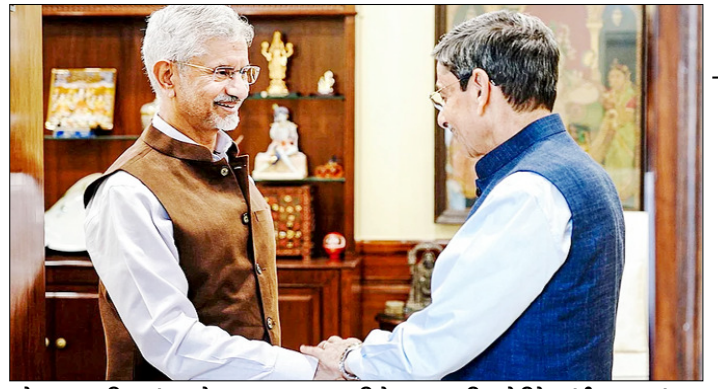
कोलकाता। पश्चिम बंगाल के राज्यपाल आरएन एच के साथ हाथ मिलाते विदेश मंत्री एस जयशंकर।

अड्डे के इस्तेमाल की अनुमति अमेरिकी बमवर्षक विमानों को देने से इन्कार कर दिया था। यूरोपीय देशों के इन्कार से अमेरिकी राष्ट्रपति डोनाल्ड ट्रम्प भी काफी खफा हैं। वो टुथ के अलावा विभिन्न प्लेटफॉर्म पर खुलकर विरोध जता चुके हैं। कई मीडिया साक्षात्कार में खुले तौर पर नाटो और यूरोपीय देशों के खिलाफ राय जाहिर कर चुके हैं। लगभग हर दूसरे दिन वो टुथ पर मदद न करने का तंज कसते हुए कह देते हैं कि अमेरिका याद रखेगा। जिस होर्मुज स्ट्रेट पर कब्जे का वो दावा करते थे अब उसे लेकर भी उन्होंने रुचि नहीं दिखाई है। राष्ट्र के नाम अपने संबोधन में कहा कि अब उसकी जिम्मेदारी वो उठाए, जिन्हें वहां से अपना सामान ले जाना है। हाल ही में डेली टेलीग्राफ को दिए एक साक्षात्कार में ट्रम्प ने ईरान-इजरायल संघर्ष के दौरान नाटो सहयोगियों, खासकर ब्रिटेन और फ्रांस की ओर से सैन्य मदद न देने पर नाराजी जताई। ट्रम्प ने नाटो को कागजी शेर करार दिया और अमेरिका के गठबंधन से बाहर निकलने की धमकी दी।