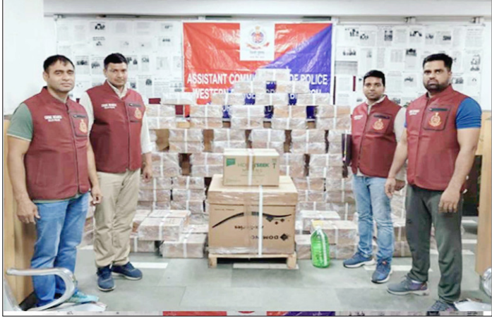
दिल्ली पुलिस की अपराध शाखा ने द्वारका में एक्सपायर्ड खाने-पीने के सामान की रीपैकेजिंग की खेप जब्त कर मीडिया के सामने पेश किया।