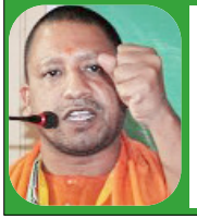
शिवपुर स्थित कंपोजिट विद्यालय में सीएम ने किया 'स्कूल चलो अभियान' का भव्य शुभारंभ स्कूलों के प्रधानाचार्य गांव मोहल्लों में निकलें व अभिभावकों से संवाद करें

सीएम ने शिक्षा को समाज की सबसे बड़ी शक्ति बताते हुए कहा कि प्रदेश सरकार का लक्ष्य है कि कोई भी बच्चा शिक्षा से वंचित न रहे। सीएम योगी ने विद्यार्थियों को उज्ज्वल भविष्य की शुभ कामना दी और स्कूल चलो अभियान की