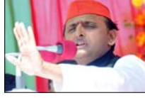
युवाओं से जुड़ने का किया आह्वान

लखनऊ। यूपी विधानसभा चुनाव से पहले समाजवादी पार्टी के राष्ट्रीय अध्यक्ष अखिलेश यादव ने पीडीए (पिछड़ा, दलित, अल्पसंख्यक) को अभी से धार देना शुरू कर दिया है। सपा अध्यक्ष ने कहा कि पीडीए के उत्थान के लिए हमें खुद आगे आना होगा और अपना वक्त बदलना होगा। अखिलेश यादव ने पीडीए को जिताएंगे, संविधान को बचाएंगे का नारा दिया।