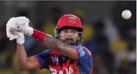
श्रेयस अय्यर पर लगा 24 लाख का जुर्माना चेन्नई। पंजाब किंग्स के कप्तान श्रेयस अय्यर पर जुर्मोना लगाया गया है, क्योंकि उनकी टीम ने चेन्नई के एएम चिदंबरम स्टेडियम में चेन्नई सुपर किंग्स के खिलाफ टाटा आईपीएल 2026 के मैच नंबर 7 के दौरान धीमी ओवर-रेट बनाए रखी। चूंकि आईपीएल की आचार संहिता के अनुच्छेद 2-22 के तहत यह उनकी टीम का इस सीजन का दूसरा अपराध था - जो न्यूनतम ओवर-रेट अपराधों से संबंधित है - इसलिए अय्यर पर 24 लाख का जुर्माना लगाया गया। प्लेइंग रूक के बाकी सदस्यों पर, जिसमें इम्पैक्ट प्लेयर भी शामिल है, या तो 6 लाख रुपये या उनकी संबंधित मैच फीस का 25 प्रतिशत जुर्माना लगाया जाएगा।

चेन्नई। पंजाब किंग्स के कप्तान ने कहा कि हमने ड्रेसिंग रूम में फैंसला किया है कि चाहे कुछ भी हो जाए हम एक ब्रांड वाली क्रिकेट खेलेंगे जो एक-दूसरे को प्रभावित करने वाली होगी, न कि बाहर के लोगों को।