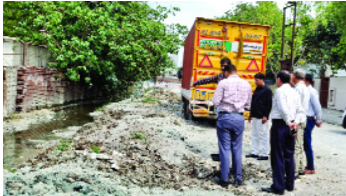
गई तथा एफआईआर करने के आदेश दिए गए। औद्योगिक क्षेत्र में नाले जाम हो जाने से पानी सड़कों पर भर जाने से हो रही समस्या का निरीक्षण किया गया। जिसके लिए सफाई कार्य करने के आदेश दिए हैं तथा नवनिर्मित सड़कों, नालों का निरीक्षण कराया।

निरीक्षण उद्योग बंधू की बैठक में रखी गई शिकायतों के क्रम में किया गया। यद् गैस एजेंसी व-33 के नजदीक यूपीएसआईडीए के पार्क पर अवैध कब्जा प्रकरण में निरीक्षण कराया। अवैध रूप से कबाड़ी, मोटो की दुकान संचालित करने वालों के खिलाफ कार्यवाही की