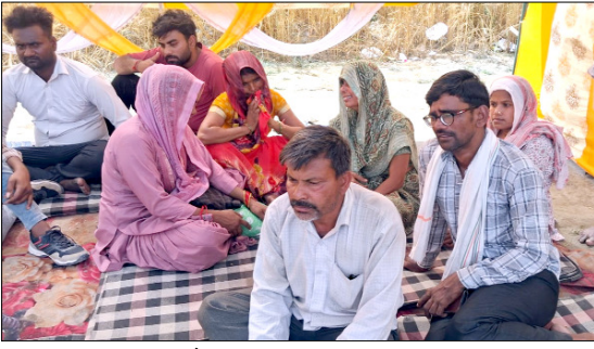
मखदूमपुर गंगा घाट पर बैठा पीड़ित परिवार।

एनडीआरएफ की टीम ने संभाला मोर्चा, राजनीतिक दलों के लोग पहुंचे मखदूमपुर गंगा घाट