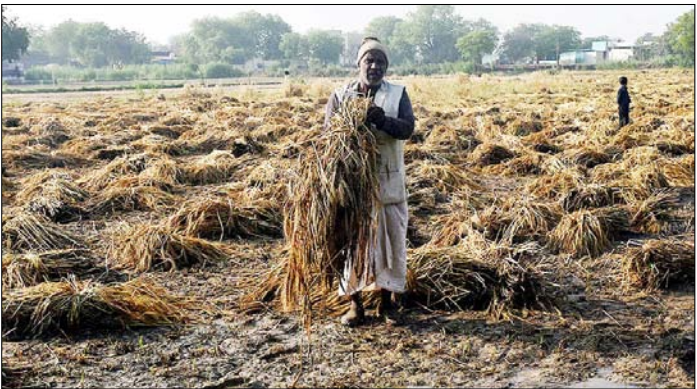
आगरा। कई गांवों में बाहिर और ओलावृष्टि के बाद क्षतिग्रस्त हुए गेहूं की फसल को इकट्ठा करता मजदूर।

अमेरिका की राजनीति में भारतीय मूल भागीदारी लगातार बढ़ रही वाशिंगटन। अमेरिका की राजनीति में भारतीय मूल के लोगों की भागीदारी लगातार बढ़ रही है। इसी कड़ी में रिनी संपत ने इतिहास रचते हुए वाशिंगटन डीसी मेयर चुनाव के बैलेट में जगह बना ली है। वह इस पद के लिए बैलेट तक पहुंचने वाली पहली दक्षिण एशियाई उम्मीदवार बन गई हैं। तमिलनाडु के थनी में जन्मी रिनी संपत बचपन में ही अमेरिका चली