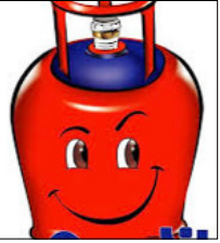
सिलेंडर वितरित किए जा चुके हैं। 5 किलो वाला एफडीएल एलपीजी सिलेंडर अब सिर्फ वैध आईडी दिखाकर बिना एड्रेस प्रूफ के भी लिया जा सकता है। मार्च 2026 से अब तक 3.5 लाख से ज्यादा नए पीएनजी कनेक्शन चालू किए गए हैं और पीएनजी को बढ़ावा देने के लिए इंटरप्रिथ

पश्चिम एशिया में तनाव के बीच भारत सरकार ने ऊर्जा आपूर्ति, नागरिक सुरक्षा और जरूरी सेवाओं को सुचारू बनाए रखने के लिए कई अहम कदम उठाए हैं। सरकार ने साफ किया है कि देश में पेट्रोल, डीजल और एलपीजी की कोई कमी नहीं है और सभी रिफायनरी पूरी क्षमता से काम कर रही हैं। सरकार ने घरेलू जरूरतों को प्राथमिकता देते हुए एलपीजी और पीएनजी की सप्लाई मजबूत की है। शुरुआत को ही 51 लाख एलपीजी सिलेंडर डिलीवर किए जा चुके हैं और पीएनजी की सप्लाई में अब तक 5.7 लाख छोटे (5 किलो)