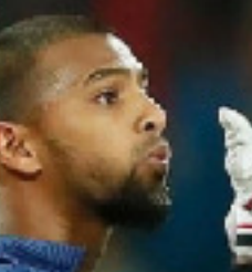
हैदराबाद की एक गर्म दोपहर में, दो टीमों बहुत अलग-अलग तरह के बोझ लेकर मैदान में उतर रही हैं, एक के पास आत्मविश्वास का बोझ है, तो दूसरी के पास सुधार करने का

इस सीजन में हैदराबाद की सफलता में उन्हें एक अहम खिलाड़ी बनाया है। यहां तक कि उनके कप्तान, ईशान किशन ने भी टीम को आगे बढ़ाने में अपनी भूमिका निभाई है।) उन्होंने कप्तानी और बैटिंग, दोनों जम्मेदारियों को पूरी लगन के साथ निभाया है। कुल मिलाकर, हैदराबाद लगातार 200 से ज्यादा का स्कोर बना रही है यह एक ऐसा ट्रेड है जो न सिर्फ उनकी अच्छी फॉर्म को दिखाता है, बल्कि उनकी खेल की सोच को भी जाहिर करता है। हालांकि, उनकी गेंदबाजी की कहानी थोड़ी ज्यादा उलझी हुई है। जहां जयदेव उनादकट और ईशान मलिंगा जैसे जवायंट्स की टीम है, जो इस सीजन के शुरुआती दौर में अभी भी अपनी लय और तालमेल की तलाश में है। उनके अभियान की शुरुआत हार के साथ हुई थी। उन्होंने खिल्लाडी की ताकत को खिल्लाडी बनाया है। यहां तक कि उनकी गेंदबाजी की इन कमियों को भरपाई की जा सके। दूसरी तरफ लखनऊ सुपर जयंट्स की टीम है, जो इस सीजन के शुरुआती दौर में अभी भी अपनी लय और तालमेल की