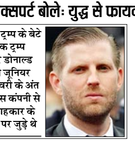
ट्रम्प के बेटे एरिक ट्रम्प और डॉनाल्ड ट्रम्प जूनियर फरवरी के अंत में इस कंपनी से सलाहकार के तौर पर जुड़े थे

वाशिंगटन। अमेरिका में एक ड्रोन स्टार्टअप को लेकर विवाद खड़ा हो गया है, जिसमें राष्ट्रपति ट्रम्प के बेटे एरिक ट्रम्प और डॉनाल्ड ट्रम्प जूनियर जुड़े हैं। रिपोर्ट के मुताबिक, फ्लोरिडा की पावरस कंपनी मिडिल ईस्ट के देशों को अपने ड्रोन सिस्टम बेचने की कोशिश कर रही है। ट्रम्प के बेटे एरिक ट्रम्प और डॉनाल्ड ट्रम्प जूनियर फरवरी के अंत में इस कंपनी से सलाहकार के तौर पर जुड़े थे, ये वही समय था जब अमेरिका और इजरायल ने ईरान पर हमला किया था। हालांकि दोनों को कंपनी में बड़ी हिस्सेदारी मिलने की उम्मीद है। पावरस से जुड़े अधिकारियों ने अबू धाबी में अधिकारियों से मुलाकात की है। बातचीत इस बात पर हुई है कि ट्रम्प को हथियार और ड्रोन डिफेंस सिस्टम बेचे जा सकते हैं, क्योंकि वह ईरान के खिलाफ