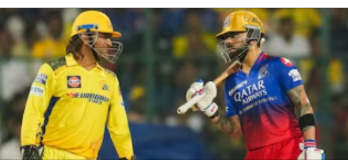
रॉयल चैलेंजर्स बेंगलुरु बनाम चेन्नई सुपर किंग्स कभी भी सिर्फ क्रिकेट नहीं रहा है, यह एक नाटक है, और कभी-कभी, आंकड़ों के साथ परोसा गया दिल टूटने का एहसास भी

है। क्रिकेट की भाषा में, इसे मोमेंटम (गति) कहा जाता है। इंसानी भाषा में, इसे आत्मविश्वास कहा जाता है जो कभी-कभी घमंड को हट तक पहुंच जाता है। दूसरी ओर, चेन्नई एक ऐसे अनुभवी सज्जन की तरह आती है जिसने अपना चरमा कहीं खो दिया हो। उन्हें पता है कि क्या करना है, उन्हें याद है कि यह कैसे करना है, लेकिन किसी तरह, इस सीजन के शुरुआती मैचों में इसे ठीक से कर पाना उनके लिए मुश्किल रहा है। दो हारों ने पहले ही दबे-छिपे सवाल उठाने शुरू कर दिए हैं, ऐसे सवाल जो पहले तो विनम्रता से पूछे जाते हैं, और फिर जब नतीजे बेहतर नहीं होते तो जोर से दोहराए जाते हैं। बेंगलुरु की बल्लेबाजी कुछ ऐसी रही है कि दर्शक गेंदबाजों के अस्तित्व को ही भूल जाते हैं। विराट कोहली एक बार फिर इस उथल-पुथल के बीच एक मजबूत सहारा बने हैं,