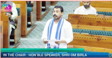
IN THE CHAIR : HON'BLE SPEAKER, SHRI OM BIRLA

शाह टाइम्स संवाददाता धामपुर। देशभर में तेजी से लगाए जा रहे स्मार्ट विद्युत मीटर को लेकर संसद में उस वक्त माहौल गर्म हो गया, जब सांसद चंद्रशेखर ने इस मुद्दे को जोरदार तरीके से उठाते हुए आम जनता, विशेष रूप से दिहाड़ी मजदूरों की समस्याओं को सदन के सामने रखा। उन्होंने सरकार की नीतियों पर सवाल खड़े करते हुए कहा कि जहाँ प्राइवेट कंपनियों 'पहले इस्तेमाल करो, फिर विश्वास करो' की बात करती हैं, वहीं वर्तमान व्यवस्था में गरीबों के सामने 'पहले बिल भरने, फिर बिजली' जैसी स्थिति बन गई है। सांसद चंद्रशेखर ने कहा कि देश में करोड़ों लोग ऐसे हैं जो रोजाना मेहनत करके दिहाड़ी कमाते हैं। कई बार उन्हें लगातार कई दिनों तक काम नहीं मिलता, जिससे उनकी आमदनी रुक जाती है। ऐसी स्थिति में यदि वे समय पर बिजली बिल जमा नहीं कर पाते हैं, तो उनकी बिजली आपूर्ति काटे दी जाती है। उन्होंने सवाल उठाया कि जब घर में अंधेरा होगा तो