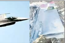
फाइटर जेट को मार गिराया गया। यह ईरान के दक्षिण-पश्चिम हिस्से में उड़ान भर रहा था। एफ-5ई फाइटर जेट के कू को ढूँढने के लिए अमेरिकी विमान 1-10 अटैक एयरक्राफ्ट पहुंचा तो उस पर भी हमला हुआ। ए-10 हमले के बाद कुवैत के हवाई क्षेत्र तक पहुंच गया, जहां पायलट ने सुरक्षित तरीके से इजेक्ट किया। पायलट सुरक्षित है, हालांकि विमान कुवैत में क्रैश हो गया। एफ-5ई में दो कू मंत्र थे। इनमें से एक को सुरक्षित निकाल लिया गया है, जबकि दूसरा लापता है। ईरानी सरकारी मीडिया का

पिछले 24 घंटों में अमेरिका के दो सैन्य विमान और सर्च ऑपरेशन में लगे दो ब्लैकहाक हेलीकॉप्टर ईरान के हमले का शिकार हुए