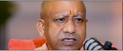
सत्ता नहीं, संस्कार की है भाजपा की विकास यात्रा: योगी

नई दिल्ली, मुजफ्फरनगर, देहरादून, हल्द्वारी, मुतादाबाद, बरौली, मेरठ व लखनऊ से प्रकाशित