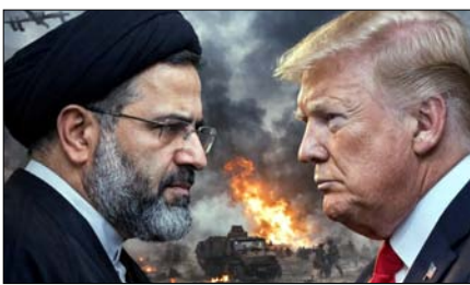
अलग सेट तैयार कर लिया है और उसे औपचारिक रूप दे दिया है। इस संभावना को नजरअंदाज नहीं किया जा सकता है कि इस्फाहन में पायलट बचाव अभियान केवल एक छल-कपट था, जिसका मकसद ईरान के संबंधित यूरेनियम को जब्त करना था। यह युद्धविराम

तेहरान, वार्ता पश्चिम एशिया में जारी संघर्ष थमने का नाम नहीं ले रहा है। एक तरफ अमेरिका की ओर से सैन्य कार्रवाई की चेतावनियां मिल रही हैं, तो दूसरी ओर ईरान खाड़ी क्षेत्र में अमेरिकी संपत्तियों को निशाना बना रहा है। इस बीच, ईरान ने सोमवार को कहा कि उसने मध्यस्थों की ओर से पेश किए गए प्रस्तावों पर अपना जवाब तैयार कर लिया है। हालांकि, उसने यह भी कहा कि जब तक अमेरिका व इजरायल हमले तेज करते रहेंगे, वह सीधी वार्ता में शामिल नहीं होगा। ईरानी विदेश मंत्रालय ने कहा कि अमेरिका का 15 सूत्रीय प्रस्ताव अत्यधिक मांगों वाला है। हमने अपनी मांगों का एक