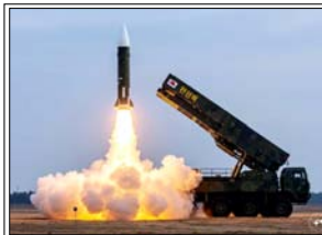
अमेरिका और इजरायल ने 28 फरवरी को ईरान में कई ठिकानों पर हमले किए, जिसमें तेहरान भी शामिल था