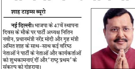
राजनीतिक पार्टी बनने तक का यह सफर कार्यकर्ताओं के त्याग और समर्पण का परिणाम है। प्रधानमंत्री मोदी ने सोशल मीडिया पर एक वीडियो और असम में एक चुनावी रैली के माध्यम से कार्यकर्ताओं को बधाई दी और राष्ट्र प्रथम का संदेश दिया। उन्होंने कहा कि भाजपा हमेशा 'राष्ट्र प्रथम'

शाह टाइम्स ब्यूरो नई दिल्ली। भाजपा के 47वें स्थापना दिवस के मौके पर पार्टी अध्यक्ष नितिन नवीन, प्रधानमंत्री नरेंद्र मोदी और गृह मंत्री अमित शाह के साथ-साथ कई वरिष्ठ नेताओं ने पार्टी के नेताओं और कार्यकर्ताओं को शुभकामनाएं दीं और 'राष्ट्र प्रथम' के संकल्प को दोहराया। श्री नवीन ने इस मौके पर भाजपा मुख्यालय पर कार्यक्रमों को संबोधित करते हुए 'राष्ट्र सर्वोपरि' के संकल्प को दोहराया और 'विकसित भारत' के लक्ष्य को प्राप्त करने के लिए एकजुट होकर काम करने का आह्वान किया। उन्होंने कहा कि जनसंघ से लेकर दुनिया की सबसे बड़ी