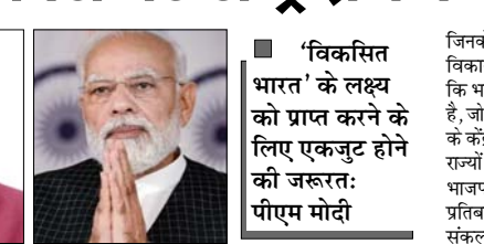
'विकसित भारत' के लक्ष्य प्राप्त करने के लिए एकजुट होने की जरूरत: पीएम मोदी के सिद्धांत पर चलते हुए समाज सेवा में अग्रणी रही है। उन्होंने पार्टी कार्यकर्ताओं को निरव्यर्थ सेवा, समर्पण और सुशासन के प्रति प्रतिबद्धता को पराहना करते हुए कहा कि कार्यकर्ताओं के अथक प्रयासों ने पार्टी को आज इस मुकाम तक पहुंचाया है। उन्होंने उन अनगिनत कार्यकर्ताओं को भी याद किया,