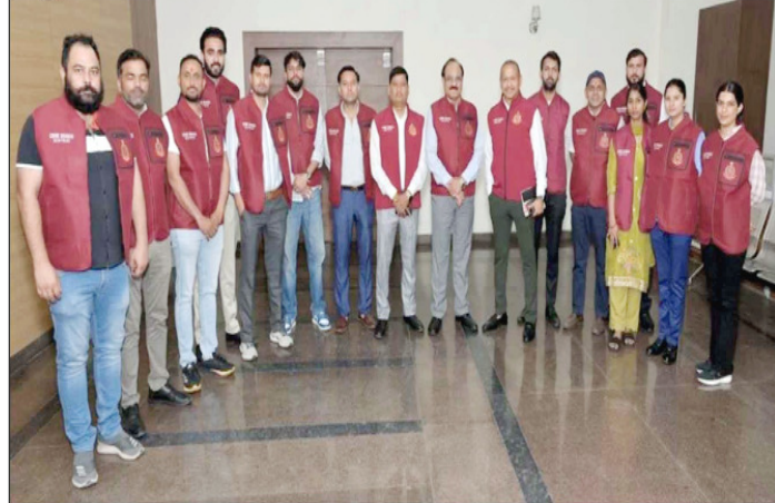
दिल्ली पुलिस की क्राइम टीम ने अंतरराष्ट्रीय हथियार सप्लायर और आतंकी गतिविधियों में संलिप्त दो को गिरफ्तार किया।

और बहादुर शाह जफर मार्ग (दिल्ली गेट से आईटीओ) के दोनों तरफ यातायात से बचें। स्टैडियम में एंटी केंबल उसी गेट से होगी, जिसके लिए अनुमति दी गई है। दक्षिण, पूर्व और पश्चिम तरफ से एक्सप्रेस रूट्स बनाए गए हैं। स्टैडियम के पास पार्किंग सख्ती से प्रतिबंधित है। केवल लेबल वाले वाहनों को ही पार्किंग की अनुमति मिलेगी। दर्शकों की सुविधा के लिए माता सुंदरी रोड, राजघाट पावर हाउस रोड और वेलोड्रॉम रोड पर फ्री पार्किंग तथा पार्क एंड राइड की व्यवस्था की गई है।