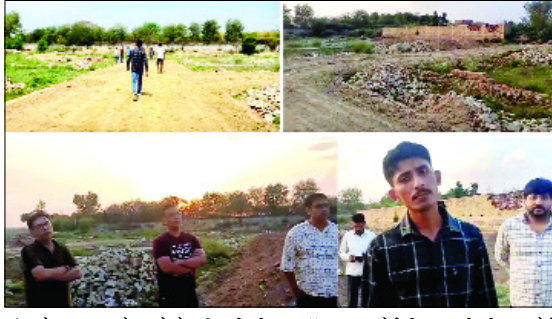
संवारेन का सपना देख रहे थे। रजिस्ट्री भी पूरी हो चुकी थी, स्वामित्व और कब्जा उनके नाम हो चुका था। लेकिन रविवार को जब 1-2 परिवार अपने प्लॉट देखने पहुंचे तो उनके होश उड़ गए। उनके प्लॉट पर ना कोई दीवार बची थी, ना कोई निशान ख बल्कि बीच से मिट्टी का अवैध रास्ता (मड रोड) बन चुका था। जानकारी फिल्टर ही बाकी पीडित भी मौके पर पहुंचे तो पता चला कि 15