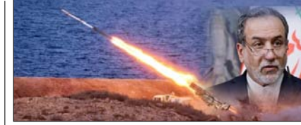
युद्ध कई साल चला, तो भी नहीं होगी मिसाइलों की कमी: ईरान