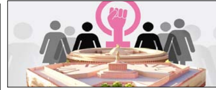
राजनीति का नया भूगोल लोकसभा विस्तार व नारी शक्ति का नया उदय सम्पादकीय