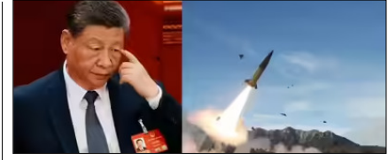
ईरान को हथियार देने की तैयारी में चीन