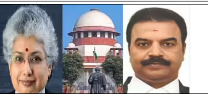
सुप्रीम कोर्ट के न्यायाधीश जस्टिस चंद्रचूड़