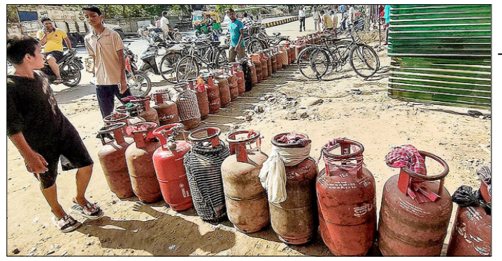
पटना। आपूर्ति संकट के बीच खाली एलपीजी सिलेंडरों के साथ लाइन में लगे लोग।

तेहरान। भारत में ईरानी दूतावास ने शुक्रवार को एलान किया कि उसने जंग के दौरान वित्तीय मदद के लिए बनाए गए सभी खाते बंद कर दिए। इसके साथ ही भारतीय नागरिकों के समर्थन और मदद के लिए शुक्रिया कहा। दूतावास ने अपनी सोशल मीडिया पोस्ट में कहा कि भारतीय नागरिकों से मिले भारी समर्थन और उनकी मदद को देखते हुए अब वे खाते निष्क्रिय कर दिए गए हैं। इसके साथ ही लोगों से दूतावास के नाम पर चल रहे किसी भी खातों में पैसा भेजने की अपील की गई है। इससे पहले 22 मार्च को ईरानी दूतावास ने भारतीयों की नेक इरादों और इंसानियत के लिए उन्हें शुक्रिया कहा था।