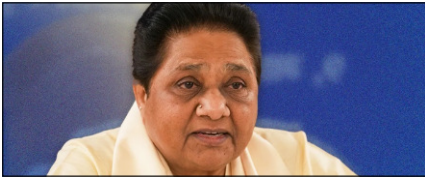
बाबा साहब भीम राव अंबेडकर ने भी शिक्षा को सामाजिक परिवर्तन का मुद्दा बनाया

नई दिल्ली, मुजफ्फरनगर, देहरादून, हल्द्वानी, मुरादाबाद, बरेली, मेरठ व लखनऊ से प्रकाशित