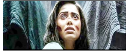
नूसरत का साहसी चुनाव ही बनाता है उनकी अलग पहचान