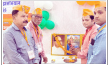
सम्भल-वायू केंद्र प्रशासन में महा प्रशिक्षण अभियान में पूर्व वैन दयल उपाध्यक्ष के छिद्र पा सुभित काले

सम्भल। प्रदेश में आगामी 2027 में होने वाले विधानसभा चुनावों के करीब आते-आते भाजपा को ओर से इसकी तैयारियां तेज कर दी हैं। चुनावी बिगुल बजने में अभी काफी समय है लेकिन भाजपा आला कमान के निर्देशों पर प्रशिक्षण शिविरों का आयोजन कर पदाधि