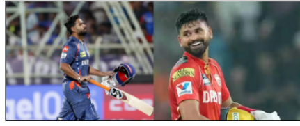
जीत का लक्ष्य बरकरार रखने उतरेगी एलएसजी खेल टाइम्स