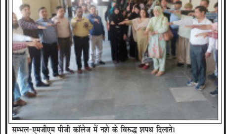
सम्भल-एमजीएम पीजी कॉलेज में नशे के विरुद्ध शपथ दिलाते।