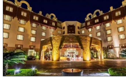
चल रही बातचीत किसी नतीजे पर नहीं पहुंची, तो सिर्फ इजरायल को दोष नहीं दिया जा सकता।

इस्लामाबाद। पाकिस्तान की राजधानी इस्लामाबाद में ईरान और अमेरिका के बीच जारी सीजफायर वार्ता का दूसरा दौर शुरू हो गया है। पहला राउंड 2 घंटे तक चला था। मीडिया रिपोर्ट्स के मुताबिक इस दौरान ईरान ने लेबनान पर तुरंत इजरायली हमले रोकने की मांग की। इस बैठक में एक्सपर्ट्स ने सुरक्षा, राजनीति, सेना, अर्थव्यवस्था और कानून से जुड़े