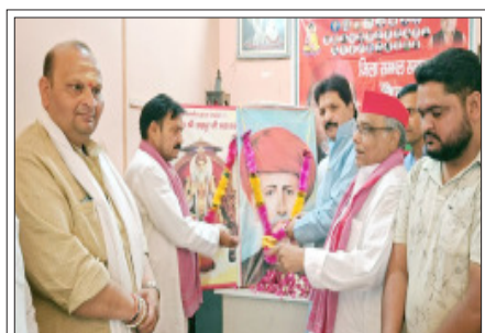
सम्भल-कैम्प कार्यालय पर महात्मा ज्योतिबा फुले जयंती मनाते सपा पदाधिकारी।