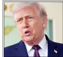
इसके साथ ही ट्रम्प ने 158 जहाजों का आंकड़ा भी दिया था

ट्रम्प का दावा: ईरान सैन्य और अन्य रूप से 'पूरी तरह से तबाह' हो चुका है