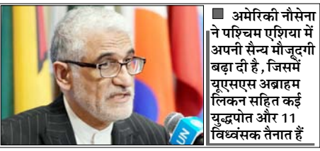
ईरानी राष्ट्रपति ने पोप की आलोचना करने की निंदा की

न्यूयॉर्क। ईरान ने अमेरिका द्वारा उसके बंदरगाहों की कथित नौसैनिक नाकेबंदी की कड़ी निंदा करते हुए इसे उसकी संप्रभुता और क्षेत्रीय अखंडता का 'घोर उल्लंघन' बताया है। संयुक्त राष्ट्र में ईरान के स्थायी प्रतिनिधि अमीर साईद इरावानी ने संयुक्त राष्ट्र महासचिव एंटीनियो गुटेरेस और संयुक्त राष्ट्र सुरक्षा परिषद के अध्यक्ष को लिखे पत्र में इस कदम को 'अवैध आक्रामक कार्रवाई' करार दिया, जो क्षेत्रीय और अंतर्राष्ट्रीय शांति के लिए खतरा है। इरावानी ने कहा कि 12 अप्रैल को यूएस सेंट्रल कमांड द्वारा घोषित यह नाकेबंदी संयुक्त राष्ट्र चार्टर के अनुच्छेद 2(4) का उल्लंघन है और अंतर्राष्ट्रीय कानून के तहत 'आक्रामकता का स्पष्ट उदाहरण' है। उन्होंने आरोप लगाया कि यह कदम ईरान के बंदरगाहों से आने-जाने वाले समुद्री यातायात को रोकने का प्रयास है, जिससे न केवल ईरान के संप्रभु अधिकारों में हस्तक्षेप हो रहा है, बल्कि तीसरे देशों और वैध समुद्री व्यापार के अधिकारों का भी उल्लंघन हो रहा है। ईरानी दूत ने चेतावनी दी कि तेहरान अपनी संप्रभुता और राष्ट्रीय हितों की रक्षा के लिए 'सभी आवश्यक और उचित कदम' लेगा।