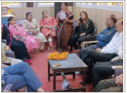
सम्भल - इतिहास संकलन समिति की बैठक को सम्बोधित करती महिला वक्ता।

इतिहास संकलन समिति की बैठक में लिया निर्णय तहसील स्तर पर सौंपी जायेगी जिम्मेदारी