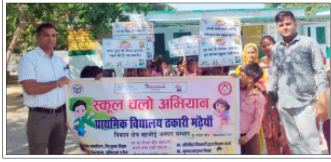
सम्भल। स्कूल चलो अभियान रैली निकालकर स्कूल चलने को जागरूक करते नौनिहाला