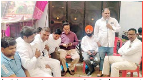
देन है कि समाज में बराबर का हक मिला। उन्होंने कहा है कि हम