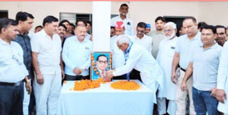
सपा के कैंप कार्यालय पर कार्यक्रम