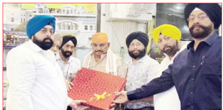
कार्यक्रम का शुभारंभ श्री गुरु