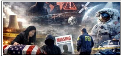
वैज्ञानिकों के लापता या मौत के सभी मामलों में अमेरिका की हाई-सिक्वोरिटी रिसर्च संस्थाओं से जुड़े बताए जा रहे हैं

वाशिंगटन। अमेरिका में न्यूक्लियर और स्पेस रिसर्च से जुड़े वैज्ञानिकों की मौत और गुमशुदगी के मामलों पर अब व्हाइट हाउस सवालियों के घेरे में हैं। 2023 से अब तक ऐसे 10 मामलों सामने आए हैं, जिनमें वैज्ञानिक या अधिकारी या तो लापता हो गए या संदिग्ध हालात में मरे।