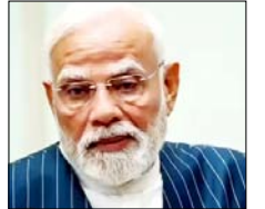
दोनों देश रक्षा, समीकन-डक्ट, क्वांटम और जैव प्रौद्योगिकी के क्षेत्र में भी अपनी साझेदारी को सुदृढ़ करेंगे

नई दिल्ली। प्रधानमंत्री नरेंद्र मोदी ने कहा है कि ऑस्ट्रिया के चांसलर क्रिश्चियन स्टॉर्कर को भारत यात्रा से दोनों देशों के बीच व्यापार और निवेश के क्षेत्र में नई ऊर्जा आएगी और ऑस्ट्रिया की विभिन्न क्षेत्रों में विशेषज्ञता तथा भारत की गति और पैमाना दुनिया के लिए विश्वसनीय आपूर्ति श्रृंखला सुनिश्चित करेगा। दोनों देश रक्षा, समीकन-डक्ट, क्वांटम और जैव प्रौद्योगिकी के क्षेत्र में भी अपनी साझेदारी को सुदृढ़ करेंगे।