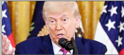
अमेरिका अभी तक इस युद्ध में सबसे उन्नत एफ-35 समेत कई विमान और ड्रोन को गंवा चुका

वाशिंगटन। पिछले एक महीने से जारी ईरान-अमेरिका युद्ध अब डोनाल्ड ट्रम्प के लिए भारी पड़ता नजर आ रहा है। अमेरिका अभी तक इस युद्ध में सबसे उन्नत एफ-35 समेत कई विमान और ड्रोन को गंवा चुका है। अब अमेरिका ने माना है कि उसे हाल ही में बड़ी तादात में उन्नत ड्रोन खोने पड़े हैं। अमेरिकी नौसेना ने आधिकारिक पुष्टि की कि उसका लापता ड्रोन 'एमक्यू-4सी ट्राइटन' खाड़ी क्षेत्र में क्रैश हो गया। यह पहली बार है जब अमेरिका ने अपने बड़े नुकसान को कबूला है। यह जानकारी यूएस डिफेंड स्ट्रेटिज नेवल सेप्टी कमांड की हालिया रिपोर्ट में सामने आई है।