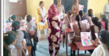
बबराला- प्रेमलता कॉलेज जगन्नाथपुर में बालिकाओं को जागरूक करते।

वित्तीय वर्ष 2026-27 के लिए भी अप्रैल माह से नए आवेदनों की प्रक्रिया शुरू हो चुकी है। योजना के तहत बेटियों को जन्म से लेकर उनकी उच्च शिक्षा तक छह अलग-अलग चरणों में आर्थिक सहायता प्रदान की जाती है। जिला प्रवेशन अधिकारी ने बताया कि पहला लाभ बेटों के जन्म पर, दूसरा एक वर्ष बाद सभी अनिवार्य टीके लगाने पर, तीसरा कक्षा एक में प्रवेश पर, चौथा कक्षा छह में, पांचवां कक्षा नौ में और छठा व