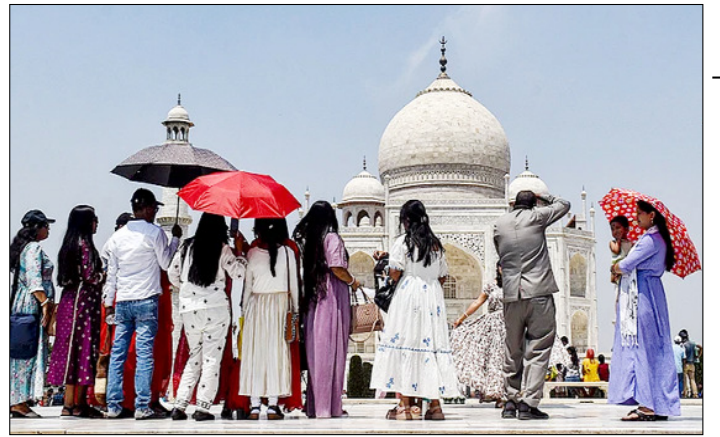
अगरा। गीष्ण गर्मी के बीच ताजमहल का दौरा करते पर्यटकों