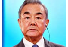
सामान्य आवागमन फिर से बहाल करने के प्रयास अंतर्राष्ट्रीय समुदाय की ओर से एक सर्वसम्मत आह्वान का प्रतिनिधित्व करते हैं। वांग ने कहा कि वर्तमान स्थिति युद्ध और शांति के बीच एक नाजुक मोड़ पर खड़ी है लेकिन इसके साथ उन्होंने यह भी कहा कि कूटनीतिक समाधान के लिए अवसर को धरवाजा भी खुल रहा है। ईरानी

बीजिंग। चीन के विदेश मंत्री वांग इं ने अपने ईरानी समकक्ष अब्बास अराघची से कहा है कि होमज जलडमरूमध्य को खोलना अंतर्राष्ट्रीय समुदाय की सर्वसम्मत मांग है। वांग ने ईरान के विदेश मंत्री अब्बास अराघची से फोन पर बात करते हुए इस बात पर जोर दिया कि एक ओर जहां ईरान की संप्रभुता, सुरक्षा और एक तटीय राज्य के रूप में उसके वैध अधिकारों के सम्मान की आवश्यकता है, वहीं दूसरी ओर इस जलडमरूमध्य से नौहन की स्वतंत्रता और समुद्री सुरक्षा को गारंटी भी दी जानी चाहिए वांग ने कहा कि इस जलडमरूमध्य से