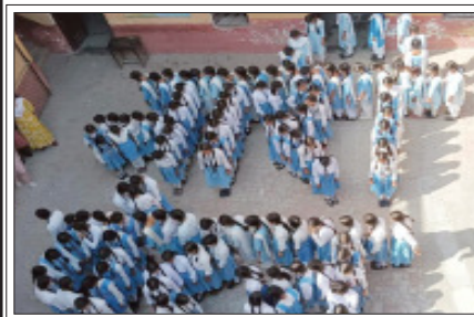
सम्भल-सरस्वती कन्या उच्चतर मा. विद्यालय में मानव श्रृंखला बनती छात्रांयें।