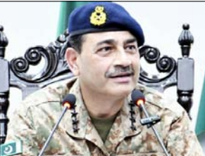
सात अप्रैल को शुरू हुआ दो सप्ताह का नाजुक युद्धविरोध 20 अप्रैल को समाप्त होने वाला है

तेहरान। अमेरिका से मिले एक नए संदेश के साथ, पाकिस्तान के सेना प्रमुख आसिम मुनीर के नेतृत्व में एक उच्च स्तरीय पाकिस्तानी प्रतिनिधिमंडल पश्चिम एशिया में तनाव कम करने के प्रयास में ईरान और अमेरिका के बीच वार्ता के एक नए दौर की संभावना पर ईरानी अधिकारियों के साथ बातचीत कर रहा है। सात अप्रैल को शुरू हुआ दो सप्ताह का नाजुक युद्धविरोध 22 अप्रैल को समाप्त होने वाला है। इस्लामाबाद में रविवार को बिना किसी समझौते के समाप्त हुई प्रारंभिक वार्ता के बाद पाकिस्तान आगे की वार्ता के लिए समन्वय कर रहा है। पाकिस्तान के गृह मंत्री मोहसिन नकवी भी मध्यस्थता प्रयासों में शामिल हैं जबकि प्रधानमंत्री शहबाज शरीफ राजनैतिक वार्ता को आगे बढ़ाने के लिए चार दिवसीय खाड़ी दौर के पहले पड़ाव के रूप में सऊदी अरब में हैं। पाकिस्तानी अधिकारी दूसरे दौर की वार्ता के लिए युद्धविरोध को बढ़ाने की उम्मीद कर रहे हैं और क्षेत्रीय साझेदारों को यह समझाने की कोशिश कर रहे हैं कि वे अमेरिका पर प्रभाव का इस्तेमाल करके ईरान के साथ