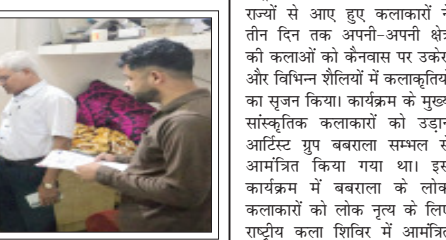
सम्भल- बीयूएमएस क्लीनिक में चल रहे ऑपरेशन थियेटर की जांच करते नगर मजिस्ट्रेट