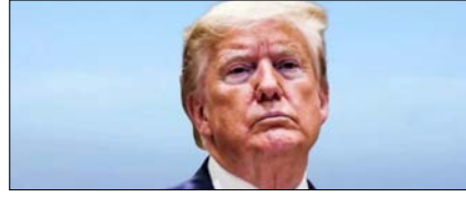
ईरान से समझौते के लिए खुद पाकिस्तान जाएंगे ट्रम्प! पेज 12