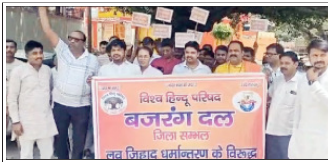
सम्भल जिहाद के विरोध में प्रदर्शन करते विहिप व बजरंग दल के कार्यकर्ता।