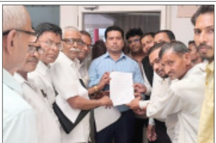
सम्भल- सांकरा पुल का नामकरण करने की मांग को ज्ञापन देते।

गुजरात पाल महासभा के अध्यक्ष में सौंपा ज्ञापन