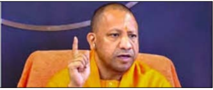
उप में अपराध नियंत्रण के लिए 500 फॉरेंसिक एक्सपर्ट्स तैयार पेज 2

नई दिल्ली, मुजफ्फरनगर, देहरादून, हल्द्वानी, मुरादाबाद, बरेली, मेरठ व लखनऊ से प्रकाशित