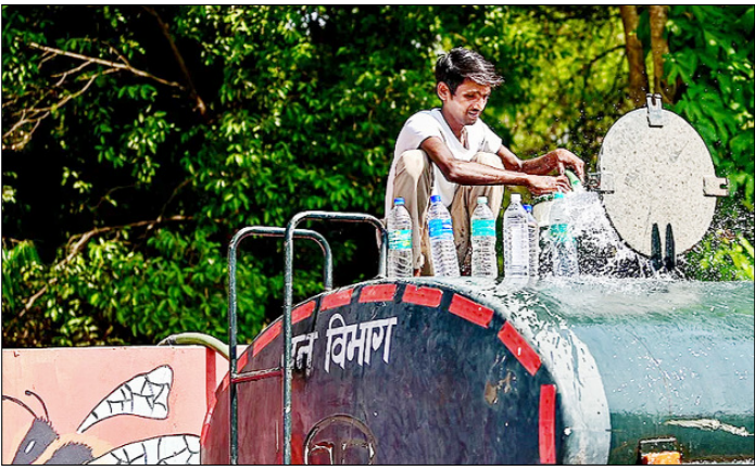
प्रयागराज। भीषण गर्मी में पानी के टैंकर के ऊपर से पानी की बोतलें भरता व्यक्ति।