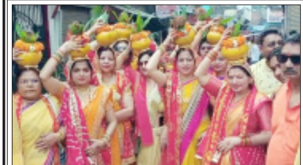
सम्भल- नौ कुंडीय महायज्ञ को कलश यात्रा निकालती महिलाएं।