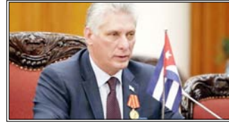
डियाज कैनेल ने यह बात एक रैली में कही, जिसमें सैकड़ों लोग शामिल हुए थे

दोनों देशों के बीच तनाव बना हुआ है। अमेरिका की ऊर्जा नाकेबंदी के कारण क्यूबा का संकट और गहरा गया है। इस हफ्ते की शुरुआत में ट्रम्प ने कहा था कि ईरान के साथ जंग खत्म होने के बाद उनका प्रशासन क्यूबा पर फोकस कर सकता है। उन्होंने कहा कि हम इसे खत्म करने के बाद क्यूबा की ओर भी जा सकते हैं। उन्होंने क्यूबा को विफल देश बताया और कहा कि यह लंबे समय से खराब तरीके से चलाया जा रहा है। जनवरी के शुरुआत में