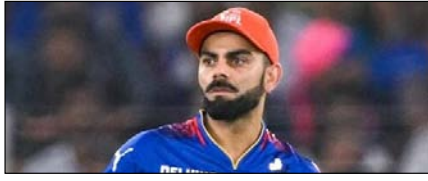
बेंगलुरु-दिल्ली के बीच बड़े मुकाबले में विराट पर रहेगी सबकी नजरें खेल टाइम्स