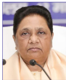
रैली के लिए नहीं जुटा पाए सौ कार्यकर्ता

शाह टाइम्स ब्यूरो बिजनौर। अंबेडकर जयंती पर बसपा के सबसे शर्मनाक प्रदर्शन ने साफ संकेत दे दिए हैं कि अब जनपद में इस पार्टी का कोई भी जनाधार नहीं बचा है। गौरतलब है कि एक वक्त में जनपद को बसपा का गढ़ कहा जाता था। यहां पर सभी विधायक बसपा के ही थे। जिला पंचायत अध्यक्ष भी बसपा का था और ज्यादातर ब्लॉक प्रमुख भी बसपा के ही थे। बिजनौर एवं नगीना सीट से सांसद भी बसपा के ही थे। हालांकि दोनों सांसद सपा से गठबंधन की वजह से ही बने थे। वैसे तो सत्ता से हटने के बाद बसपा का ग्राफ तेजी के साथ नीचे गिरा था। मगर लोकसभा चुनाव में सपा के साथ गठबंधन करने के बाद बसपा को नई ऊर्जा मिली थी। इसके बावजूद बसपा सुप्रीमो मायावती ने सपा से गठबंधन तोड़ लिया था। इसके बाद बसपा की हालत प्रदेश में इतनी ज्यादा खराब हो गई है कि आज यह सभासद एवं ग्राम प्रधान पद का चुनाव जीतने की स्थिति में भी नहीं है।