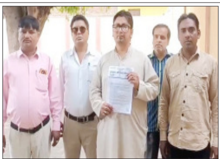
सम्भल-स्मार्ट मीटरों के विरोध में ज्ञापन देने जाते आजाद अधिकार सेना के कार्यकर्ता।

राष्ट्रपति के नाम ज्ञापन नगर मजिस्ट्रेट को सौंपा, स्मार्ट मीटर व्यवसायिक उपयोग तक सीमित करने की मांग