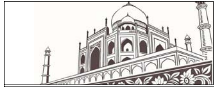
घरोघरों में घड़कता भारतीय इतिहास सम्पादकीय