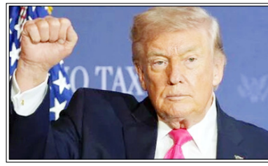
मोदी के साथ फोन पर उनकी बातचीत 'बहुत अच्छी' रही: ट्रम्प

वाशिंगटन। अमेरिकी राष्ट्रपति डोनाल्ड ट्रम्प ने कहा है कि ईरान के साथ उनके रिश्ते बहुत अच्छे हैं। 40 दिनों से अधिक की जंग के बाद तनावपूर्ण शांति के बीच आई इस टिप्पणी को उनके यू-टर्न की तरह भी पेश किया जा रहा है। इसके अलावा उन्होंने भारत और अमेरिका के संबंधों पर भी टिप्पणी की। ट्रम्प ने प्रधानमंत्री नरेंद्र मोदी को अपना 'दोस्त' बताते हुए कहा कि मोदी के साथ फोन पर उनकी बातचीत 'बहुत अच्छी' रही।