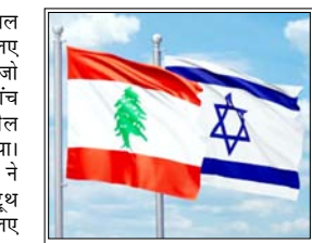
लेबनान के लिए यह एक ऐतिहासिक दिन हो सकता है: ट्रम्प

तेल अवीव/बेरुता। इजरायल और लेबनान 10 दिनों के लिए संघर्षविराम पर सहमत हो गए हैं, जो पूर्वी समय अनुसार 16 अप्रैल शाम पांच बजे (भारतीय समयानुसार 17 अप्रैल तड़के 3:30 बजे) से प्रभावी हो गया। अमेरिकी राष्ट्रपति डोनाल्ड ट्रम्प ने अपने सोशल मीडिया प्लेटफॉर्म ट्विटर पर कहा कि लेबनान के लिए यह एक ऐतिहासिक दिन हो सकता है। अच्छी चीजें हो रही हैं। ट्रम्प ने फिर से दावा किया कि उन्होंने दुनिया भर में नौ युद्धों को सुलझाया है और यह दसवां होगा। उन्होंने कहा कि तो चलिए इसे पूरा करते हैं। इस अस्थायी युद्धविराम का उद्देश्य स्थायी शांति समझौते की दिशा में बातचीत के लिए अवसर प्रदान करना है। यह समझौता ट्रम्प द्वारा इजरायली प्रधानमंत्री बेंजामिन नेतन्याहू और