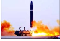
यह इलाका पहले भी मिसाइल परीक्षणों के लिए जाना जाता रहा है

सियोल। एशिया में एक बार फिर तनाव की लहर तेज हो गई है। रविवार को दक्षिण कोरिया ने दावा किया कि उत्तर कोरिया ने अपनी पूर्वी समुद्री सीमा की ओर कई बैलिस्टिक मिसाइलें दागी हैं। यह कदम ऐसे समय पर उठाया गया है, जब क्षेत्र पहले से ही सुरक्षा चुनौतियों और शक्ति संतुलन के दबाव से जूझ रहा है।