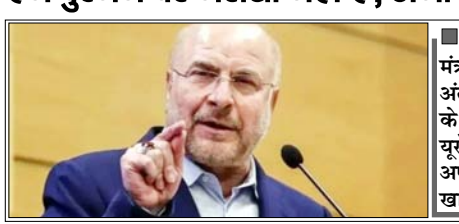
ईरानी विदेश मंत्रालय ने अंतरराष्ट्रीय कानून के अनुपालन की यूरोपीय संघ की अपील को किया खारिज

मास्को। ईरानी संसद अध्यक्ष मोहम्मद बोरगे गालिबफ ने कहा कि मध्य पूर्व में संघर्ष को समाधान के लिए वाशिंगटन और तेहरान के बीच जारी बातचीत के बावजूद, ईरान के सशस्त्र बल पूरी तरह से युद्ध के लिए तैयार हैं। प्रेस टीवी ने गालिबफ के हवाले से कहा कि हमें दुश्मन पर भरोसा नहीं है। अभी भी, जब हम यहां बैठे हैं, युद्ध छिड़ सकता है। सशस्त्र बल जमीन पर पूरी तरह से युद्ध के लिए तैयार है। प्रसारक के अनुसार, संसद अध्यक्ष ने इस बात से इन्कार किया कि जारी बातचीत से राष्ट्रीय सुरक्षा के प्रति लापरवाही हो सकती है। गालिबफ ने कहा कि हमारा मानना है कि बातचीत के कारण सशस्त्र बल तैयार नहीं हैं। इसके विपरीत, सड़कों पर आम लोगों की तरह, हमारे सशस्त्र बल भी तैयार हैं। इससे पहले, पाकिस्तानी प्रसारक कि जियो टीवी ने बताया कि अमेरिका-ईरान वार्ता का दूसरा दौर इस्लामाबाद में अगले सप्ताह के अंत में होने की संभावना है। 28 फरवरी को अमेरिका और इजरायल ने ईरान में टिकानों पर हमले शुरू किए, जिनमें 3,000 से अधिक लोग मारे गए। 8 अप्रैल को वाशिंगटन और तेहरान ने दो सप्ताह के लिए युद्धविराम की घोषणा की। इस्लामाबाद में हुई वाद की बातचीत बेततीजा रही। हालांकि