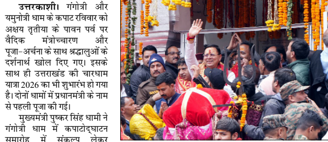
गंगोत्री धाम में कपाटोद्घाटन के अवसर पर मुख्यमंत्री ने की विशेष पूजा-अर्चना

प्रधानमंत्री मोदी के नाम से दोनों धामों में की गई पहली पूजा