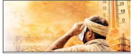
इस साल लोगों को झुलसाएगी गर्मी सम्पादकीय