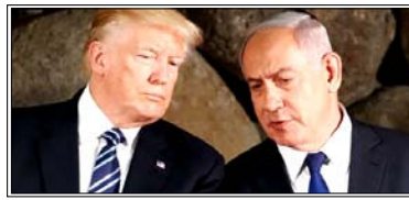
इजरायली प्रधानमंत्री बेंजामिन नेतन्याहू और उनके सलाहकारों में चिंता बढ़ गई और व्हाइट हाउस से स्पष्टीकरण मांगा गया

वाशिंगटन। पश्चिम एशिया में जारी ईरान संकट और इजरायल-लेबनान तनाव के बीच अमेरिका और इजरायल के रिश्तों में भी हलचल देखने को मिली है। अमेरिकी राष्ट्रपति डोनाल्ड ट्रम्प के ताजा बयानों ने कूटनीतिक स्तर पर नई बहस छेड़ दी है। यह बयान ऐसे समय में आया है जब संयुक्त राज्य अमेरिका-इजरायल और ईरान के बीच तनाव बढ़ रहा है।