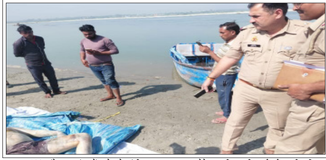
सम्भल- 120 घंटे तक गंगा में डूबे रहे मुंशी का शव बरामद होने पर पीएम की कार्रवाई करती पुलिस।

अज्ञात कार रौंदकर फरार शाह टाइम्स ब्यूरो सम्भला। आदमपुर गाँव मार्ग स्थित कमलपुर सराय के निकट अज्ञात वाहन बाइक सवार को रौंदकर फरार हो गया। घायल बाइक सवारों को आसपास मौजूद लोगों ने ने ई रिक्शा में लेकर निजि अस्पताल पहुंचाया। मामूली रूप से घायल उपचार कराकर घरों को रवाना हो गये।