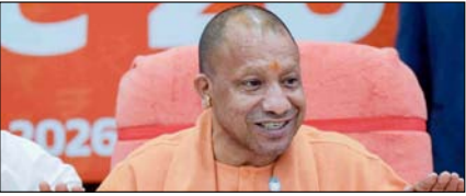
विपक्ष का आचरण लोकतांत्रिक मर्यादा के खिलाफ: योगी

नई दिल्ली, मुजफ्फरनगर, देहरादून, हल्द्वारी, मुरादाबाद, बरौली, मेरठ व लखनऊ से प्रकाशित