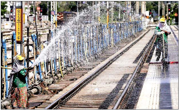
प्रयागराज। रेलवे स्टेशन पर भीषण गर्मी के बीच प्लेटफॉर्म पर पानी का छिड़काव करती रेलवे कर्मचारी।