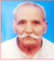
चालक सहित तीन अन्य घायल

शाह टाइम्स संवाददाता अफजलगढ़। हाईवे पर शिवपुरी के गैस गोदाम के समीप यात्रियों से भरा टैम्पू पलट गया। हादसे में 87 वर्षीय बुजुर्ग की मौत हो गई, जबकि चालक सहित तीन अन्य लोग घायल हो गए।