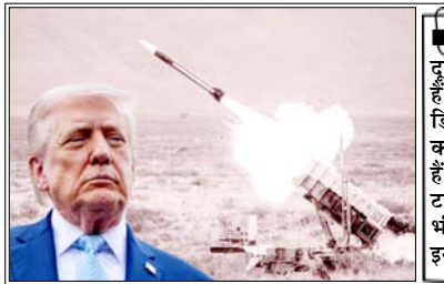
ये 600 मील से ज्यादा दूर तक मार कर सकती हैं और दुश्मन की एयर डिफेंस से बचकर हमला करने के लिए बनाई गई हैं, इसके अलावा टामहाक मिसाइलों का भी बड़े पैमाने पर इस्तेमाल हुआ

वाशिंगटन। ईरान के साथ 38 दिन चले युद्ध में अमेरिका ने अपनी कई अहम और महंगी मिसाइलें खर्च कर दीं। इनमें वो मिसाइलें भी शामिल हैं, जो चीन जैसे बड़े युद्ध के लिए सभालकर रखी गई थीं। अब अमेरिका का हथियार भंडार तेजी से कम हो रहा है। इस युद्ध में अमेरिका ने करीब 1100 लंबी दूरी की स्टीलथ मिसाइलें (जेएएसएसएम-ईआर) इस्तेमाल कीं। ये खास तौर पर चीन के खिलाफ इस्तेमाल के लिए बनाई गई थीं। इसके अलावा 1000 से ज्यादा टामहाक मिसाइलें, 1200 से ज्यादा पैट्रियट मिसाइलें और 1000 से ज्यादा दूसरी स्टाइक मिसाइलें भी दागी गईं। इस पूरे युद्ध पर 28 से 35 अरब डालर खर्च हुए।