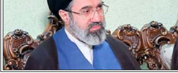
दुश्मन के मीडिया अभियान, ईरानी लोगों को भड़काने और राष्ट्रीय एकता को कमजोर करने की कोशिश कर रहे हैं: मोजतबा खामेनेई

सर्वोच्च नेता ने देशवासियों से चौकन्ना रहने की अपील की, ईरानी जनता की मजबूत एकता की तारीफ