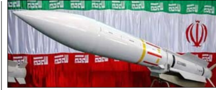
ईरान जंग में खर्च हुई चीन के लिए रिजर्व अमेरिकी मिसाइलें