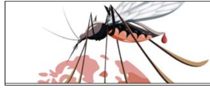
जानलेवा हो सकती है मलेरिया के इलाज में लापरवाही