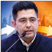
सात सांसदों ने राज्यसभा के सभापति को सौंपे दस्तावेज