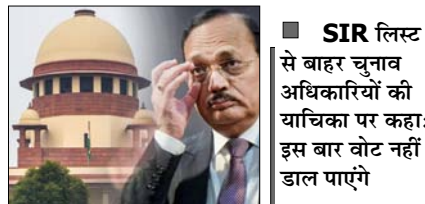
SIR लिस्ट से बाहर चुनाव अधिकारियों की याचिका पर कहा: इस बार वोट नहीं डाल पाएंगे

नई दिल्ली। सुप्रीम कोर्ट ने पश्चिम बंगाल विधानसभा चुनाव के पहले चरण में हुई रिकॉर्ड वोटिंग की तारीफ की। शुक्रवार को हुई सुनवाई के दौरान सीजेआई सुर्यकांत, जस्टिस जयमाल्या बागची और जस्टिस विपिन पंचोली की बेंच ने राज्य में चुनावी हिंसा न होने पर संतोष जताया। सीजेआई ने कहा कि भारत के नागरिक के रूप में, मुझे मतदान प्रतिशत देखकर बहुत खुशी हुई। जब लोग अपने मताधिकार का प्रयोग करते हैं, तो इससे लोकतांत्रिक व्यवस्था मजबूत होती है। सुप्रीम कोर्ट ने कहा कि जिनके नाम वोट लिस्ट से हटा दिए गए हैं, वे लोग समाधान के लिए कोर्ट की तरफ से नियुक्त 19 अपीलीय ट्रिब्यूनलों से संपर्क करें। कोर्ट बंगाल में एसआईआर को चुनौती देने वाली याचिकाओं की सुनवाई कर रहा था। सुप्रीम कोर्ट ने चुनाव से पहले इस प्रक्रिया को रोकने से इंकार कर दिया था। कोर्ट ने अपीलीय ट्रिब्यूनलों से कहा कि वे उन लोगों को पहले सुनवाई का मौका दें, जो वोट लिस्ट में नाम