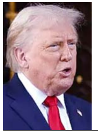
हेरिस की डेमोक्रेटिक पार्टी को पास 47 हैं। ट्रम्प की रिपब्लिकन पार्टी के ही लगभग 10 सांसद ईरान युद्ध के विरोध में आवाज उठा चुके हैं।

अमेरिकी राष्ट्रपति ट्रम्प के पास जंग जारी रखने के लिए 7 दिन हैं। अमेरिकी संविधान के अनुसार, किसी भी युद्ध को 60 दिन में संसद की मंजूरी लेनी पड़ती है। यहां भी ट्रम्प ने खेल किया। युद्ध 28 फरवरी को छेड़ा, संसद को 2 मार्च को सूचित किया। अब एक मई से पहले उन्हें संसद से युद्ध की मंजूरी लेनी है। रिपोर्ट्स के मुताबिक ट्रम्प संसद का सामना नहीं करना चाहते हैं। 100 सदस्यों वाली सीनेट में ट्रम्प के 53 सांसद हैं। जबकि विपक्षी कमला