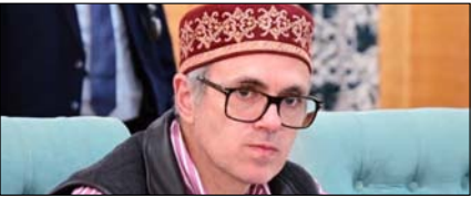
कश्मीर को राज्य का दर्जा न देना 'सजा' के समान : उमर अब्दुल्ला

नई दिल्ली, मुजफ्फरनगर, देहरादून, हल्द्वानी, मुरादाबाद, बरेली, मेरठ व लखनऊ से प्रकाशित