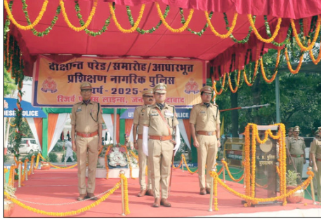
ताकि मुख्य आयोजन के दिन प्रदर्शन प्रभावशाली हो। गौरतलब है

पुलिस ने स्पष्ट किया है कि कार्यक्रम को सुरक्षित, अनुशासित और यादगार बनाने के लिए सभी आवश्यक तैयारियां पूरी की जा रही हैं। साथ ही आमजन और मीडिया से भी अपील की गई है कि वे कार्यक्रम के दौरान यातायात और सुरक्षा व्यवस्थाओं में सहयोग करें।