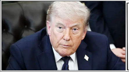
ट्रम्प ने फरवरी, 2025 में 'गोल्ड कार्ड' वीजा प्रोग्राम शुरू करने का ऐलान किया था, उस वक़्त उन्होंने इसकी कीमत पांच मिलियन डॉलर रखी थी अब अमेरिका सिर्फ टैलेंटड लोगों को ही वीजा देगा, न कि ऐसे लोगों को जो अमेरिकियों को नौकरियां छीन सकते हैं

अब तक सिर्फ एक व्यक्ति ने ही हासिल किया, 1300 आवेदन बेचे जाने का किया था सरकार ने दावा ब्रिटेन ने जंग में साथ नहीं दिया, ट्रम्प नाराज