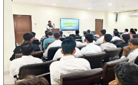
वक्तव्य में स्टार्ट-अप से संबंधित विधिक प्रक्रियाओं के बारे में अनुपालन, श्रम कानून और अनुबंध कानून जैसे विषयों पर विस्तार से