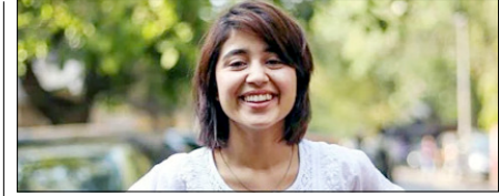
ऐसा लग रहा है जैसे एक साथ कई सपने जी रही हूँ: श्वेता बॉलीवुड