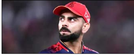
ऑरेंज कैप टेबल में शीर्ष पर पहुंचे कोहली खेल टाइम्स