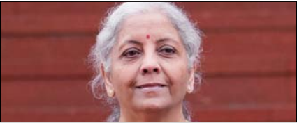
देश के शेयर बाजार का सफर लम्बा, उपलब्धियां विश्वस्तरीय : निर्मला सीतारमण पेज 2

नई दिल्ली, मुजफ्फरनगर, देहरादून, हल्द्वानी, मुरादाबाद, बरेली, मेरठ व लखनऊ से प्रकाशित