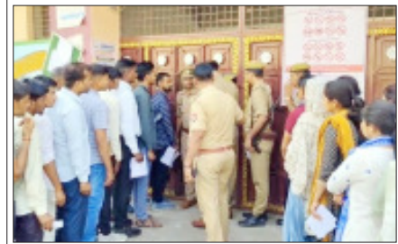
सम्भल- होमगार्ड परीक्षा देने परीक्षा केंद्र के बाहर खड़े अभ्यर्थी।

सम्भल। सम्भल जनपद में होमगार्ड परीक्षा को लेकर प्रशासन पूरी तरह अलर्ट मोड पर रहा। पहले दिन परीक्षा केंद्रों पर कड़ी निगरानी रही जबकि परीक्षाओं अंधे रे से ही परीक्षा केंद्रों पर पहुंचना शुरू हो गए। शनिवार को जनपद में बने होमगार्ड परीक्षा के लिए 10 परीक्षा केंद्र बनाये गए। जिन पर तीन तीन दिनों में छह शिफ्टों में 21,000 से अधिक परीक्षार्थी परीक्षा देंगे। शनिवार को पहले दिन परीक्षा केंद्रों पर करारी भीषण परीक्षा को शांतिपूर्ण और निष्पक्ष तरीके से संपन्न कराने के लिए प्रशासन की ओर से सख्त इंतजाम किए गए। जबकि हर केंद्र पर एक सेक्टर मजिस्ट्रेट और एक स्टेटिक मजिस्ट्रेट की तैनाती की