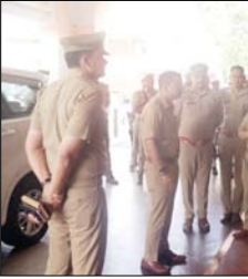
अभियान चलाया और सुरक्षा व्यवस्थाओं का जायजा लिया। निरीक्षण के दौरान एसएसपी ने स्टेशन परिसर में मौजूद भीड़-भाड़ की स्थिति, प्रवेश और निकास द्वारों पर तैनात पुलिस बल की सतर्कता तथा सौंदर्य व्यवस्थाओं की चेकिंग प्रक्रिया को बारीकी से परखा। उन्होंने अधिकारियों को निर्देश दिए कि परीक्षा के महंजर बाहरी जिलों से

बड़ी संख्या में आ रहे अभ्यर्थियों को ध्यान में रखते हुए सुरक्षा के किसी प्रकार की ढील न बतौती जाए। एसएसपी ने रेलवे स्टेशन पर तैनात पुलिसकर्मियों को सतर्क रहते हुए लगातार गश्त करने, सौंदर्य गति विधियों पर पैनी नजर रखने और यात्रियों की सुरक्षा सुनिश्चित करने के निर्देश दिए। साथ ही, उन्होंने भीड़ प्रबंधन को प्रभावी बनाने के लिए आवश्यक कदम उठाने को कहा, ताकि किसी प्रकार की अव्यवस्था उत्पन्न न हो। इस दौरान यात्रियों और