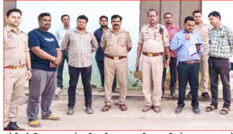
चोरी के खिलाफ छापेमारी की। टीम ने 10 घरों में बिजली चोरी

शाह टाइम्स संवाददाता नांगल सोती। विद्युत निगम व बिजिलेंस की संयुक्त टीम ने आज की सुबह नांगल सोती क्षेत्र में चैकिंग अभियान चलाया। टीम ने 10 घरों में बिजली चोरी पकड़ी। जिनके खिलाफ रिपोर्ट दर्ज कराई गई है।