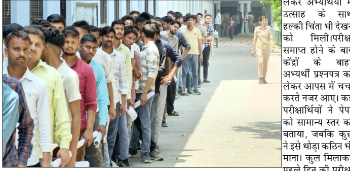
देनी है। एक पाली में करीब साढ़े 12 हजार परीक्षार्थी शामिल हो रहे हैं। परीक्षा केंद्रों की क्षमता के

ताकि परीक्षा पूरी तरह निष्पक्ष और पारदर्शी तरीके से संपन्न हो सके। जिले में तीन दिनों में कुल 74,592 अभ्यर्थियों को परीक्षा अनुसार 19 केंद्रों पर 400-400, 8 केंद्रों पर 384-384 और एक केंद्र पर 240 अभ्यर्थियों की व्यवस्था की गई है। मेरठ, पीलीभीत, रामपुर, संभल और शाहजहांपुर सहित कुल 11 जिलों के अभ्यर्थियों को केंद्र आवंटित किए गए हैं। परीक्षा को लेकर अभ्यर्थियों में उत्साह के साथ हल्की चिंता भी देखने को मिली। परीक्षा समाप्त होने के बाद केंद्रों के बाहर अभ्यर्थी प्रश्नपत्र को लेकर आपस में चर्चा करते नजर आए। कई परीक्षार्थियों ने पेपर को सामान्य स्तर का बताया, जबकि कुछ ने इसे थोड़ा कठिन भी माना। कुल मिलाकर पहले दिन की परीक्षा सतर्क तरीके से संपन्न हुई, जिससे प्रशासन ने राहत को सांस ली है।