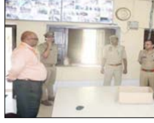
व्यवस्थाओं का जायजा लिया। निरीक्षण के दौरान एसएसपी ने केंद्रों पर तैनात पुलिस अधिकारियों एवं कर्मचारियों को आवश्यक दिशा-निर्देश देते हुए कहा कि परीक्षा प्रक्रिया में किसी भी प्रकार की लापरवाही न बरती जाए। उन्होंने स्पष्ट रूप से निर्देशित किया कि सभी अभ्यर्थियों की सघन चेकिंग सुनिश्चित की जाए और केंद्रों