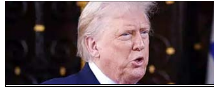
प्रेसिडेंट ट्रम्प का गोल्ड कार्ड वीजा हुआ फ्लॉप पेज 11