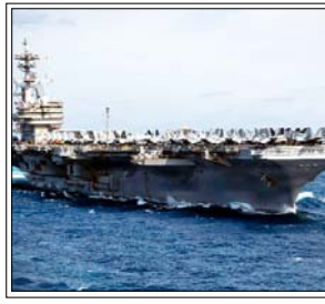
अमेरिकी अधिकारियों ने इस कार्रवाई को व्यापक समुद्री अभियान का हिस्सा बताया

फ्लोरिडा (अमेरिका)। अमेरिकी सेंट्रल कमांड (सेंटकॉम) ने पुष्टि की है कि अमेरिकी नौसेना के गाइडेड-मिसाइल डिस्ट्रिक्ट यूएसएस राफेल पेराल्टा (डीडीजी 115) ने एक ईरानी झंडे वाले जहाज को समुद्र में रोक दिया है। यह कार्रवाई एक विशेष समुद्री मिशन के तहत की गई, जिससे अंतर्राष्ट्रीय स्तर पर तनाव एक बार फिर बढ़ गया है। अमेरिकी नौसेना के अनुसार, 24 अप्रैल को इस जहाज की गतिविधियों पर नजर रखी जा रही थी। रिपोर्ट में दावा किया गया कि यह जहाज ईरान के बंदरगाह की ओर जा रहा था, जिसके बाद उसे रोकने का निर्णय लिया गया। इसके बाद अमेरिकी युद्धपोत ने तुरंत कार्रवाई करते हुए जहाज को रोका और बॉयडिंग के जरिए उसकी जांच शुरू की। अमेरिकी अधिकारियों ने इस कार्रवाई को व्यापक समुद्री अभियान का हिस्सा बताया है। शुक्रवार को पेंटागन में हुई ब्रीफिंग के दौरान जाइंट चीफ्स ऑफ स्टॉफ के चेयरमैन जनरल डैन केन ने कहा कि अमेरिका ईरान के खिलाफ सख्त समुद्री नाकाबंदी नीति लागू कर रहा है। उन्होंने कहा कि अमेरिकी सेना किसी भी स्थिति में