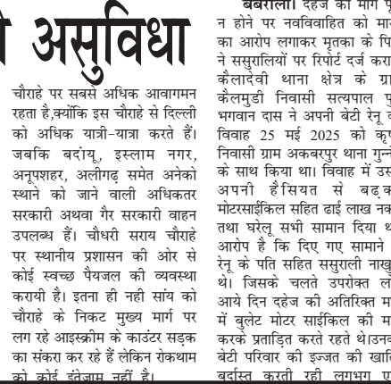
चौराहों पर होती है यात्रियों को असुविधा

0चौराहों पर होती है यात्रियों को असुविधा