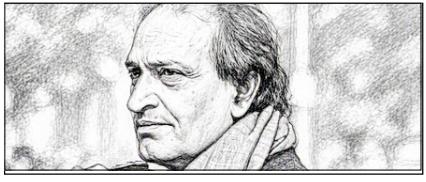
मानवीय संवेदना का इतिहासकार फोटोग्राफर रघु राय