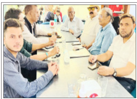
सम्भल- कैमिस्ट एसोसिएशन की बैठक में विचार-विमर्श करते।

0भब्य कार्यक्रम की हुई सराहना, आय व्यय का वितरण प्रस्तुत