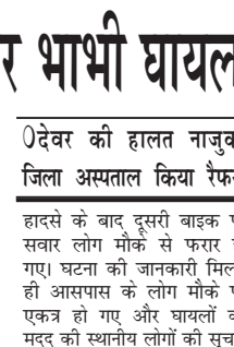
देवर की हालत नाजुक जिला अस्पताल किया रैफर

0देवर की हालत नाजुक जिला अस्पताल किया रैफर