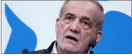
दबाव में युद्धविराम पर वार्ता नहीं करेगा तेहरान: पेंजेशिकयन