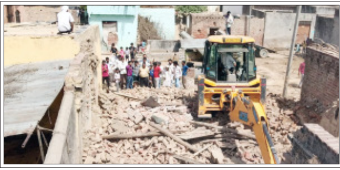
सम्भल। ग्राम सौधन मोहम्मदपुर में किले के आसपास अतिक्रमण कर बनाये गए मकानों को बहाता बुल्डोजर।