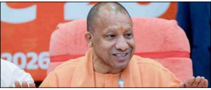
अनुशासन व टीमवर्क का उत्कृष्ट भाव सबसे बड़ी ताकत: योगी

नई दिल्ली, मुजफ्फरनगर, देहरादून, हल्द्वानी, मुरादाबाद, बरेली, मेरठ व लखनऊ से प्रकाशित