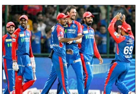
नाबाद पारी खेलने वाले-जो आईपीएल के इतिहास में किसी भी भारतीय खिलाड़ी का अब तक का सबसे बड़ा व्यक्तिगत स्कोर है, राहुल दिल्ली की बल्लेबाजी की रीढ़ बनकर उभरे हैं। उन्होंने इस सीजन में कई मैचों में अकेले दम पर टीम को जीत दिलाई है। सात पारियों में 357 रन और एक बेहतरीन स्ट्राइक रेट के साथ, क्राइज पर उनका दबदबा बेजोड़ रहा है। फिर भी, दिल्ली के अभियान की विडंबना यह है कि राहुल के शानदार प्रदर्शन के बावजूद टीम को लगातार जीत नहीं मिल पाई है। पंजाब किंग्स के हाथों मिली करारी हार-जिसमें दिल्ली 264 रनों के विशाल स्कोर का बचाव करने में

आरसीबी के खिलाफ मुकाबला आज अरुण जेटली स्टेडियम में नई दिल्ली, वार्ता। रिकॉर्ड स्कोर बनाने के बावजूद दिल्ली कैपिटल्स को पंजाब किंग्स के खिलाफ कल हार का सामना करना पड़ा और अब सोमवार को मौजूदा चैंपियन रॉयल चैलेंजर्स बेंगलुरु के खिलाफ यहां अरुण जेटली स्टेडियम में इंडियन प्रीमियर लीग 2026 सीजन के 39वें मैच में उसे अपनी फील्डिंग, खास तौर पर कैचिंग में सुधार करना होगा तभी वह जीत की उम्मीद कर पाएगा। इस मुकाबले में सभी की निगाहें पूरी तरह से कएल राहुल पर टिकी हैं, जिनकी रिकॉर्ड तोड़ फॉर्म इस टूर्नामेंट की सबसे बड़ी चर्चा का विषय रही है। पंजाब के खिलाफ 152 रनों की शानदार