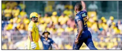
चेन्नई सुपर किंग्स को हराकर गुजरात टाइटंस ने चौथी जीत दर्ज की