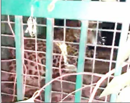
पिंजरे में फंस गया जिससे ग्रामीणों ने थोड़ी राहत महसूस की मगर मिश्रीपुर गांव में पिंजरा खाली होने के कारण अभी दहशत का माहौल है।

काठ (शाह टाइम्स) महदूद कलमी गांव में देर रात तेंदुआ पिंजरे में फंस गया जिससे लोगों ने राहत महसूस की है लेकिन मिश्रीपुर गांव में लगा पिंजरा अभी खाली है।