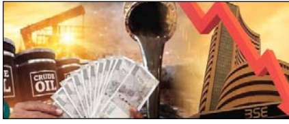
सुधार या बोझ? आम आदमी की जेब पर लगातार पड़ता भार