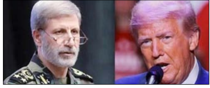
अमेरिका ने जमीनी हमला किया, तो कोई जिंदा नहीं बचेगा: ईरान