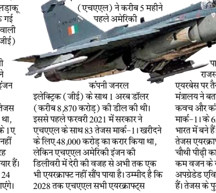
9000 करोड़ की 113 इंजनों की डील पर कंपनी आगे बढ़ पाएगी। हिंदुस्तान एयरोनॉटिक्स लिमिटेड (एचएएल) ने करीब 5 महीने पहले अमेरिकी कंपनी जनरल इलेक्ट्रिक (जीई) के साथ 1 अरब डॉलर (करीब 8,870 करोड़) की डील की थी। इससे पहले फरवरी 2021 में सरकार ने एचएएल के साथ 83 तेजस मार्क-11 खरीदने के लिए 48,000 करोड़ का करार किया था, लेकिन एचएएल अमेरिकी इंजन की डिलीवरी में देरी की वजह से अभी तक एक भी एयरक्राफ्ट नहीं सौंप पाया है। उम्मीद है कि 2028 तक एचएएल सभी एयरक्राफ्ट वायुसेना को सौंप देगा। इसके लिए एचएएल को जीई की ओर से अभी तक 4 इंजन भी मिल चुके हैं। एलसीए तेजस मार्क-11 लड़ाकू विमान को पाकिस्तान बॉर्डर के पास राजस्थान के बीकानेर स्थित नाल एयरबेस पर तैनात करने की योजना है। रक्षा मंत्रालय ने बताया था कि इस जेट में स्वयं रक्षा कवच और कंट्रोल एक्जक्यूटिव होंगे। तेजस मार्क-11 के 65 फीसदी से ज्यादा उपकरण भारत में बने हैं। मार्क-11, सिंगल इंजन वाले तेजस एयरक्राफ्ट का एडवॉंस वर्जन है। यह चौथी पीढ़ी का हल्का लड़ाकू विमान है, जो कम वजन के बावजूद बेहद फुटीला है। इसमें प्रोपेल्ड एक्टिवेटिक्स और रडार सिस्टम लगे हैं। तेजस के पुराने वर्जन को भी एचएएल ने

नई दिल्ली। मिडिल-ईस्ट में चल रहे युद्ध के कारण भारत के बहुप्रतीक्षित लड़ाकू विमान तेजस के इंजन की सप्लाई रुक गई है। इन विमानों के इंजन सप्लाई करने वाली अमेरिकी कंपनी जनरल इलेक्ट्रिक (जीई) ने हिंदुस्तान एयरोनॉटिक्स लिमिटेड (एचएएल) को कह दिया है कि अभी सप्लाई नहीं दे पाएंगे। भारोसेमंद सूत्रों ने बताया कि अब साल के अंत तक ही इंजन मिलने की उम्मीद है। एचएएल ने मार्च 2026 तक 24 तेजस विमान वायुसेना को देने का वादा किया था, लेकिन, एचएएल में खड़े 9 तेजस एमके 1ए विमान इंजन के अभाव में वायुसेना को नहीं मिल पा रहे हैं। जबकि 5 विमान पूरी तरह तैयार हैं। 19 विमानों के एयर फ्रंट भी तैयार हैं। यदि आपूर्ति बहाल होती है तो इस साल 24 और अगले साल तक 30 इंजन मिल जाएंगे।