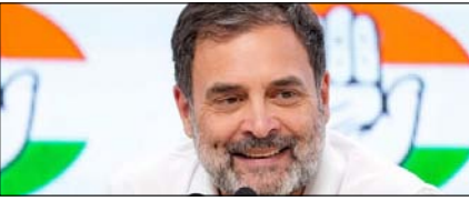
सैनिकों को मिले सम्मान जिसके हैं वे हकदार: राहुल गांधी

नई दिल्ली, मुजफ्फरनगर, देहरादून, हल्द्वानी, मुरादाबाद, बरेली, मेरठ व लखनऊ से प्रकाशित