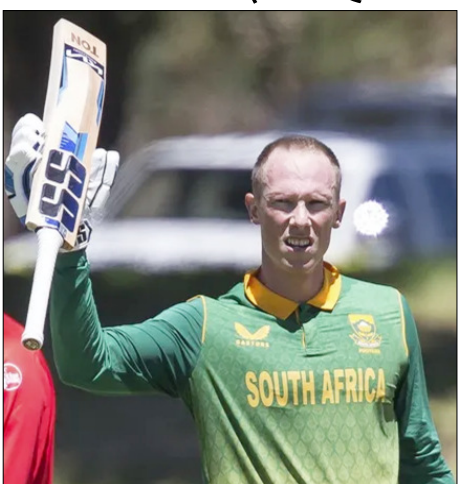
जहां उन्होंने न्यूजीलैंड के खिलाफ एक शानदार शतक (133 रन) बनाया था।

केप टाउन, वार्ता। दक्षिण अफ्रीका के बल्लेबाज रासी वैन डेर डुसेन ने सभी फॉर्मेट में खेलने के बाद अंतर्राष्ट्रीय क्रिकेट से संन्यास ले लिया है। इस दाएं हाथ के बल्लेबाज ने दो अप्रैल को अपने इस फैसले की पुष्टि की। उन्होंने अपने सोशल मीडिया पर एक दिल को छू लेने वाला संदेश साझा करते हुए अंतर्राष्ट्रीय क्रिकेट में अपनी यात्रा को याद किया। वैन डेर डुसेन ने नौ अक्टूबर, 2018 को जिम्बाब्वे के खिलाफ एक टी-20 मैच में अपना डेब्यू किया था और इसके बाद उन्होंने दक्षिण अफ्रीका के लिए तीनों फॉर्मेट में खेला। उन्होंने अपने करियर में 57 टी-20, 71 एकदिवसीय और 18 टेस्ट मैच खेले। उन्होंने आखिरी बार अंतर्राष्ट्रीय मैच 16 अगस्त, 2025 को ऑस्ट्रेलिया के खिलाफ टी-20 खेला था। उनके बेहतरीन