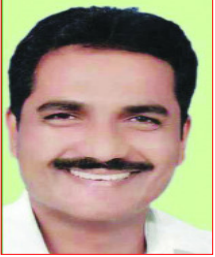
जुलूम बर्दाश्त नहीं करेगी आसपा