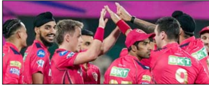
पंजाब किंग्स का हरफनमौला संतुलन रंग लाएगा