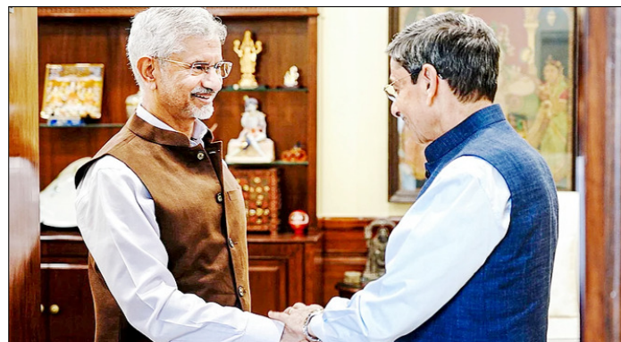
कोलकाता। पश्चिम बंगाल के राज्यपाल आरएन एच के साथ हाथ मिलाते विदेश मंत्री एस जयशंकर।

अड्डे के इस्तेमाल की अनुमति अमेरिकी बमवर्षक विमानों को देने से इन्कार कर दिया था। यूरोपीय देशों के इन्कार से अमेरिकी राष्ट्रपति डोनाल्ड ट्रम्प भी काफी खफा हैं। वो टुध के अलावा विभिन्न प्लेटफॉर्म पर खुलकर विरोध जता चुके हैं। कई मीडिया साक्षात्कार में खुले तौर पर नाटो और यूरोपीय देशों के खिलाफ राय जाहिर कर चुके हैं। लगभग हर दूसरे दिन वो टुध पर मदद न करने का तंज कसते हुए कह देते हैं कि अमेरिका याद रखेगा। जिस होर्मुज स्ट्रेट पर कब्जे का वो दावा करते थे अब उसे लेकर भी उन्होंने रुचि नहीं दिखाई है। राष्ट्र के नाम अपने संबोधन में कहा कि अब उसकी जिम्मेदारी वो उठाएँ, जिन्हें वहाँ से अपना सामान ले जाना है। हाल ही में डेली टेलीग्राफ को दिए एक साक्षात्कार में ट्रम्प ने ईरान-इजरायल संघर्ष के दौरान नाटो सहयोगियों, खासकर ब्रिटेन और फ्रांस की ओर से सैन्य मदद न देने पर नाराजी जताई। ट्रम्प ने नाटो को कागजी शेर करार दिया और अमेरिका के गठबंधन से बाहर निकलने की धमकी दी।