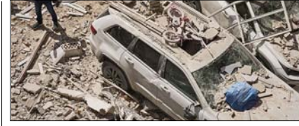
ईरान समर्थित समूहों का अमेरिकी ठिकानों पर झोन हमला पेज 12