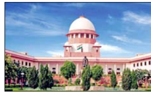
सुप्रीम कोर्ट में सबरीमाला मंदिर में महिलाओं के प्रवेश से जुड़े 2018 के फैसले की समीक्षा याचिकाओं पर अंतिम सुनवाई शुरू

मुख्य न्यायाधीश सूर्यकांत की अध्यक्षता में नौ न्यायाधीशों की पीठ इस मामले को सुनवाई कर रही है। पीठ में न्यायमूर्ति बीबी नारगला, एमएम सुंदर, अहसानुद्दीन अमानुल्लाह, अरविंद