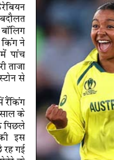
हासिल की और 3-0 से सीरीज अपने नाम कर ली। आईसीसी के अनुसार, उनके इस प्रदर्शन की बदौलत वह ऑलराउंडर रैंकिंग (281) में

दुबई, वार्ता। ऑस्ट्रेलिया के कैरेबियन दौरे के दौरान शानदार प्रदर्शन की बदौलत अलाना किंग आईसीसी महिला वनडे बॉलिंग रैंकिंग में फिर से टॉप पर पहुंच गई हैं। किंग ने सेंट क्विंटस में अपने आखिरी मैच में पांच विकेट लिए, जिससे मंगलवार को जारी ताजा रैंकिंग में वह इंग्लैंड की सोफी एक्लेस्टोन से आगे निकल गईं। इस लेग-स्पिनर (753) ने मार्च में रैंकिंग में टॉप पर एक्लेस्टोन के लगभग चार साल के दबदबे को खत्म कर दिया था, हालांकि पिछले हफ्ते की रैंकिंग में वह इंग्लैंड की इस लेफ्ट-आर्म ऑर्थोडॉक्स स्पिनर से पीछे रह गई थीं। 30 साल की इस खिलाड़ी ने बासेटरे के वानर पार्क में 5/19 (10) के शानदार आंकड़े के साथ मैच खत्म किया। उन्होंने 44 डॉट गेंदें फेंकीं, जिससे ऑस्ट्रेलिया ने नौ विकेट से जीत हासिल की और 3-0 से सीरीज अपने नाम कर ली। आईसीसी के अनुसार, उनके इस प्रदर्शन की बदौलत वह ऑलराउंडर रैंकिंग (281) में एक स्थान ऊपर चढ़कर सातवें स्थान पर पहुंच गईं और इंग्लैंड की नेट साइबर-बंट (280) को पीछे छोड़ दिया। वहीं दूसरी ओर, न्यूजीलैंड की बल्लेबाजों ने भी शानदार प्रदर्शन किया, क्योंकि दक्षिण अफ्रीका के खिलाफ घरेलू वनडे सीरीज में उनके बल्ले से खूब रन निकले। मैडी ग्रीन अपने करियर की सर्वश्रेष्ठ रेटिंग 642 पर पहुंच गईं और चार स्थान ऊपर चढ़कर नौवें स्थान पर आ गईं। एमी केर, जिन्होंने बेसिन रिजर्व में 139 गेंदों पर 179 रन बनाकर इतिहास का सबसे बड़ा महिला व्प-चनक पूरा किया और दुनिया का ध्यान अपनी ओर खींचा, वह छह स्थान ऊपर चढ़कर सच्युक्त रूप से 14वें स्थान पर पहुंच गईं। एमी अपने शानदार प्रदर्शन की बदौलत वनडे ऑलराउंडर रैंकिंग में चौथे स्थान पर मौजूद मारिजेन कैंप से भी आगे निकल गईं।