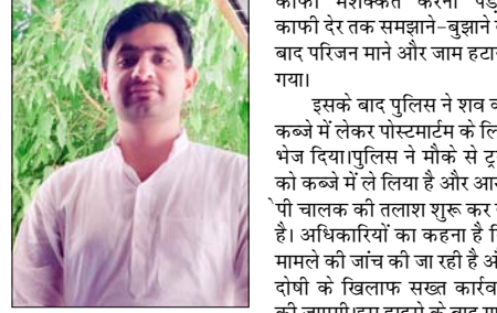
गुस्साए परिजनों ने सड़क पर जाम लगा दिया। परिजनों का आरोप था

नीचे आ गया और मौक के पर ही उसकी मौत हो गई। हादसे के बाद मौक पर लोगों की भारी भीड़ जमा हो गई। घटना की सूचना मिलते ही मृतक के परिजन भी मौक के पर पहुंच गए और युवक की मौत से कि ट्रक चालक को लापरवाही के कारण यह हादसा हुआ है। जाम के चलते सड़क पर वाहनों की लंबी कतारें लग गईं और यातायात लंबी तरह बाधित हो गया। मौक के पर पहुंची पुलिस को जाम खुलवाने में काफी मशकत करनी पड़ी। काफी देर तक समझाने-बुझाने के बाद परिजन माने और जाम हटया गया।