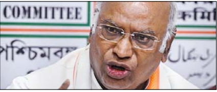
अड़गे का हिमंत पर हमला, लगाए क्षप्टाचार के आरोप पेज 2

नई दिल्ली, मुजफ्फरनगर, देहरादून, हल्द्वानी, मुरादाबाद, बरेली, मेरठ व लखनऊ से प्रकाशित