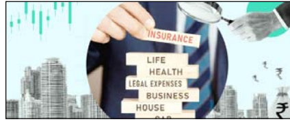
क्यों कम हुई हेल्थ इंश्योरेंस कंपनियों की विश्वसनीयता सम्पादकीय