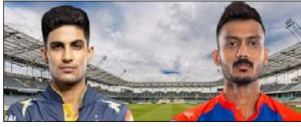
गुजरात को जीत की तलाश, दिल्ली की नजरें जीत की हैट्टिक पर खेल टाइम्स