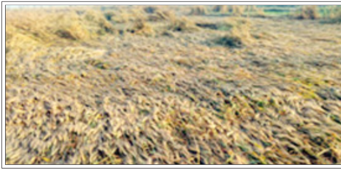
सम्भल- बैमौसम बारिश व तेज हवाओं से खेत में बिछी पड़ी गेहूँ की फसल।