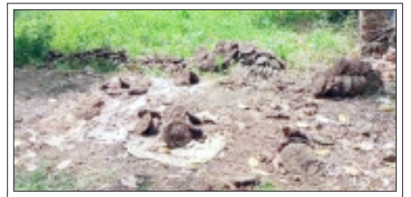
सम्भल- लेखपाल का पोर्टल पर कब्जा मुक्त कार्यायें गई सरकारी भूमि का सवा।