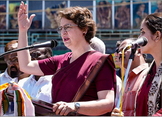
केरल विधानसभा चुनाव से पहले, वायनाड जिले के पदिनजरथारा में कांग्रेस महासचिव और वायनाड सांसद प्रियंका गांधी ने एक नुककड़ सभा को संबोधित किया।