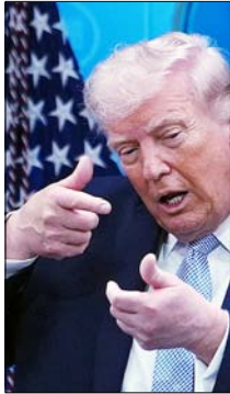
खर्ग द्वीप-पुल को बनाया निशाना, एक साथ 50 ठिकाने तबाह IRGC ने अमेरिका को लक्ष्मण रेखा पार न करने की चेतावनी दी

तबरीज-जंजान हाईवे के पुल पर भी हमला किया गया। इससे पहले अमेरिकी राष्ट्रपति डोनाल्ड ट्रम्प ने चेतावनी दी थी कि अगर ईरान ने मंगलवार को रात 8 बजे (अमेरिका समयानुसार) तक हार्मुज स्ट्रेट नहीं