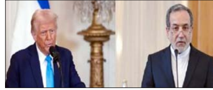
अमेरिका का ईरानी शांति योजना स्वीकार करना युद्ध में जीत: ईरानी सुरक्षा परिषद पेज 12