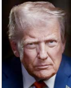
चल रहा है। उन्होंने आशा व्यक्त किया कि सब कुछ ठीक चलेगा। ट्रम्प ने कहा कि यह अमेरिका की तरह पश्चिम एशिया का स्वर्ण युग हो सकता है।

वाशिंगटन। अमेरिकी राष्ट्रपति डोनाल्ड ट्रम्प ने ईरान के साथ दो सप्ताह के युद्धविराम को विश्व शांति के लिए एक बड़ा दिन बताया और कहा कि अमेरिका होर्मुज स्ट्रेट में यातायात व्यवस्था को सुचारू बनाने में मदद करेगा। उन्होंने कहा कि ईरान ऐसा चाहता है, क्योंकि वे तंग आ चुके हैं। इसी तरह बाकी सभी भी तंग आ चुके हैं। उन्होंने कहा कि अमेरिका होर्मुज स्ट्रेट में यातायात बढ़ाने में मदद करेगा और कई सकारात्मक कदम उठाए जाएंगे। उन्होंने कहा कि खूब पैसा बनाया जाएगा और ईरान पुनर्निर्माण प्रक्रिया शुरू कर सकता है। ट्रम्प ने कहा कि हम हर तरह की आपूर्ति लेकर आएं और यहाँ आसपास मंडराते रहेंगे, ताकि यह सुनिश्चित हो सके कि सब कुछ ठीक चल रहा है। उन्होंने आशा व्यक्त किया कि सब कुछ ठीक चलेगा। ट्रम्प ने कहा कि यह अमेरिका की तरह पश्चिम एशिया का स्वर्ण युग हो सकता है।