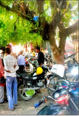
पर बने आजाद मल्टीस्पेशलिटी हॉस्पिटल में भर्ती कराया गया था। परिजनों के अनुसार, क्रांति का