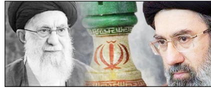
सीजफायर नहीं, कूटनीति की जीत का ऐलान सम्पादकीय