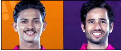
ऑरेंज कैप और पर्पल कैप पर आरआर के खिलाड़ियों का कब्जा खेल टाइम्स