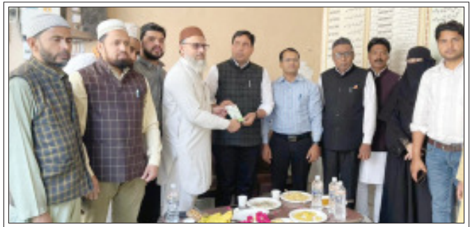
सम्भला मद्रसा अजमल उल्लूम में हज कमेटी के सदस्य का स्वागत सम्मान करते।