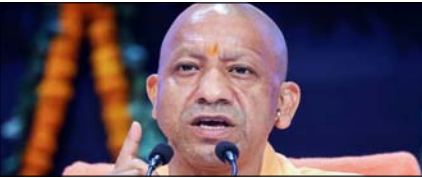
किसानों को त्वरित राहत के निर्देश, क्षतिपूर्ति में नहीं होगी देरी: योगी

नई दिल्ली, मुजफ्फरनगर, देहरादून, हल्द्वानी, मुरादाबाद, बरेली, मेरठ व लखनऊ से प्रकाशित