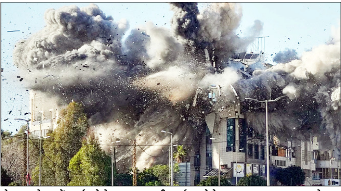
लेबनान। बेरूत में हवाई अड्डे के पास इजरायली हवाई हमले के बाद सड़क पर एक इमारत से धुआं उठता दिखाई दिया।