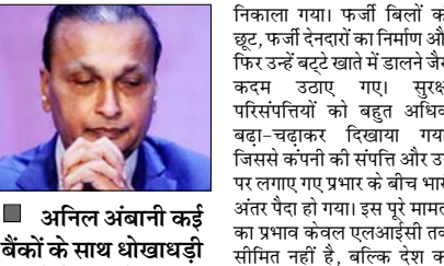
अनिल अंबानी कई बैंकों के साथ धोखाधड़ी मामले में कर रहे कानूनी कार्रवाई का सामना

नई दिल्ली। केंद्रीय जांच ब्यूरो यानी सीबीआई ने बुधवार को रिलायंस कम्युनिकेशंस लिमिटेड, इसके प्रमोटर अनिल अंबानी और कुछ अज्ञात सरकारी कर्मचारियों के खिलाफ एक नया मामला दर्ज किया है। यह मामला भारतीय जीवन बीमा निगम को कथित तौर पर 3,750 करोड़ रुपये का गलत तरीके से नुकसान पहुंचाने से जुड़ा है।