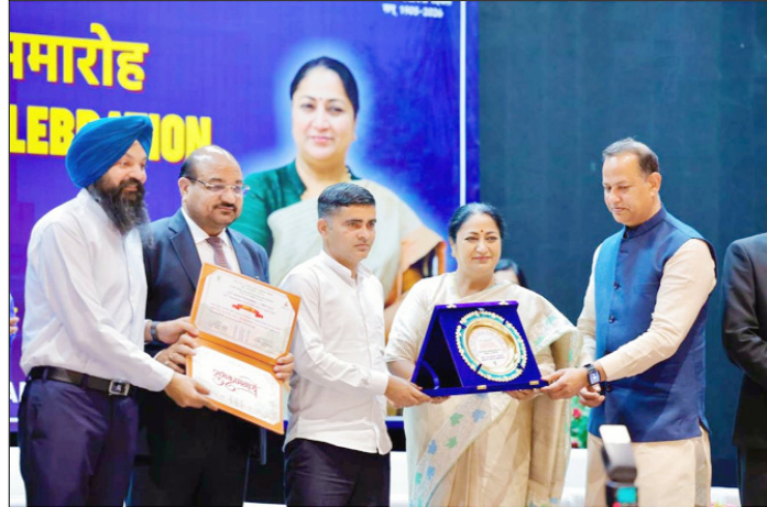
मुख्यमंत्री रेखा गुप्ता भारतीय कृषि अनुसंधान संस्थान में आयोजित 122वें स्थापना दिवस समारोह में मुख्य अतिथि के रूप में भाग लेते हुए।

के प्रतिनिधियों ने हिस्सा लिया। यह प्रधानमंत्री नरेंद्र मोदी जी के 'एक पेड़ मां के नाम' अभियान से प्रेरित है।" उन्होंने आगे कहा कि, "कई वर्षों तक दिल्ली की हवा खराब रही क्योंकि पिछली सरकारों ने सिर्फ वादें किए। अब मुख्यमंत्री रेखा गुप्ता के नेतृत्व में हमारी प्राथमिकता साफ है, बेहतर हवा और मजबूत ग्रीन इंडस्ट्रियल पार्क को नियंत्रित करने तक सीमित नहीं है, बल्कि दिल्ली की हरियाली को तेजी से बढ़ाने के लिए काम कर रही है। पिछले साल हमने बड़े स्तर पर पौधारोपण किया, जिसमें छात्र, महिला समूह, आम नागरिक, अधिकारी, जनप्रतिनिधि, माननीय न्यायाधीश, गणमान्य लोग और 70 से अधिक देशों