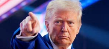
ईरान में चल रहा अमेरिकी सैन्य ऑपरेशन बहुत जल्द खत्म कर दिया जाएगा, एक माह से जारी जंग के बीच आया ट्रम्प का बयान

वाशिंगटन। पश्चिम एशिया में जारी संघर्ष दिन-ब-दिन और भयावह होता जा रहा है। अमेरिका और इजरायल के भीषण हमलों से दहक रहे मोर्चे पर ईरान भी इजरायल और खाड़ी देशों में मैजुद अमेरिकी सैन्य ठिकानों पर जोरदार पलटवार कर रहा है। मिसाइलों और ड्रोन की गरज के बीच यह संघर्ष अब अपने 33वें दिन में प्रवेश कर चुका है और पूरे क्षेत्र में तनाव अब भी चरम पर है। इसी उग्र हालात के बीच अब अमेरिका के राष्ट्रपति डोनाल्ड ट्रम्प का बड़ा बयान सामने आया है। उन्होंने कहा कि ईरान में चल रहा अमेरिकी सैन्य ऑपरेशन बहुत जल्द खत्म कर दिया जाएगा। अपने बयान में ट्रम्प ने आगे कहा कि अगले दो से तीन हफ्तों के अंदर