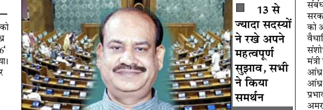
आंध्र प्रदेश विधानसभा ने जो प्रस्ताव केंद्र को भेजा था उस प्रस्ताव में अमरावती को राज्य की राजधानी बनाने के लिए नामित कर अमरावती को राज्य की राजधानी बनाने का प्रावधान किया गया है। उन्होंने कहा कि आंध्र प्रदेश सरकार ने 2015 में इसके लिए अधिसूचना जारी करते हुए कहा था कि अमरावती राज्य की राजधानी होगी। इस

शाह टाइम्स ब्यूरो नई दिल्ली। लोकसभा ने अमरावती को आंध्र प्रदेश की राजधानी बनाने वाले 'आंध्र प्रदेश पुनर्गठन (संशोधन) विधेयक 2026' को बुधवार को ध्वनिमत से पारित कर दिया। गृहराज्य मंत्री नित्यानंद राय ने इस पर हुई चर्चा का जवाब देते हुए कहा कि विधेयक पर करीब दो घंटे चर्चा चली जिसमें 13 से ज्यादा सदस्यों ने अपने महत्वपूर्ण सुझाव इसमें रखे हैं और लगभग सभी सदस्यों ने इस विधेयक का समर्थन किया है। उन्होंने बताया कि अमरावती को आंध्र प्रदेश की राजधानी बनाने को लेकर