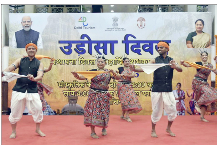
दिल्ली सचिवालय में ओडिशा दिवस के अवसर पर सांस्कृतिक कार्यक्रम में भाग लेते ओडिशा के कलाकार।

स्थापना दिवस का आयोजन हो रहा है ताकि देश की विविध सांस्कृतिक पहचान को प्रोत्साहन मिल सके। कपिल मिश्रा ने ओडिशा की समृद्ध संस्कृति, परंपरा और देश निर्माण में योगदान को नमन करते हुए कहा कि ओडिशा, अपनी प्राचीन सभ्यता, मंदिर वास्तुकला, हस्तशिल्प, शास्त्रीय नृत्य और लोक परंपराओं के लिए पूरे देश में विशेष पहचान रखता है। राज्य ने कला, साहित्य, आध्यात्मिकता और समुद्री व्यापार को माध्यम से भारत की सांस्कृतिक और आर्थिक समृद्धि में महत्वपूर्ण योगदान दिया है। दिल्ली के विकास में भी ओडिशा के लोगों का महत्वपूर्ण स्थान है।