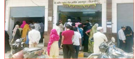
उपभोक्ता फोन से वितरक से पूछते हैं, तो वितरक कहते हैं कि आप लाइन में लगकर गैस ले लो। अभी होम डिलीवरी नहीं कराई जाएगी। जिससे उपभोक्ताओं में काफी गुस्सा देखने को मिल रहा है। उपभोक्ताओं ने बताया कि पहले की तरह होम डिलीवरी व्यवस्था नहीं होने से समस्या और बढ़ गई है। वहीं दूसरी तरफ हजारों उपभोक्ताओं ने बताया कि गैस बुक कर रहे हैं, तो कभी दो घंटे का कभी चार घंटे का, तो कभी छह घंटे का एसएमएस आ रहा है। एजेंसी के प्रतिनिधि कोई सही जानकारी उपलब्ध नहीं कर रहे। कभी कह रहे

शाह टाइम्स संवाददाता सहसपुर। नगर की आवागमन को रोकने गैस की किल्लत से भारी परेशानियों का सामना करना पड़ रहा है। गैस एजेंसी के बाहर सुबह सात बजे से ही लंबी कतारें लग रही हैं। इसके बावजूद लोगों को समय पर सिलेंडर नहीं मिल पा रहा है। उपभोक्ताओं का कहना है कि गैस प्राप्त करने के लिए कई औपचारिकताओं से गुजरना पड़ रहा है। जिससे प्रक्रिया जटिल हो गई है। उपभोक्ताओं का आरोप है कि गैस एजेंसी द्वारा उनके बुकिंग हुए सिलेंडर को डिलीवर कर दिया जाता है, जिसका मैसज उनके पास पहुंचता है, लेकिन सिलेंडर की डिलीवरी नहीं की जाती। यदि