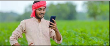
उप्र में फॉर्मर रजिस्ट्री से जुड़ेगा हर किसान पेज 2

नई दिल्ली, मुजफ्फरनगर, देहरादून, हल्द्वानी, मुगदाबाद, बरेली, मेरठ व लखनऊ से प्रकाशित