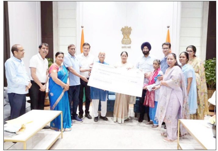
शाहीद कोरोना योद्धाओं के परिवारों को मुख्यमंत्री एक-एक करोड़ रुपये के चेक सौंपते हुए।

सह-पाठ्यक्रम गतिविधियों की अहम तिथियों का विवरण दिया गया है। ग्रीष्मकालीन अवकाश 11 मई से 30 जून तक रहेगा, जबकि शरदकालीन अवकाश 17 अक्टूबर से 19 अक्टूबर तक निर्धारित है। शीतकालीन अवकाश 1 जनवरी से 15 जनवरी, 2027 तक रहेगा। परीक्षा कार्यक्रम के अनुसार, कक्षा तीसरी से बारहवीं तक की मध्याह्न परीक्षाएं 15 सितंबर से 13 अक्टूबर के बीच आयोजित की जाएंगी, जबकि कक्षा तीसरी से नौवीं और ग्यारहवीं की वार्षिक परीक्षाएं 15 फरवरी से 23 मार्च, 2027 तक निर्धारित हैं। परिणाम मार्च के अंत तक घोषित किए जाएंगे।