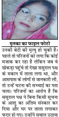
मृतका का फाइल फोटो