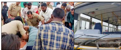
पत्नी गंभीर रूप से घायल, बाइक पर सवार होकर पूजा करने जा रहा था परिवार, बस चालक गिरफ्तार

तितावी ( मुजफ्फरनगर )। बुधवार दोपहर को एक भीषण सड़क हादसे में पिता और उसके दो बच्चों की मौत हो गई। एक तेज रफतार स्कूल बस ने बाइक को टक्कर मार दी, जिससे यह हादसा हुआ है। हादसे में एक महिला भी गंभीर रूप से घायल हुई है। हादसे के वक्त बस में स्कूली छात्राएं मौजूद थीं। टक्कर मारने के बाद ड्राइवर बस को लेकर खेत में घुस गया, जहां लोगों ने उसे पकड़ लिया। हादसा तितावी थाना क्षेत्र में हैदरनगर जलालपुर गांव पुल के पास हुआ।