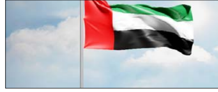
ईरान जंग में शामिल हो सकता है यूएई पेज 12