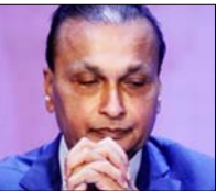
अनिल अंबानी कई बैंकों के साथ धोखाधड़ी मामले में कर रहे कानूनी कार्रवाई का सामना

नई दिल्ली। केंद्रीय जांच ब्यूरो यानी सीबीआई ने बुधवार को रिलायंस कम्युनिकेशंस लिमिटेड, इसके प्रमोटर अनिल अंबानी और कुछ अज्ञात सरकारी कर्मचारियों के खिलाफ एक नया मामला दर्ज किया है। यह मामला भारतीय जीवन बीमा निगम को कथित तौर पर 3,750 करोड़ रुपये का गलत तरीके से नुकसान पहुंचाने से जुड़ा है।