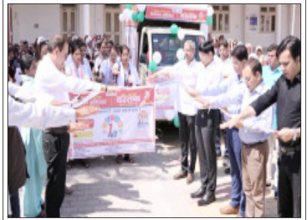
सम्भल- संचारी रोग अभियान की सफलता को शपथ दिलाते जिलाधिकारी।

शाह टाइम्स ब्यूरो सम्भला। विशेष संचारी रोग नियंत्रण एवं दस्तक अभियान के सफल क्रियाव्यवस्था को रैली का आयोजन किया गया। रैली को जिलाधिकारी ने हरी झंडी दिखाकर रवाना किया। कलेक्टर परिसर से आरंभ हुई रैली मुख्य चिकित्सा अधिकारी कार्यालय परिसर पर समाप्त हुई। इस दौरान जिलाधिकारी सभी लोगों को संचारी रोगों को लेकर शासन की ओर से उपलब्ध कराये गयी शपथ दिलाई। डीएम ने बताया कि संचारी रोग नियंत्रण अभियान 01 अप्रैल 26 से 30 अप्रैल 26 तक दस्तक अभियान दिनांक 10 अप्रैल से 30 अप्रैल 26 तक चलेगा। उन्होंने सभी विभागों को संचारी एवं दस्तक अभियान में शासन द्वारा दिये गये निर्देशों का पालन करते हुए सफल बनाने को निर्देशित