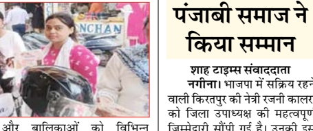
और बालिकाओं को विभिन्न टोल-फ्री हेल्पलाइन नंबरों से भी अवगत कराया गया। इनमें 1090 (वीमैन हेल्पलाइन), 112 (पुलिस आपातकालीन सेवा), 1076 (मुख्यमंत्री हेल्पलाइन) और 108 (एम्बुलेंस सेवा) प्रमुख थे। अभियान हेल्पलाइन नंबरों में 101 (अग्निशमन सेवा), 102 (गर्भवती महिलाओं और नवजात शिशु के लिए एम्बुलेंस), 1098 (चाइल्ड हेल्प लाइन), 181 (वीमैन हेल्पलाइन) और 1930 (साइबर फ्रेंड हेल्प लाइन) शामिल थे। जागरूकता के लिए पंपलेट भी वितरित किए गए।

शाह टाइम्स संवाददाता नजीबाबाद। मिशन शक्ति अभियान 5.0 के तहत महिला पुलिस ने महिलाओं और बालिकाओं को जागरूक किया। अभियान के दौरान सरकार द्वारा संचालित विभिन्न कल्याणकारी योजनाओं की जानकारी दी गई। इसमें विधवा पेंशन योजना, वृद्धा पेंशन योजना, सामूहिक विवाह योजना, प्रधानमंत्री उज्वला योजना और मुख्यमंत्री आवास योजना शामिल थीं। इसके अतिरिक्त, छात्रवृत्ति योजना और कन्या सुमंगला योजना के बारे में भी बताया गया। महिलाओं