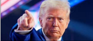
ईरान में चल रहा अमेरिकी सैन्य ऑपरेशन बहुत जल्द खत्म कर दिया जाएगा, एक माह से जारी जंग के बीच आया ट्रम्प का बयान

इसी उग्र हालात के बीच अब अमेरिका के राष्ट्रपति डोनाल्ड ट्रम्प का बड़ा बयान सामने आया है। उन्होंने कहा कि ईरान में चल रहा अमेरिकी सैन्य ऑपरेशन बहुत जल्द खत्म कर दिया जाएगा। अपने बयान में ट्रम्प ने आगे कहा कि अगले दो से तीन हफ्तों के अंदर