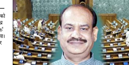
आंध्र प्रदेश विधानसभा ने जो प्रस्ताव केंद्र को भेजा था उस प्रस्ताव में अमरावती को राज्य की राजधानी बनाने के लिए नामित कर अमरावती को राज्य की राजधानी बनाने

नई दिल्ली। लोकसभा ने अमरावती को आंध्र प्रदेश की राजधानी बनाने वाले 'आंध्र प्रदेश पुनर्गठन (संशोधन) विधेयक 2026' को बुधवार को ध्वनिमत से पारित कर दिया। गृहराज्य मंत्री नित्यानंद राय ने इस पर हुई चर्चा का जवाब देते हुए कहा कि विधेयक पर करीब दो घंटे चर्चा चली जिसमें 13 से ज्यादा सदस्यों ने अपने महत्वपूर्ण सुझाव इसमें रखे हैं और लगभग सभी सदस्यों ने इस विधेयक का समर्थन किया है। उन्होंने बताया कि अमरावती को आंध्र प्रदेश की राजधानी बनाने को लेकर