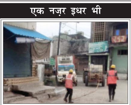
एक नज़र इधर भी

सामुदायिक स्वास्थ्य केंद्र गुनौर में भर्ती कराया गया। जहां दो घंटे के इलाज के बाद उनकी हालत स्थिर बताई जा रही है। डायल 112 पुलिस से पहुंचने के बाद स्थानीय थाना पुलिस भी घटनास्थल पर पुलिस पुर मामले को छानबीन कर रही है और आसपास लगे सीसीटीवी कैमरों को खंगाल रही है ताकि आरोपी का पता लगाया जा सके। पड़ोसी ने बताया कि दंपति घर के अंदर अचेत अवस्था में पड़े थे और सारा सामान बिखरा हुआ था उन्होंने जानकारी दी कि रात में