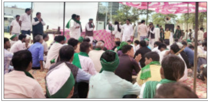
सम्भला किसानों की समस्याओं के निराकरण की मांग को बढ़ा मदान पर महापंचायत करते भाकियू असली के कार्यकर्ता

सम्भल/बबराला। निबंधन कार्यालय की कार्यप्रणाली को अधिक सुव्यवस्थित और समयबद्ध बनाने के लिए प्रशासन ने नई टाइम स्टाट व्यवस्था लागू करने का निर्णय लिया है। इसके तहत स्टाट आवंटन के एक घंटे की अवधि में अधिकारियों को अधिकारिता प्रदान की जा रही है। इससे निबंधन कार्य में तेजी आएगी और निबंधन प्रक्रिया में सुधार आएगा। इस दौरान रजिस्ट्री पूरी नहीं हो पाती है तो संबंधित पक्षकार को फ़िर से आवेदन कर नया स्टाट लेना पड़ेगा। नई व्यवस्था को लेकर विभाग, विलेख लेखकों और अधिवक्ताओं को सूचित कर रहा है। साथ ही आनलाइन स्टाट बुकिंग के समय आवेदकों को मोबाइल बुक किए गए स्टाट के भीतर बैनामा कराना अनिवार्य है। निबंधन विभाग से मिली जानकारी के मुताबिक यह नियम 1 अप्रैल 2026 से प्रभावी होगा और इस तारीख के बाद किए गए सभी आवेदनों पर अनिवार्य रूप से लागू रहेगा। यानी अब आवेदक को जो समय आवंटित किया जाएगा, उसकी वैधता केवल एक घंटे तक ही सीमित होगी। यदि