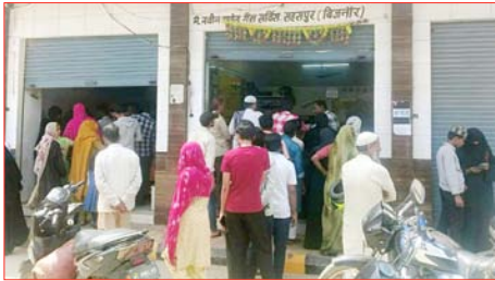
गैस ले लो। अभी होम डिलीवरी नहीं कराई जाएगी। जिससे उपभोक्ताओं में काफी गुस्सा देखने को मिल रहा है। उपभोक्ताओं ने बताया कि पहले की तरह होम डिलीवरी व्यवस्था नहीं होने से समस्या और बढ़ गई है। वहीं दूसरी तरफ हजारों उपभोक्ताओं ने बताया कि गैस बुक

शाह टाइम्स संवाददाता सहसपुर। नगर की आवाम को रसोई गैस की किल्लत से भारी परेशानियों का सामना करना पड़ रहा है। गैस एजेंसी के बाहर सुबह सात बजे से ही लंबी कतारें लग रही हैं। इसके बावजूद लोगों को समय पर सिलेंडर नहीं मिल पा रहा है। उपभोक्ताओं का कहना है कि गैस प्राप्त करने के लिए कई औपचारिकताओं से गुजरना पड़ रहा है। जिससे प्रक्रिया जटिल हो गई है। उपभोक्ताओं का आरोप है कि गैस एजेंसी द्वारा उनके बुकिंग हुए सिलेंडर को डिलीवर कर दिया जाता है, जिसका मैसैज उनके पास पहुंचता है, लेकिन सिलेंडर की डिलीवरी नहीं की जाती। यदि उपभोक्ता फोन से वितरक से पूछते हैं, तो वितरक कहते हैं कि आप लाइन में लगकर