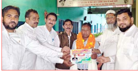
बैठक में सर्वसम्मति से लिया फैसला