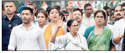
हिन्दू पहचान बनाम क्षेत्रीय विकास मुकाबला, किसकी होगी जीत सम्वादकीय