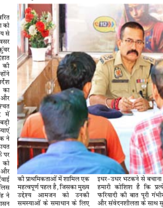
को प्राथमिकताओं में शामिल एक मसलपुत्रों में है, जिसका मुद्दा उर्रेय आबजान को उनकी समस्याओं के समाधान के लिए