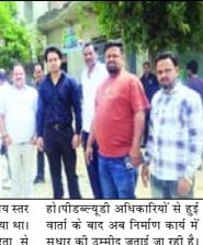
विद्यालयीय आर्थिकताओं से हुई धारा में करार अविनाश काव में विचारों मासला और गंभीरता में ही सड़क पर पानी भरना, जिसमें निर्माण की गुणवत्ता पर सवाया खर्च चेयरमैन ने संबंधित जेई और इंजीनियर से वार्ता की और मार्ग को ऊंचा करने की मांग रखी, जिसे स्वीकार कर

शाह टाइम्स संवाददाता /सैफनी। रामपुर कस्बे के अकबरपुर मार्ग पर चल रहे सड़क निर्माण कार्य को लेकर उठे सवाल को बीच अजय सभाधान की दिशा में कदम बढ़ा है। मार्ग पर जलभागी को समस्या को गंभीरता से लेते हुए चेयरमैन ने पीडितों की शिकायतों को समाने नाराजगी जताई थी, जिसके बाद अब सड़क को ऊंचा करने पर सहमति बन गई है।