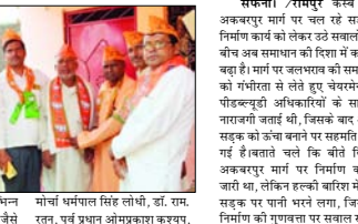
द्वारा संघाहित अधिनियम जनकव्यवस्थापन विधानसभा में जैस कव्या विद्यालय, विद्यालय समान विधि, छात्रावास योजना आदि के बारे में भी विचारों को उठाया गया। इस अवसर पर विद्यालयी भाजपा प्रोफेसर