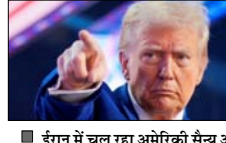
ईरान में चल रहा अमेरिकी सैन्य ऑपरेशन बहुत जल्द खत्म कर दिया जाएगा, एक माह से जारी जंग के बीच आया ट्रंप का बयान

वाशिंगटन। परिचय एशिया में जारी संघर्ष दिन-ब-दिन और भीषण हो रहा है। अमेरिका और इराकल के भीषण हमलों से युद्ध रूढ़ मोर्चे पर ईरान भी इराकल और खाड़ी देशों में मैजुद अमेरिकी सैन्य ठिकानों पर और परतवार कर रहा है। निर्यातों और ड्रोन की गजल के बीच यह संघर्ष अब अपने 33वें दिन में प्रवेश कर चुका है और पूरे क्षेत्र में तनाव अब भी चरम पर है।