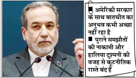
अमेरिकी सरकार के साथ बातचीत का अनुभव कभी अच्छा नहीं रहा है। पुराने समझौतों की नाकामी और हालिया दुश्मनी की वजह से कूटनीतिक रास्ते बंद हैं।

ईरानी विदेश मंत्री ने कहा: तेहरान को अमेरिकी कामों में कोई ईमानदारी नजर नहीं आती