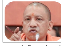
प्रत्येक ग्राम पंचायत स्तर पर विशेष शिबिर आयोजित किए जाएंगे

मुख्यमंत्री योगी आदित्यनाथ ने अधिकारियों को निर्देश दिया है कि प्रदेश के सभी पात्र किसानों का पंजीकरण प्राथमिकता के आधार पर सुनिश्चित किया जाए। सीएम ने कहा कि इस लक्ष्य को हासिल करने के लिए प्रत्येक ग्राम पंचायत स्तर पर विशेष शिबिर आयोजित किए जाएंगे, जहां किसानों को फार्मर रजिस्ट्री से जोड़ा जाएगा। उन्होंने स्पष्ट किया कि कोई भी पात्र किसान इस