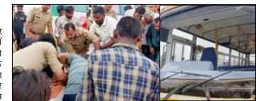
पत्नी गंभीर रूप से घायल, बाइक पर सवार होकर पकड़े जाने रहा था परिवार, बस चालक गिरफ्तार

तिहाकी (मुजफ्फरनगर) बुधवार दोपहर को एक भीषण सड़क हादसे में पिता और उनके दो बच्चों की मौत हो गई। एक तेज चलता स्कूल बस ने बाइक को टक्कर मार दी, जिससे यह हादसा हुआ है। हादसे में एक महिला भी गंभीर रूप से घायल हुई है। हादसे के वक्त बस में स्कूली छात्रा मौजूद थी। टक्कर मारने के बाद ड्राइवर लोग को लेकर खेत में घुस गया, जहां लोगों ने उसे पकड़ लिया। जलपास तिहाकी थाना क्षेत्र में हैरतनाक हादसा घटित होने के पता हुआ।