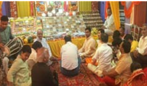
शक्ति से अगत करता। गोवर्धन पर्व पर अद्भुत सुनई गीत और पूजा परिसर का गमन, विद्वान् सूर्योदय का भोग, विद्वान् सूर्योदय को भोगभक्ति का दिया। इसके परंपरा साहसिक रूप से सुदूरकालीन हनुमान चालीसा का पाठ किया गया, जिससे पूरा परिसर भक्तिमय में ढूँढ गया। पत्थर गीतों और जवकारों से माहौल गुंजा रहा। पूजन के बाद भव्य आरती का आयोजन किया गया, जिसमें सैकड़ों श्रद्धालुओं ने एक साथ शामिल होकर आस्था का परिचय दिया। हनुमान भवा को सजगामी मीठीचूर के लहंगे में का भोग अर्पित किया गया। इसके उपरंत विवालय भंडारे का आयोजन किया गया, जिसमें सैकड़ों लोगों ने प्रसन्न रहकर आजा और सेवा भाव का परिचय दिया। मंदिर परिसर को रंग-रंगीली रोशनी और फूलों से आकर्षक ढंग से सजाया गया। ओ उद्घाटनों के आयोजन का केंद्र बना रहा। आयोजन के दौरान 'श्रद्धालुओं में विश्वास उत्साह और उमंग देखने को मिली। कार्यक्रम संयोजक पीडिए आनंद भाद्रानंद, पीठाधीश्वर महाराष्ट्रिय धाम

शाह टाइम्स संवाददाता विलायथक। नगर में इन दिनों भक्ति, आस्था और उत्सव का अद्भुत संगम देखने को मिला रहा है। एक और उत्सव रोड स्थित बाबा मुकुंद धरणील में श्रीमद्भागवत कथा के दौरान श्रीकृष्ण जन्म प्रयाग का आयोजन किया गया।