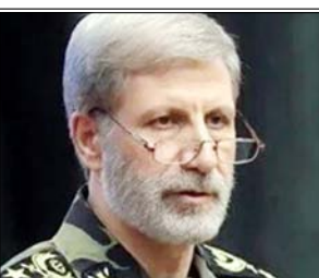
ईरान की सेना ने अमेरिकी जमीनी हमले की आशंका के मद्देनजर अपनी तैयारियाँ तेज कर दी हैं। आमीर हतामी ने सैन्य मुख्यालयों को अमेरिका और इजरायल की गतिविधियों पर 'पल-पल नजर' रखने के निर्देश दिए

यह बयान उस समय आया है जब अमेरिका के राष्ट्रपति डोनाल्ड ट्रम्प ने इराक के खिलाफ तीन से चार सप्ताह तक चलने वाले तीव्र सैन्य अभियान की घोषणा की है और दावा किया है कि अमेरिका इराक की सैन्य क्षमता को काफी हद तक नष्ट कर चुका है। उन्होंने यह भी कहा कि इराक ने युद्धविराम की मांग की है, जिसे तेहरान ने तुरंत खारिज कर दिया। इराक के राष्ट्रपति मसूद पेजेशकियान ने कहा कि इराक की जनता का अमेरिका, यूरोप या