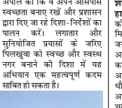
अपील की कि वे अपने आसपास स्वच्छता बनाए रखें और प्रशासन द्वारा दिए जा रहे दिशा-निर्देशों का पालन करें। लावार और सुनिश्चित प्रयासों के जरिए पिलखुवा को स्वच्छ और स्वस्थ बनाने का दिशा में यह अभियान एक महत्वपूर्ण कदम साबित हो सकता है।

कर उन्हें समाप्त करने पर जोर दिया जाएगा, बल्कि रंगी और प्रतीक। जैसे हलकालक रोगों को समाप्त करने का साधन है। अभियान को और अधिक प्रभावी बनाने के लिए 10 अप्रैल से 'श्रद्धालुओं में विश्वास उत्साह और उमंग देखने को मिली। कार्यक्रम संयोजक पीडिए आनंद भाद्रानंद, पीठाधीश्वर महाराष्ट्रिय धाम