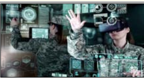
चीन ने खुद को सार्वजनिक तौर पर खुद को इस संघर्ष से दूर रखने का दावा किया है

उपलब्ध डेटा के साथ मिला रही हैं। इस डेटा में सेटलाइट इमेजरी, फ्लाइंग टैक और शिपिंग जानकारी शामिल है। पांच हफ्तों पहले ईरान संघर्ष शुरू होने के बाद से यह ट्रेंड और बढ़ गया है। आनलाइन पोस्ट में अमेरिकी कैरियर मूवमेंट, एयरक्राफ्ट की पोजिशनिंग और बेस गतिविधियों की