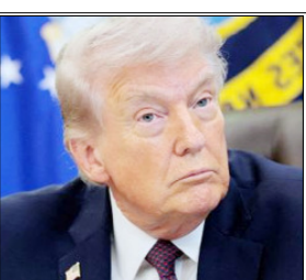
दावा: तेहरान में एक भीषण हमले में ईरान के कई शीर्ष सैन्य अधिकारियों को किया खत्म पायलट ईरान के दुर्गम पहाड़ों में दुश्मन की सीमा के पीछे था: ट्रम्प

वाशिंगटन। अमेरिकी राष्ट्रपति डोनाल्ड ट्रम्प ने रविवार सुबह घोषणा की कि अमेरिका ने ईरानी क्षेत्र से उन दो लड़ाकू पायलटों को सुरक्षित निकाल लिया है, जो शनिवार को ईरानी सेना के हमले में दो अमेरिकी विमानों के गिराए जाने के बाद से लापता हो गए थे।