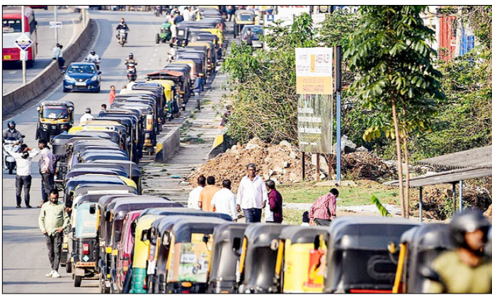
कर्नाटक। चित्तमंगलुरु में एलापीजी की आपूर्ति बाधित होने के कारण ऑटो-रिक्शा की लंबी कतारें।