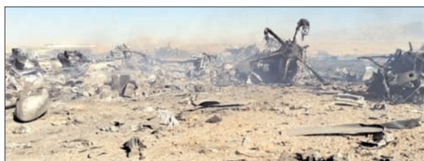
ईरान ने अमेरिकी विमानों को तबाह करने के सबूत देते हुए विमानों के मलबे की तस्वीरें और वीडियो जारी किए

ईरान और अमेरिका के बीच जारी युद्ध लगातार तेज होता दिख रहा है। ईरान की ओर से लगातार अमेरिका विमानों को मार गिराने का दावा किया जा रहा है। रविवार को ईरान की ओर से अमेरिका के विमानों को तबाह करने के सबूत जारी किए गए हैं। ईरानी न्यूज एजेंसी ने अमेरिका के विमानों के मलबे की तस्वीरें और वीडियो जारी किए हैं। ईरान का दावा है कि उसने इस्फहान इलाके में अमेरिकी सैन्य मिशन के दौरान दो ब्लैकहॉक हेलीकॉप्टर और दो सी-130 ट्रांसपोर्ट एयरक्राफ्ट को मार गिराया। ईरान की इस्लामिक