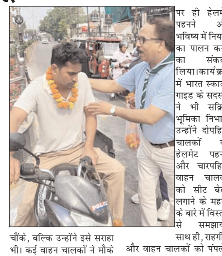
चौके, बल्कि उन्होंने इसे सरहा भी। कई वाहन चालकों ने मौके और वाहन चालकों को पंपलेट

शाह टाइम्स ब्यूरो मुरादाबाद। शहर के पीली कोठी चौराहे पर रविवार को ट्रैफिक पुलिस और भारत स्काउट गाइड द्वारा एक अनोखा जागरूकता अभियान चलाया गया, जिसने लोगों का ध्यान अपनी ओर आकर्षित किया। आमतौर पर नियम तोड़ने पर चालान काटने वाली ट्रैफिक पुलिस ने इस बार सख्ती के बजाय सकारात्मक और प्रेरणादायक तरीका अपनाया। अभियान के दौरान बिना हेलमेट दोपहिया वाहन चलाने वाले चालकों को रोककर उनका चालान करने के बजाय उन्हें फूलों की माला पहनाई गई और मुस्कुराते हुए यातायात नियमों का पालन करने की अपील की गई। इस अनूठे अंदाज से लोग न केवल