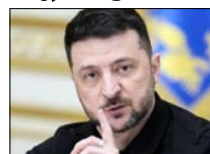
संघर्ष लंबा खिंचता है, तो इससे यूक्रेन के प्रति अमेरिका का समर्थन और कमजोर हो सकता है: जेलेन्स्की

इस्तांबुल। पश्चिम एशिया संकट का असर वैश्विक तौर पर दिख रहा है और पूरी दुनिया में इसे लेकर चिंता का माहौल है। हालांकि यूक्रेन के राष्ट्रपति वोलोदिमिर जेलेन्स्की इस युद्ध से खास तौर पर तनावग्रस्त हैं। जेलेन्स्की ने आशंका जताई है कि अगर अमेरिका-इजरायल और ईरान के बीच संघर्ष लंबा खिंचता है, तो इससे यूक्रेन के प्रति अमेरिका का समर्थन और कमजोर हो सकता है। उन्होंने कहा कि वाशिंगटन की प्राथमिकताओं में बदलाव के चलते यूक्रेन को बेहद जरूरी पैट्रियट एयर डिफेंस मिसाइलें, तो इससे यूक्रेन में कमी का सामना करना पड़ सकता है। इस्तांबुल में 'द एसोसिएटेड प्रेस' को दिए एक इंटरव्यू में जेलेन्स्की ने कहा कि रूस के रोजाना हमलों का सामना करने के लिए यूक्रेन को अमेरिका में बने पैट्रियट एयर डिफेंस सिस्टम की