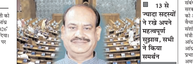
आंध्र प्रदेश विधानसभा ने जो प्रस्ताव केंद्र को भेजा था उस प्रस्ताव में अमरावती को राज्य की राजधानी बनाने के लिए नामित कर अमरावती को राज्य की राजधानी बनाने का प्रावधान किया गया है। उन्होंने कहा कि आंध्र प्रदेश सरकार ने 2015 में इसके लिए अधिसूचना जारी करते हुए कहा था कि अमरावती जारी की राजधानी होगी। इस

नई दिल्ली। लोकसभा ने अमरावती को आंध्र प्रदेश की राजधानी बनाने वाले 'आंध्र प्रदेश पुनर्गठन (संशोधन) विधेयक 2026' को बुधवार को ध्वनिमत से पारित कर दिया। गृहराज्य मंत्री नित्यानंद राय ने इस पर हुई चर्चा का जवाब देते हुए कहा कि विधेयक पर करीब दो घंटे चर्चा चली जिसमें 13 से ज्यादा सदस्यों ने अपने महत्वपूर्ण सुझाव इसमें रखे हैं और लगभग सभी सदस्यों ने इस विधेयक का समर्थन किया है। उन्होंने बताया कि अमरावती को आंध्र प्रदेश की राजधानी बनाने को लेकर