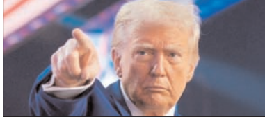
ईरान में चल रहा अमेरिकी सैन्य ऑपरेशन बहुत जल्द खत्म कर दिया जाएगा, एक माह से जारी जंग के बीच आया ट्रम्प का बयान

वाशिंगटन। पश्चिम एशिया में जारी संघर्ष दिन-ब-दिन और भयावह होता जा रहा है। अमेरिका और इजरायल के भीषण हमलों से दहक रहे मोर्चे पर ईरान भी इजरायल और खाड़ी देशों में मैजुद अमेरिकी सैन्य ठिकानों पर जोरदार पलटवार कर रहा है। मिसाइलों और ड्रोन की गरज के बीच यह संघर्ष अब अपने 33वें दिन में प्रवेश कर चुका है और पूरे क्षेत्र में तनाव अब भी चरम पर है। इसी उग्र हालात के बीच अब अमेरिका के राष्ट्रपति डोनाल्ड ट्रम्प का बड़ा बयान सामने आया है। उन्होंने कहा कि ईरान में चल रहा अमेरिकी सैन्य ऑपरेशन बहुत जल्द खत्म कर दिया जाएगा, एक माह से जारी जंग के बीच आया ट्रम्प का बयान