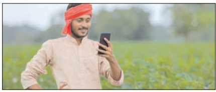
उप्र में फॉर्मर रजिस्ट्री से जुड़ेगा हर किसान

नई दिल्ली, मुजफ्फरनगर, देहरादून, हल्द्वानी, मुगदाबाद, बरेली, मेरठ व लखनऊ से प्रकाशित