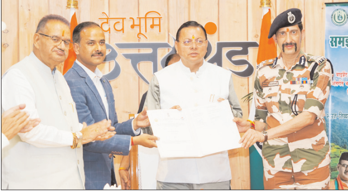
मुख्यमंत्री धामी और कृषि मंत्री जोशी रहे मौजूद

शाह टाइम्स ब्यूरो देहरादून। मुख्यमंत्री पुष्कर सिंह धामी की उपस्थिति में बुधवार को मुख्यमंत्री आवास में 'वाइब्रेंट विलेज कार्यक्रम' के अंतर्गत भारत-तिब्बत सीमा पुलिस बल की उत्तराखंड में तैनात वाहिनियों के लिए स्थानीय उत्पादों (ताजे फल एवं सब्जियों) की आपूर्ति सुनिश्चित करने के लिए भारत-तिब्बत सीमा पुलिस बल और उत्तराखंड औद्योगिक परिषद के मध्य समझौता ज्ञापन पर हस्ताक्षर किए गए।