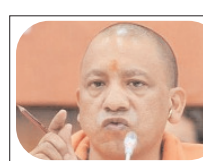
मुख्यमंत्री योगी आदित्यनाथ ने अधिकारियों को निर्देश दिया है कि प्रदेश के सभी पात्र किसानों का पंजीकरण प्राथमिकता के आधार पर सुनिश्चित किया जाए।

लखनऊ। उप्र सरकार ने किसानों को सरकारी योजनाओं का लाभ सरल, पारदर्शी और एकीकृत तरीके से उपलब्ध कराने के लिए फार्मर रजिस्ट्री को व्यापक स्तर पर लागू करने का निर्णय लिया है।