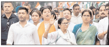
हिन्दू पहचान बनाम क्षेत्रीय विकास मुकाबला, किसकी होगी जीत