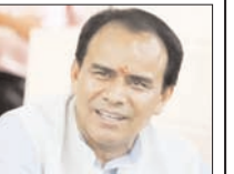
कहा, नए टेंडर होने तक पूर्व में अनुबंधित संस्था करेगी कार्यक्रम का संचालन

मुख्य संवाददाता शाह टाइम्स देहरादून। सूबे के 200 विद्यालयों में व्यावसायिक शिक्षा कार्यक्रम निर्वाह रूप से संचालित किये जायेंगे। इसके अलावा नये शिक्षा सत्र 2026-27 में 544 और विद्यालयों में भी पारम्परिक विषयों के साथ ही व्यावसायिक शिक्षा शुरू की जाएगी। इसके लिये विभागीय अधिकारियों को निजी संस्थाओं के साथ शीघ्र अनुबंध करने के निर्देश दे दिये गये हैं। साथ ही नये टेंडर होने तक पूर्व में अनुबंधित संस्था