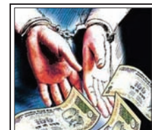
अन्याय भी है।

शाह टाइम्स ब्यूरो देहरादून। मुख्यमंत्री पुष्कर सिंह धामी के नेतृत्व में प्रदेश में भ्रष्टाचार के खिलाफ चल रही जीरो टॉलरेंस नीति का प्रभाव अब स्पष्ट रूप से जमीन पर दिखाई दे रहा है। इसी क्रम में देहरादून जनपद के डोईवाला क्षेत्र में तैनात उप शिक्षा अधिकारी एवं उनकी महिला सहयोगी को 1 लाख रुपये की रिश्वत लेते हुए रंगे हाथ गिरफ्तार किया जाना सरकार की भ्रष्टाचार विरोधी प्रतिबद्धता का सशक्त उदाहरण है।