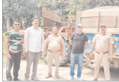
प्लग निकाले जाने के कारण वाहन चालू नहीं हो सका। बाद में मैकेनिक को बुलाकर ट्रैक्टर स्टार्ट कराया गया और उसे वन विभाग कार्यालय परिसर में खड़ा कर दिया गया। वन विभाग के अनुसार ट्रैक्टर-ट्रॉली में बिना अनुमति के बजरी का परिवहन किया जा रहा था। वाहन को जब्त कर अग्रिम कानूनी कार्रवाई शुरू कर दी गई है।

शाह टाइम्स संवाददाता रुड़की। अवैध खनन के खिलाफ कार्रवाई करते हुए वन विभाग और खनन विभाग की संयुक्त सतर्कता में बजरी से लदी एक ट्रैक्टर-ट्रॉली को पकड़ लिया गया। हालांकि कार्रवाई के दौरान चालक वाहन का प्यूज प्लग निकालकर मौके से फरार हो गया। घटना के बाद क्षेत्र में काफी देर तक लोगों की भीड़ जुटी रही। मामला मंगलवार देर रात का बताया जा रहा है। जानकारों के अनुसार वन विभाग की टीम गश्त पर थी। इसी दौरान दादूवास की ओर से आती बजरी से भरी एक ट्रैक्टर-ट्रॉली सॉइंग अवस्था में