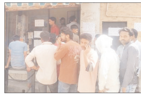
को दोपहर तक गैस सिलेंडर मिल गए। बाद में कुछ लोग ही गैस सिलेंडर लेने के लिए आए किसी को भी निराश नहीं होना पड़ा।