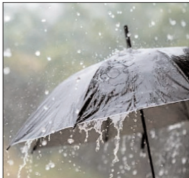
पूर्वी उत्तर प्रदेश में कुछ स्थानों पर गरज-चमक के साथ बारिश होने की संभावना है। मौसम विज्ञान विभाग के अनुसार मंगलवार देर रात से ही बादलों की आवाजाही शुरू हुई और देर रात करीब 12 बजे के बाद हल्की बारिश होने लगी।

लखनऊ। उत्तर प्रदेश में पिछले 24 घंटे में पश्चिमी संभाग में कहीं-कहीं बादल गरजे और हल्की से मध्यम बारिश हुई। वहीं पूर्वी उत्तर प्रदेश के ज्यादातर इलाकों में मौसम सूखा रहा। इसके अतिरिक्त प्रदेश के दोनों संभागों में कहीं-कहीं झोंकदार हवा भी दर्ज की गई। प्रदेश में झोंकों के साथ हवा की अधिकतम गति 50 किलोमीटर प्रति घंटा गौतम बुद्ध नगर और संभल में दर्ज की गई।