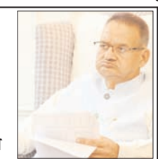
उर्वरकों की कालाबाजारी पर भी प्रभावी अंकुश लगाया।

केंद्रीय कृषि मंत्री शिवराज सिंह चौहान की अध्यक्षता में फार्मर आईडी के संबंध में आयोजित बैठक में