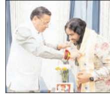
देहरादून। मुख्यमंत्री पुष्कर सिंह धामी ने बुधवार मुख्यमंत्री आवास में प्रसिद्ध कथा वाचक एवं आध्यात्मिक गुरु देवकीनंदन ठाकुर जी महाराज ने शिष्टाचार भेंट की।

इस अवसर पर दोनों के बीच सनातन संस्कृति के संरक्षण, आध्यात्मिक जागरूकता के प्रसार तथा समाज में नैतिक मूल्यों के सुदृढ़ीकरण को लेकर विस्तृत चर्चा हुई। मुख्यमंत्री ने महाराज जी के आध्यात्मिक और सामाजिक कार्यों की सराहना करते हुए कहा कि उनके प्रयासों से समाज में सकारात्मक ऊर्जा का संचार हो रहा है और युवाओं को भारतीय संस्कृति एवं परंपराओं से जोड़ने में महत्वपूर्ण योगदान मिल रहा है।