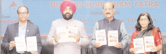
सुरक्षित चारधाम यात्रा के लिए 'पिलग्रिमेज एजुकेशन हैंडबुक' का किया विमोचन ■ पर्वतीय मार्गों में सावधानी जरूरी, चारधाम यात्रा के लिए जागरूकता पर दिया जोर

शाह टाइम्स ब्यूरो देहरादून। हेमवती नंदन बहुगुणा चिकित्सा शिक्षा विश्वविद्यालय ने बुधवार को लोक भवन में 'चार धाम यात्रा के दौरान चिकित्सा समस्याएं और सड़क दुर्घटना सुरक्षा उपाय' विषय पर एक दिवसीय सेमिनार आयोजित किया गया। इस सेमिनार में विषय विशेषज्ञों द्वारा ऊंचाई पर होने वाली बीमारी से बचाव एवं पूर्व तैयारी जैसे महत्वपूर्ण विषयों पर अपने विचार साझा किए।