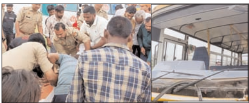
पत्नी गंभीर रूप से घायल, बाइक पर सवार होकर पूजा करने जा रहा था परिवार, बस चालक गिरफ्तार