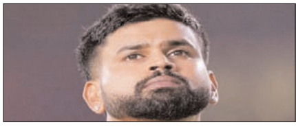
श्रेयस अय्यर पर लगा 12 लाख का जुर्माना