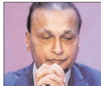
अनिल अंबानी कई बैंकों के साथ धोखाधड़ी मामले में कर रहे कानूनी कार्रवाई का सामना

यह जांच ऐसे समय में शुरू हुई है जब अनिल अंबानी पहले से ही कई सार्वजनिक क्षेत्र के बैंकों के साथ भारी धोखाधड़ी के मामलों में कानूनी कार्रवाई का सामना कर रहे हैं। अधिकारियों के बयान के अनुसार, यह नया मामला एलआईसी की ओर से मिली शिकायत के आधार पर दर्ज किया गया है। इसमें साजिश, धोखाधड़ी, पैसों की हेराफेरी और भ्रष्टाचार निवारण अधिनियम के तहत गंभीर आरोप लगाए गए हैं। शिकायत में कहा गया है कि आरकॉम और उसके प्रबंधन ने कंपनी के वित्तीय स्वास्थ्य, सुरक्षा और परिसंपत्ति कवर के बारे में झूठे दावे किए। इन धामक जानकारी के आधार पर एलआईसी को 4,500 करोड़ रुपये