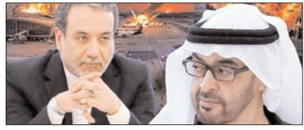
ईरान जंग में शामिल हो सकता है यूई