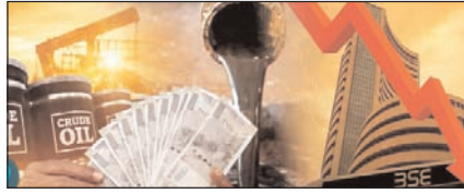
सुधार या बोझ? आम आदमी की जेब पर लगातार पड़ता भार