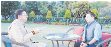
देश के चुनिंदा राज्यों में शामिल हुई उत्तराखंड की पुलिस सीएम पुष्कर धामी ने बताया ऐतिहासिक उपलब्धि