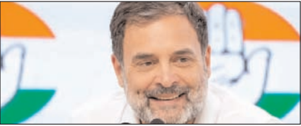
सैनिकों को मिले सम्मान जिसके हैं वे हकदार: राहुल गांधी

नई दिल्ली, मुजफ्फरनगर, देहरादून, हल्द्वानी, मुतादाबाद, बरेली, मेरठ व लखनऊ से प्रकाशित