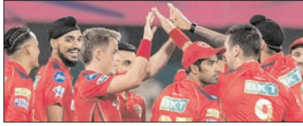
पंजाब किंग्स का हरफनमौला संतुलन रंग लाएगा