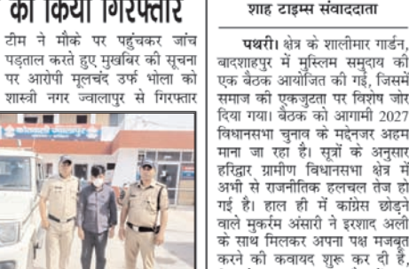
नाबालिग के साथ मारपीट, छेड़छाड़ व जबरदस्ती के आरोपी को किया गिरफ्तार। आरोपी के कब्जे से छीने गए कुंडल व घटना में प्रयुक्त बाइक बरामद की गयी है।