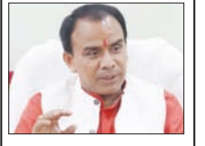
एमबी पीजी कॉलेज व कोटद्वार महाविद्यालय में लेब अपग्रेडेशन को 4 करोड़ जारी कहा, आईआईटी कानपुर की सहायता से उच्चीकृत की जाएंगी प्रयोगशालाएं

मुख्य संवाददाता शाह टाइम्स देहरादून। उच्च शिक्षा विभाग के अंतर्गत संचालित एमबी पीजी कॉलेज हल्द्वानी एवं कोटद्वार महाविद्यालय में स्थापित प्रयोगशालाओं को हाईटेक बनाया जायेगा। दोनों महाविद्यालयों की प्रयोगशालाओं के उच्चीकरण को 4 करोड़ की धनराशि जारी कर दी गई है। इन दोनों महाविद्यालयों में विज्ञान प्रयोगशालाओं को आईआईटी कानपुर के सहयोग से उच्चीकृत किया जायेगा, ताकि वहां अध्ययनरत छात्र-छात्राओं को आधुनिक उपकरणों के जरिये प्रयोगात्मक एवं शोधात्मक प्रशिक्षण मिल सके।