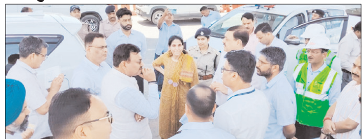
सभी कार्यों को तय समय में पूर्ण करने के निर्देश, गुणवत्ता पर विशेष जोर ग्रीन घाट एवं सौंदर्यीकरण पर विशेष फोकस, साप्ताहिक समीक्षा के आदेश