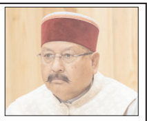
शहर के भीतर लगने वाले जाम से यात्रियों को मिलेगी निजात

शाह टाइम्स प्रमुख संवाददाता देहरादून। उत्तराखंड में ट्रेफिक जाम को कम करने और चारधाम यात्रा को सुगम बनाने के लिए केंद्र सरकार की ओर से ऋषिकेश बाईपास के 4-लेन निर्माण के लिए 1105.79 करोड़ की मंजूरी दिये जाने पर प्रदेश के पर्यटन धर्मस्व, संस्कृति, लोक निर्माण मंत्री सतपाल महाराज ने प्रधानमंत्री नरेंद्र मोदी, केंद्रीय सड़क परिवहन एवं राजमार्ग मंत्री नितिन गडकरी, मुख्यमंत्री पुष्कर धामी और सड़क परिवहन एवं राजमार्ग राज्य मंत्री अजय टट्टा का आभार जताया है। महाराज ने कहा कि 12.67 किमी लंबा यह नया एनएच-7 बाईपास नेपाली फार्म (तीनपानी) के पास से शुरू होकर खारासोत तक