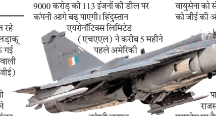
9000 करोड़ की 113 इंजनों की डील पर कंपनी आगे बढ़ पाएगी। हिंदुस्तान एयरोनॉटिक्स लिमिटेड (एचएएल) ने करीब 5 महीने पहले अमेरिकी कंपनी जनरल इलेक्ट्रिक (जीई) के साथ 1 अरब डॉलर (करीब 8,870 करोड़) की डील की थी। इससे पहले फरवरी 2021 में सरकार ने एचएएल के साथ 83 तेजस मार्क-11 खरीदने के लिए 48,000 करोड़ का करार किया था, लेकिन एचएएल अमेरिकी इंजन की डिलीवरी में देरी की वजह से अभी तक एक भी एयरक्राफ्ट नहीं सौंप पाया है। उम्मीद है कि 2028 तक एचएएल सभी एयरक्राफ्ट

नई दिल्ली। मिडिल-ईस्ट में चल रहे युद्ध के कारण भारत के बहुप्रतीक्षित लड़ाकू विमान तेजस के इंजन की सप्लाई रुक गई है। इन विमानों के इंजन सप्लाई करने वाली अमेरिकी कंपनी जनरल इलेक्ट्रिक (जीई) ने हिंदुस्तान एयरोनॉटिक्स लिमिटेड (एचएएल) को कह दिया है कि अभी सप्लाई नहीं दे पाएंगे। भारोसेमंद सूत्रों ने बताया कि अब साल के अंत तक ही इंजन मिलने की उम्मीद है। एचएएल ने मार्च 2026 तक 24 तेजस विमान वायुसेना को देने का वादा किया था, लेकिन, एचएएल में खड़े 9 तेजस एमके 1ए विमान इंजन के अभाव में वायुसेना को नहीं मिल पा रहे हैं। जबकि 5 विमान पूरी तरह तैयार हैं। 19 विमानों के एयर फ्रैम भी तैयार हैं। यदि आपूर्ति बहाल होती है तो इस साल 24 और अगले साल तक 30 इंजन मिल जाएंगे।