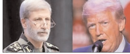
अमेरिका ने जमीनी हमला किया, तो कोई जिंदा नहीं बचेगा: ईरान