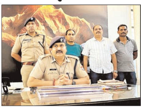
महिला के कुंडल छीनने के आरोपी को पुलिस ने किया गिरफ्तार। आरोपी के कब्जे से छीने गए कुंडल व घटना में प्रयुक्त बाइक बरामद की गयी है।