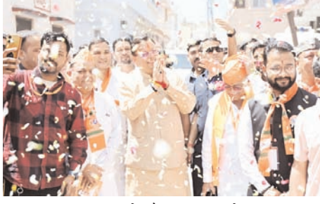
चारधाम यात्रा को और सशक्त बनाने पर दिया जा रहा है ध्यान रामनगर के छोई स्थित श्री हनुमान धाम में पूजा-अर्चना कर प्रदेश की खुशहाली की कामना

शाह टाइम्स ब्यूरो रामनगर/ नैनीताल। मुख्यमंत्री पुष्कर सिंह धामी ने गुरुवार को रामनगर के छोई स्थित श्री हनुमान धाम में पूजा-अर्चना कर प्रदेश की खुशहाली की कामना की। इस अवसर पर मुख्यमंत्री ने सभी जनप्रतिनिधियों, पदाधिकारियों एवं श्रद्धालुओं का स्वागत करते हुए कहा कि यहां उपस्थित प्रत्येक श्रद्धालु पर बजरंग, बली की विशेष कृपा है, क्योंकि उनकी इच्छा के बिना कोई भी उनके दरबार तक नहीं पहुंच सकता।