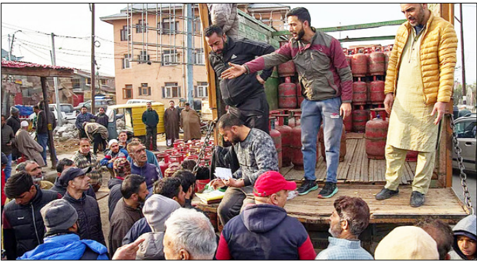
श्रीनगर। सड़क केनारे एक अधिकृत डीलर से घरेलू उपयोग के लिए तरलीकृत प्राकृतिक गैस के सिलेंडर लेने के लिए इंतजार करते लोग।