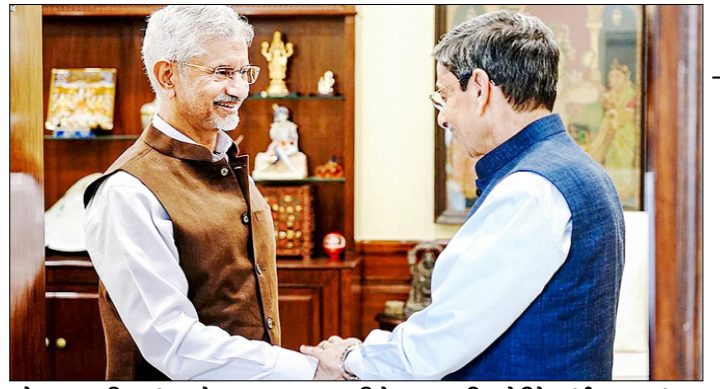
कोलकाता। पश्चिम बंगाल के राज्यपाल आरएन एच के साथ हाथ मिलाते विदेश मंत्री एस जयशंकर।

अड्डे के इस्तेमाल की अनुमति अमेरिकी बमवर्षक विमानों को देने से इन्कार कर दिया था। यूरोपीय देशों के इन्कार से अमेरिकी राष्ट्रपति डोनाल्ड ट्रम्प भी काफी खफा हैं। वो टुध के अलावा विभिन्न प्लेटफॉर्म पर खुलकर विरोध जता चुके हैं। कई मीडिया साक्षात्कार में खुले तौर पर नाटो और यूरोपीय देशों के खिलाफ राय जाहिर कर चुके हैं। लगभग हर दूसरे दिन वो टुध पर मदद न करने का तंज कसते हुए कह देते हैं कि अमेरिका याद रखेगा। जिस होर्मुज स्ट्रेट पर कब्जे का वो दावा करते थे अब उसे लेकर भी उन्होंने रुचि नहीं दिखाई है। राष्ट्र के नाम अपने संबोधन में कहा कि अब उसकी जिम्मेदारी वो उठाए, जिन्हें वहां से अपना सामान ले जाना है। हाल ही में डेली टेलीग्राफ को दिए एक साक्षात्कार में ट्रम्प ने ईरान-इजरायल संघर्ष के दौरान नाटो सहयोगियों, खासकर ब्रिटेन और फ्रांस की ओर से सैन्य मदद न देने पर नाराजी जताई। ट्रम्प ने नाटो को कागजी शेर करार दिया और अमेरिका के गठबंधन से बाहर निकलने की धमकी दी।