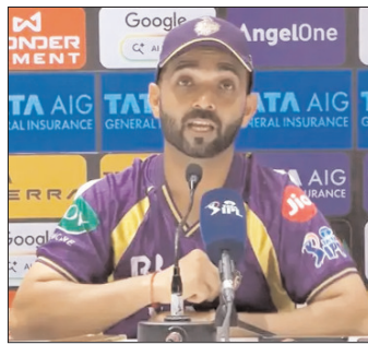
एसआरएच के खिलाफ भी कहानी लगभग वही रही। शुरुआती पांच ओवर में 67 रन ठोकने के बावजूद टीम उस रफ्तार को बरकरार नहीं रख पाई। इस मैच में रहाणे ने खुद 10 गेंदों पर महज 8 रन बनाए, जिसके बाद उनके स्ट्राइक रेट पर सवाल उठाना लाजमी था। हालांकि, आमतौर पर शांत रहने वाले रहाणे ने इस बार जवाब थोड़ा अलग तरीके से दिया। उन्होंने कहा कि 2023 के बाद से पावरप्ले में मेरा स्ट्राइक रेट बेहतरीन रहा है। (552 रन, 167-78 की स्ट्राइक रेट, 69 का औसत) जो लोग मेरे खेल या स्ट्राइक रेट पर बात कर रहे हैं।

कोलकाता, वार्ता। कोलकाता नाइट राइडर्स (केकेआर) को सनराइजर्स हैदराबाद के खिलाफ 65 रनों के बड़े अंतर से हार झेलनी पड़ी है। आईपीएल 2026 में मुंबई इंडियंस (एमआई) के बाद यह उनकी लगातार दूसरी शिकस्त है। इन दोनों ही मैचों के बाद कप्तान अजिंक्य रहाणे एक शब्द का बार-बार प्रयोग कर रहे हैं - 'टीम संतुलन'। हालांकि एसआरएच के खिलाफ मिली हार ने साफ कर दिया है कि समस्या सिर्फ चोटिल गेंदबाजों तक सीमित नहीं है, बल्कि केकेआर के मध्यक्रम में भी कुछ समस्याएँ हैं। मैच के बाद प्रेस कॉन्फ्रेंस में रहाणे ने एसआरएच के खिलाफ मिली हार का एक प्रमुख कारण बीच के ओवरों में साझेदारी न बन पाना बताया। उन्होंने कहा, ध्यान की विकेट बल्लेबाजी के लिए मुफ्रीद थी, लेकिन हमारी बल्लेबाजी में वह लय नजर नहीं आई। इतने बड़े लक्ष्य का पीछा करने के लिए हमें और बेहतर बल्लेबाजी की जरूरत थी। बीच के ओवरों में हम साझेदारी नहीं कर सके, जबकि जरूरत यह थी कि कुछ बड़ी साझेदारियाँ हों और खेल को अंत तक ले जाया जाए। मुंबई इंडियंस के खिलाफ पहले मैच में भी केकेआर ने बीच के ओवरों में ही मोमेंटम गंवाया था। उस मैच में केकेआर ने 10 ओवर में 120 रन बना दिए थे, लेकिन अगले 10 ओवरों में टीम सिर्फ 102 रन ही जोड़ सकी।