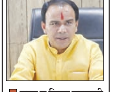
■ राज्य व जिला सहकारी बैंकों की 290 शाखाओं ने कमाया मुनाफा

मुख्य संवाददाता शाह टाइम्स देहरादून। सूबे के राज्य सहकारी बैंकों एवं जिला सहकारी बैंकों की 290 शाखाओं ने वित्तीय वर्ष 2025-26 में उल्लेखनीय प्रदर्शन कर अपनी वित्तीय मजबूत कर 269.72 करोड़ का लाभ अर्जित किया है। एनपीए नियंत्रण के मोर्चे पर भी बैंकों ने सख्त वित्तीय अनुशासन दिखाते हुये 39.88 करोड़ का एनपीए कम किया है, जोकि विगत वित्तीय वर्ष की तुलना में 6 फीसदी से अधिक कम हुआ है।