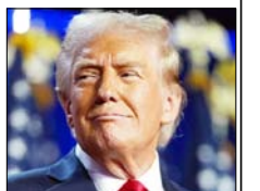
कहा: अगर उनकी शर्तें नहीं मानी तो वह उनके नागरिक बुनियादी ढांचे-जैसे पुलों और बिजल पावर प्लांट्स को निशाना बनाकर नष्ट कर देंगे

वाशिंगटन। अमेरिका के राष्ट्रपति डोनाल्ड ट्रम्प ने शुक्रवार को ईरान को चेतावनी दी है कि वह ईरान के और भी पुलों और बिजलीघरों को तबाह कर देंगे। उन्होंने ईरान से कहा है कि जो 'किया जाना चाहिए', उसे 'तेजी' से करे। अमेरिका के राष्ट्रपति डोनाल्ड ट्रम्प ने ईरान को चेतावनी दी है कि अगर उनका शर्तें नहीं मानी तो वह उनके नागरिक बुनियादी ढांचे-जैसे पुलों और बिजल पावर प्लांट्स को निशाना बनाकर तबाह कर देंगे। ट्रम्प ने सोशल मीडिया पर लिखा कि अमेरिकी सेना ने 'ईरान में अभी तक नष्ट करने की प्रक्रिया भी शुरू नहीं की है' और कहा 'पहले पुल, फिर पावर प्लांट्स' को लक्ष्य बनाया जाएगा। उन्होंने लिखा कि अगला नंबर पुलों का है, फिर बिजलीघरों का। ईरान के नए शासन को पता है कि क्या