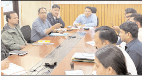
जिलाधिकारी के सख्त निर्देश, लापरवाही पर होगी कड़ी कार्रवाई, समन्वय से सफल होगी यात्रा