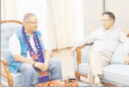
बीच उत्तराखंड एवं अरुणाचल प्रदेश में कृषि और बागवानी के क्षेत्र में हो रहे नवाचारों, योजनाओं तथा विकास की संभावनाओं पर विस्तृत