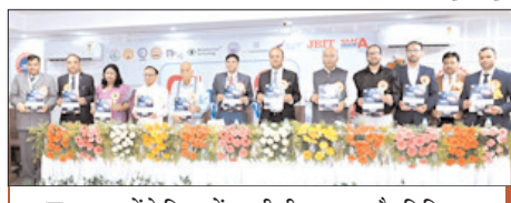
वक्ताओं ने शिक्षा में तकनीकी नवाचार और डिजिटल परिवर्तन की दिशा को उर्जा प्रदान की

शाह टाइम्स संवाददाता सेलाकुई। जेबीआईटी ग्रुप ऑफ इंस्टीट्यूट्स ने अपनी शैक्षणिक उत्कृष्टता और अनुसंधान नवाचार की परंपरा को एक नए आयाम पर पहुंचाते हुए छठी नेशनल कॉन्फ्रेंस ऑन रिसर्च इन्वेंशन इन इमर्जिंग टेक्नोलॉजी एंड साइंस (एनसीआरईटीएस 2026) का उद्घाटन किया। यह सम्मेलन न केवल तकनीकी शिक्षा के क्षेत्र में बल्कि बहुविषयक अनुसंधान और नवाचार को प्रोत्साहित करने के लिए एक ऐतिहासिक मंच साबित हुआ। कार्यक्रम के मुख्य अतिथि प्रो. (डॉ.)