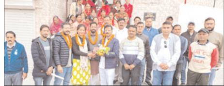
शाह टाइम्स संवाददाता