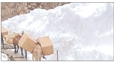
एक सप्ताह के भीतर मजदूरों ने मार्ग से हटाई बर्फ, निर्माण कार्य के साथ खाद्यान्न सामग्री का हो रहा ढुलान

शाह टाइम्स संवाददाता रुद्रप्रयाग। केदारनाथ धाम यात्रा को लेकर तैयारियां जोरों-शोरों पर चल रही हैं। पैदल मार्ग से बर्फ हटाने के बाद मालवाहक घोड़े-खच्चरों की आवाजाही शुरू हो गई है। पिछले एक सप्ताह से डीडीएमए के मजदूर लगातार मार्ग को सुचारु बनाने में जुटे हुए थे। डीडीएमए के मजदूरों ने बीते दिनों छोटी लिनचोली के पास बर्फ हटाने का कार्य शुरू किया था। कुवेर और भैरव ग्लेशियर क्षेत्रों में भारी बर्फ के कारण रास्ता बनाने में सबसे अधिक कठिनाई का सामना करना पड़ा। मजदूरों ने कड़ी मेहनत करते हुए इन स्थानों पर बर्फ काटकर मार्ग तैयार किया। रुद्रा पॉइंट और बेस कैम्प क्षेत्र में जैसीभी मशीनों की मदद से बर्फ हटाई गई, जिससे कार्य में तेजी आई। डीडीएमए ने मजदूरों को अलग-अलग टीमों में विभाजित कर विभिन्न स्थानों पर मार्ग निर्माण का कार्य कराया। शनिवार तीन अप्रैल से निर्माण सामग्री लेकर मालवाहक