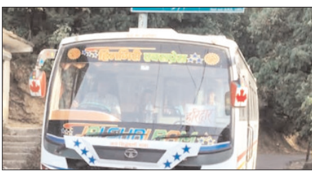
आपदा के 7 माह बाद बहाल हुई बस सेवा, क्षेत्र में खुशी की लहर

शाह टाइम्स संवाददाता रुद्रप्रयाग। बसुकेदार तहसील के अंतर्गत छेनागाड क्षेत्र में आई भीषण आपदा के सात महीने बाद आखिरकार यातायात व्यवस्था पटरी पर लौटने लगी है। हरिद्वार से बसुकेदार-छेनागाड मोटर मार्ग पर हिमगिरि बस सेवा पुनः शुरू हो गई है, जिससे स्थानीय लोगों में खुशी का माहौल है। गत 28 अगस्त 2025 को छेनागाड क्षेत्र में आई विनाशकारी आपदा के बाद से इस मार्ग पर बस सेवाएं पूरी तरह टप हो गई थीं। हरिद्वार से चलने वाली हिमगिरि और देहरादून से संचालित विश्वनाथ सेवा बंद होने से लोगों को भारी दिक्कतों का सामना करना पड़ रहा था। पुनः शुरू हुई बस सेवा के तहत हिमगिरि बस सुबह 5 बजे हरिद्वार से रवाना होकर दोपहर 2 बजे अगस्त्यगिरि पहुंची और शाम 5 बजे छेनागाड से करीब एक किलोमीटर पहले पाट्यूं बजार तक पहुंची। इससे क्षेत्र के लोगों को आवागमन में बड़ी राहत मिली है। स्थानीय समस्याओं को लेकर बोते