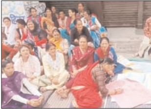
साँपा गया, चौथे दिन भी धरना प्रदर्शन जारी रहा और प्रशासन के खिलाफ नाराजगी खुलकर सामने आई और चक्का जाम भी किया। उसके बाद भी कोई आश्वासन नहीं मिलने पर अब पांचवें दिन भी ग्रामीण अपने रुख पर अडिग हैं और लगातार

शाह टाइम्स संवाददाता नैनीताल। नैनीताल के समीपवर्ती मंगोलो क्षेत्र में प्रस्तावित शराब की दुकान के खिलाफ ग्रामीणों का आंदोलन धमके का नाम नहीं ले रहा है। वीरवार को लगातार पांचवें दिन भी महिलाओं और स्थानीय लोगों ने एकजुट होकर विरोध प्रदर्शन जारी रखा और दुकान खोलने के फैसले को निरस्त करने की मांग उठाई। बता दें आंदोलन की शुरुआत पहले दिन मंगोलो में प्रदर्शन के साथ हुई थी जहां ग्रामीणों ने सड़क पर उतरकर विरोध जताया। दूसरे दिन भी महिलाओं ने जोरदार प्रदर्शन करते हुए प्रशाशा नहीं- पाटशाला चाहिए जैसे नारे लगाए वहीं तीसरे दिन आंदोलन और तेज हो गया और महिलाएं बज्जट क्षेत्र में धरने पर बैठ गईं तथा कुमाऊं आयुक्त को ज्ञापन