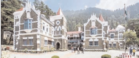
उनके प्रत्यावेदन पर 8 सप्ताह के भीतर विधि अनुसार निर्णय लें। मामले को सुनवाई के बाद ने उनकी याचिकाओं को अंतिम रूप से निस्तारित कर दी गयी है।

शाह टाइम्स संवाददाता नैनीताल। उत्तराखंड हाईकोर्ट ने वर्षों से प्राथमिक विद्यालयों में शिक्षण का कार्य कर रहे शिक्षा मित्रों को नियमित करने को लेकर दायर याचिकाओं पर सुनवाई की।