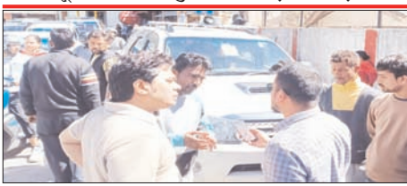
अपना वाहन क्लर कर लिया। लेकिन वाहन संदिग्ध देखते हुए एसडीएम ने वाहन को रुकवाया और चालक से पूछताछ की। इस दौरान विधायक पुत्र ने गलती स्वीकार करने के बजाय एसडीएम से बहस शुरू कर दी। साथ ही यूपी के सीएम व अन्य अधिकारियों से बात करने की

धमकी देने लगा। जिस पर एसडीएम ने पुलिस को कार्रवाई के निर्देश दिए। इस दौरान पर्यटक की अभावता पर स्थानीय लोग एसडीएम की ओर से हूटर होकर पर्यटक को फटक लगाने लगे। कुछ समय के लिए सड़क पर तनाव की स्थिति बन गई। मौके पर पहुंची