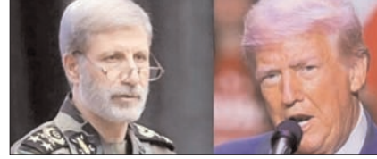
अमेरिका ने जमीनी हमला किया, तो कोई जिंदा नहीं बचेगा: ईरान