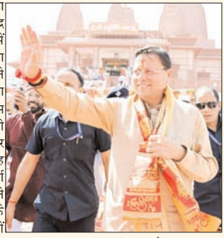
जहां समान नागरिक संहिता लागू की गई है, जो पूरे देश के लिए एक उदाहरण है।

मुख्यमंत्री ने कहा कि प्रधानमंत्री नरेंद्र मोदी के मार्गदर्शन में उत्तराखंड को देश का सर्वश्रेष्ठ राज्य बनाने का संकल्प लिया गया है। उन्होंने विश्वास व्यक्त किया कि सभी के सहयोग और आशीर्वाद से यह संकल्प अवश्य पूर्ण होगा। मुख्यमंत्री ने कहा कि राज्य के प्रमुख धार्मिक स्थलों केदारखंड और मानसखंड सहित अन्य स्थलों के सौंदर्यीकरण एवं आधाभूत संरचना विकास के कार्य लगातार जारी हैं। इन प्रयासों के परिणामस्वरूप राज्य में हर वर्ष श्रद्धालुओं और तीर्थयात्रियों की संख्या में वृद्धि हो रही है। मुख्यमंत्री ने कहा कि आगामी कुंभ केवल उत्तराखंड ही नहीं, बल्कि पूरे देश की आस्था का विषय है, वर्ष 2027 में प्रस्तावित कुंभ मेले की तैयारियां अभी से प्रारंभ कर दी गई हैं।