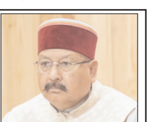
शहर के भीतर लगने वाले जाम से यात्रियों को मिलेगी निजात

शाह टाइम्स प्रमुख संवाददाता देहरादून। उत्तराखंड में ट्रेफिक जाम को कम करने और चारधाम यात्रा को सुगम बनाने के लिए केन्द्र सरकार की ओर से ऋषिकेश बाईपास के 4-लेन निर्माण के लिए 1105.79 करोड़ की मंजूरी दिये जाने पर प्रदेश के पर्यटन धर्मस्व, संस्कृति, लोक निर्माण मंत्री सतपाल महाराज ने प्रधानमंत्री नरेंद्र मोदी, केंद्रीय सड़क परिवहन एवं राजमार्ग मंत्री नितिन गडकरी, मुख्यमंत्री पुष्कर धामी और सड़क परिवहन एवं राजमार्ग राज्य मंत्री अजय टट्टा का आभार जताया है। महाराज ने कहा कि 12.67 किमी लंबा यह नया एनएच-7 बाईपास नेपाली फार्म (तीनपानी) के पास से शुरू होकर खारास्रोत