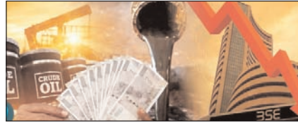
सुधार या बोझ? आम आदमी की जेब पर लगातार पड़ता भार