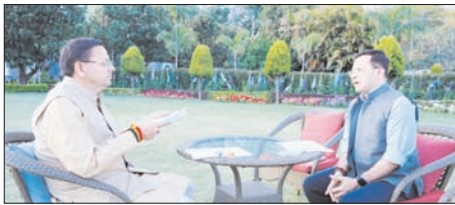
देश के चुनिंदा राज्यों में शामिल हुई उत्तराखंड की पुलिस सीएम पुष्कर धामी ने बताया ऐतिहासिक उपलब्धि