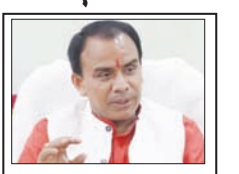
एमबी पीजी कॉलेज व कोटद्वार महाविद्यालय में लेब अपग्रेडेशन को 4 करोड़ जारी कहा, आईआईटी कानपुर की सहायता से उच्चिकृत की जाएंगी प्रयोगशालाएं

मुख्य संवाददाता शाह टाइम्स देहरादून। उच्च शिक्षा विभाग के अंतर्गत संचालित एमबी पीजी कॉलेज हल्द्वानी एवं कोटद्वार महाविद्यालय में स्थापित प्रयोगशालाओं को हाईटेक बनाया जायेगा। दोनों महाविद्यालयों की प्रयोगशालाओं के उच्चिकरण को 4 करोड़ की धनराशि जारी कर दी गई है। इन दोनों महाविद्यालयों में विज्ञान प्रयोगशालाओं को आईआईटी कानपुर के सहयोग से उच्चिकृत किया जायेगा, ताकि वहां अध्ययनरत छात्र-छात्राओं को आधुनिक उपकरणों के जरिये प्रयोगात्मक एवं शोधात्मक प्रशिक्षण मिल सके।