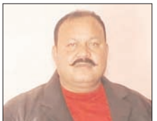
हरदा के सम्मान में इस्तीफे की पेशकश 'अर्जित अवकाश' लेने की बात कही। इस बयान को लेकर पार्टी के भीतर कई तरह की अटकलें शुरू हो गईं, इसे कहीं धकान, तो कहीं नेतृत्व से नाराजगी के संकेत के तौर पर देखा गया। करीब एक दशक से सत्ता से बाहर कांग्रेस के लिए यह अंदरूनी कलह चिंता का विषय बनती जा रही है। एक तरफ पार्टी वापसी की तैयारी में जुटी है, वहीं दूसरी ओर वरिष्ठ नेताओं के बीच खेमेबाजी खुलकर सामने आ रही है। इस बीच प्रदेश प्रभारी उत्तराखण्ड के दौर पर आ रही हैं। अब देखना होगा कि