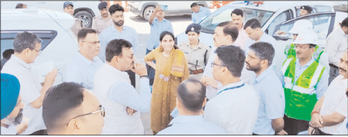
सभी कार्यों को तय समय में पूर्ण करने के निर्देश, गुणवत्ता पर विशेष जोर ग्रीन घाट एवं सौंदर्यीकरण पर विशेष फोकस, साप्ताहिक समीक्षा के आदेश