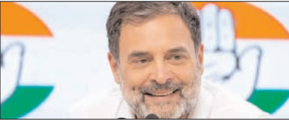
सैनिकों को मिले सम्मान जिसके हैं वे हकदार: राहुल गांधी

नई दिल्ली, मुजफ्फरनगर, देहरादून, हल्द्वानी, मुतादाबाद, बरेली, मेरठ व लखनऊ से प्रकाशित