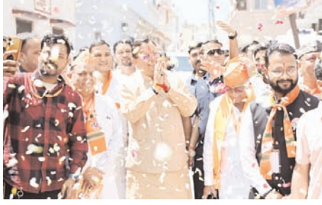
चारधाम यात्रा को और सशक्त बनाने पर दिया जा रहा है ध्यान रामनगर के छोई स्थित श्री हनुमान धाम में पूजा-अर्चना कर प्रदेश की खुशहाली की कामना

शाह टाइम्स ब्यूरो रामनगर/ नैनीताल। मुख्यमंत्री पुष्कर सिंह धामी ने गुरुवार को रामनगर के छोई स्थित श्री हनुमान धाम में पूजा-अर्चना कर प्रदेश की खुशहाली की कामना की। इस अवसर पर मुख्यमंत्री ने सभी जनप्रतिनिधियों, पदाधिकारियों एवं श्रद्धालुओं का स्वागत करते हुए कहा कि यहां उपस्थित प्रत्येक श्रद्धालु पर बजरंग, बली की विशेष कृपा है, क्योंकि उनकी इच्छा के बिना कोई भी उनके दरबार तक नहीं पहुंच सकता।