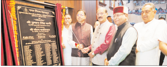
■ सीएम ने जुगमन्दर हॉल के नवीनीकरण कार्य का किया लोकार्पण, देहरादून में पार्कों के विकास कार्यों का शिलान्यास ■ "विकास भी, विरासत भी" के संकल्प के साथ आगे बढ़ रही राज्य सरकार ■ 1400 करोड़ से अधिक की विकास परियोजनाओं पर तेजी से काम

शाह टाइम्स ब्यूरो देहरादून। मुख्यमंत्री पुष्कर सिंह धामी ने शुक्रवार को नगर निगम देहरादून में निगम द्वारा आयोजित कार्यक्रम में सांस्कृतिक धरोहर के संरक्षण एवं संवर्धन के अंतर्गत 02 करोड़ 32 लाख 50 हजार रुपये की लागत से जुगमन्दर हॉल के जीर्णोद्धार एवं नवीनीकरण कार्य का लोकार्पण किया। इस अवसर पर उन्होंने केंदरपुरम स्थित ए.बी.सी. सेंटर में कैनालों के निर्माण एवं नगर निगम क्षेत्रांतरगत 06 स्थानों पर पार्कों के विकास एवं सौंदर्यीकरण कार्यों का शिलान्यास भी किया।