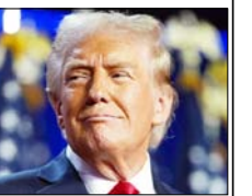
कहा: अगर उनकी शर्तें नहीं मानी तो वह उनके नागरिक बुनियादी ढांचे-जैसे पुलों और विद्युत पावर प्लांट्स को निशाना बनाकर नष्ट कर देंगे

वाशिंगटन। अमेरिका के राष्ट्रपति डोनाल्ड ट्रम्प ने शुक्रवार को ईरान को चेतावनी दी है कि वह ईरान के और भी पुलों और बिजलीघरों को तबाह कर देंगे। उन्होंने ईरान से कहा है कि जो 'किया जाना चाहिए', उसे 'तेजी' से करे। अमेरिका के राष्ट्रपति डोनाल्ड ट्रम्प ने ईरान को चेतावनी दी है कि अगर उनकी शर्तें नहीं मानी तो वह उनके नागरिक बुनियादी ढांचे-जैसे पुलों और विद्युत पावर प्लांट्स को निशाना बनाकर तबाह कर देंगे। ट्रम्प ने सोशल मीडिया पर लिखा कि अमेरिकी सेना ने 'ईरान में अभी तक नष्ट करने की प्रक्रिया भी शुरू नहीं की है' और कहा 'पहले पुल, फिर पावर प्लांट्स' को लक्ष्य बनाया जाएगा। उन्होंने लिखा कि अगला नंबर पुलों का है, फिर बिजलीघरों का। ईरान के नए शासन को पता है कि क्या