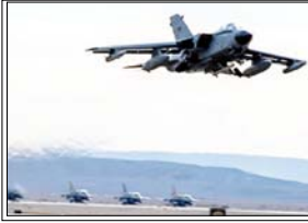
ऑस्ट्रिया ने पूरी तरह से अमेरिकी उड़ानों पर प्रतिबंध नहीं लगाया है, बल्कि हर अनुरोध की समीक्षा तथ्यों के आधार पर की जा रही है।

वियना। यूरोप के कई देशों ने अमेरिका के सैन्य अभियानों से दूरी बनानी शुरू कर दी है। इसमें सबसे नया नाम ऑस्ट्रिया का जुड़ गया है। जिसने ईरान से जुड़े सैन्य ऑपरेशनों के लिए अपने एयरस्पेस के इस्तेमाल की अमेरिकी मांग टुकरा दी है। ऑस्ट्रिया के रक्षा मंत्रालय के अनुसार, यह फैसला देश के सख्त तटस्थता कानून के तहत लिया गया है। मंत्रालय के प्रवक्ता के हवाले से ब्राडकास्टर ओआरएफ ने पुष्टि की कि वाशिंगटन की ओर से कई अनुरोध आए थे, लेकिन हर मामले को विदेश मंत्रालय के साथ मिलकर अलग-अलग आधार पर परखा जाएगा। हालांकि, ऑस्ट्रिया ने पूरी तरह से अमेरिकी उड़ानों पर प्रतिबंध नहीं लगाया है, बल्कि हर अनुरोध की समीक्षा तथ्यों के आधार पर की जा रही है। यूरॉप में यह रुख अकेला नहीं है। स्पेन, जो इस युद्ध का खुलकर विरोध कर रहा है, पहले ही अपने एयरस्पेस को संघर्ष में शामिल अमेरिकी सैन्य विमानों के लिए बंद कर चुका है। वहीं इटली ने भी पिछले हफ्ते सिसिली स्थित अपने सैन्य