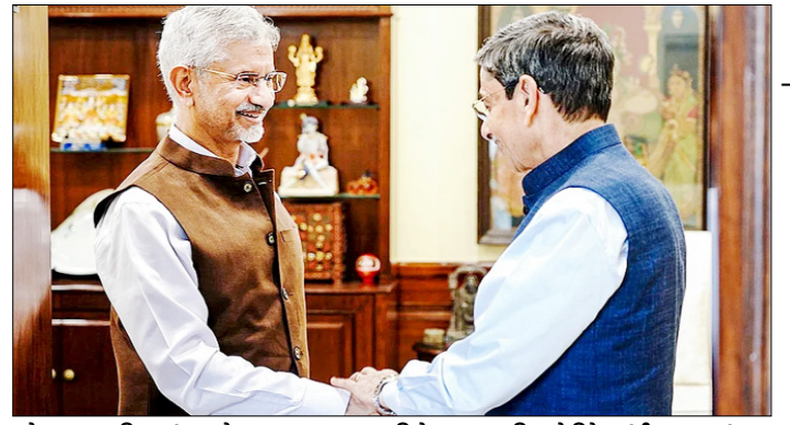
कोलकाता। पश्चिम बंगाल के राज्यपाल आरएन एच के साथ हाथ मिलाते विदेश मंत्री एस जयशंकर।

अड्डे के इस्तेमाल की अनुमति अमेरिकी बमवर्षक विमानों को देने से इन्कार कर दिया था। यूरोपीय देशों के इन्कार से अमेरिकी राष्ट्रपति डोनाल्ड ट्रम्प भी काफी खफा हैं। वो टुध के अलावा विभिन्न प्लेटफॉर्म पर खुलकर विरोध जता चुके हैं। कई मीडिया साक्षात्कार में खुले तौर पर नाटो और यूरोपीय देशों के खिलाफ राय जाहिर कर चुके हैं। लगभग हर दूसरे दिन वो टुध पर मदद न करने का तंज कसते हुए कह देते हैं कि अमेरिका याद रखेगा। जिस होर्मुज स्ट्रेट पर कब्जे का वो दावा करते थे अब उसे लेकर भी उन्होंने रुचि नहीं दिखाई है। राष्ट्र के नाम अपने संबोधन में कहा कि अब उसकी जिम्मेदारी वो उठाए, जिन्हें वहां से अपना सामान ले जाना है। हाल ही में डेली टेलीग्राफ को दिए एक साक्षात्कार में ट्रम्प ने ईरान-इजरायल संघर्ष के दौरान नाटो सहयोगियों, खासकर ब्रिटेन और फ्रांस की ओर से सैन्य मदद न देने पर नाराजी जताई। ट्रम्प ने नाटो को कागजी शेर करार दिया और अमेरिका के गठबंधन से बाहर निकलने की धमकी दी।