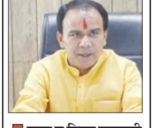
■ राज्य व जिला सहकारी बैंकों की 290 शाखाओं ने कमाया मुनाफा

मुख्य संवाददाता शाह टाइम्स देहरादून। सूबे के राज्य सहकारी बैंकों एवं जिला सहकारी बैंकों की 290 शाखाओं ने वित्तीय वर्ष 2025-26 में उल्लेखनीय प्रदर्शन कर अपनी वित्तीय मजबूत कर 269.72 करोड़ का लाभ अर्जित किया है। एनपीए नियंत्रण के मोर्चे पर भी बैंकों ने सख्त वित्तीय अनुशासन दिखाते हुये 39.88 करोड़ का एनपीए कम किया है, जोकि विगत वित्तीय वर्ष की तुलना में 6 फीसदी से अधिक कम हुआ है।