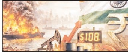
ईरान-अमेरिका युद्ध से दुनिया में लगा महंगाई का तड़का