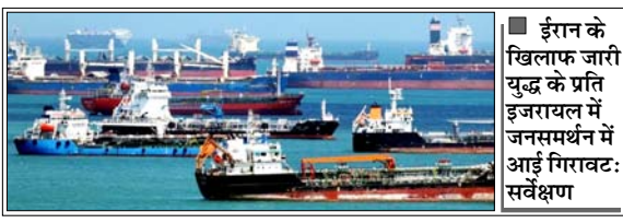
ईरान के खिलाफ जारी युद्ध के प्रति इजरायल में जनसमर्थन में आई गिरावट: सर्वेक्षण