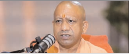
उत्तर प्रदेश पुलिस में जल्द पूरी होगी 81 हजार पदों पर भर्ती: योगी

नई दिल्ली, मुजफ्फरनगर, देहरादून, हल्द्वानी, मुतादाबाद, बरेली, मेरठ व लखनऊ से प्रकाशित