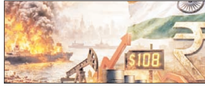
ईरान-अमेरिका युद्ध से दुनिया में लगा महंगाई का तड़का