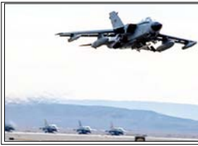
आस्ट्रिया ने पूरी तरह से अमेरिकी उड़ानों पर प्रतिबंध नहीं लगाया है, बल्कि हर अनुरोध की समीक्षा तथ्यों के आधार पर की जा रही है।

वियना। यूरोप के कई देशों ने अमेरिका के सैन्य अभियानों से दूरी बनानी शुरू कर दी है। इसमें सबसे नया नाम ऑस्ट्रिया का जुड़ गया है। जिसने ईरान से जुड़े सैन्य ऑपरेशनों के लिए अपने एयरस्पेस के इस्तेमाल की अमेरिकी मांग टुकरा दी है। ऑस्ट्रिया के रक्षा मंत्रालय के अनुसार, यह फैसला देश के सख्त तटस्थता कानून के तहत लिया गया है। मंत्रालय के प्रवक्ता के हवाले से ब्राडकास्टर ओआरएफ ने पुष्टि की कि वाशिंगटन की ओर से कई अनुरोध आए थे, लेकिन हर मामले को विदेश मंत्रालय के साथ मिलकर अलग-अलग आधार पर परखा जाएगा। हालांकि, ऑस्ट्रिया ने पूरी तरह से अमेरिकी उड़ानों पर प्रतिबंध नहीं लगाया है, बल्कि हर अनुरोध की समीक्षा तथ्यों के आधार पर की जा रही है। यूरॉप में यह रुख अकेला नहीं है। स्पेन, जो इस युद्ध का खुलकर विरोध कर रहा है, पहले ही अपने एयरस्पेस को संघर्ष में शामिल अमेरिकी सैन्य विमानों के लिए बंद कर चुका है। वहीं इटली ने भी पिछले हफ्ते सिसिली स्थित अपने सैन्य