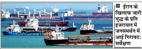
ईरान के खिलाफ जारी युद्ध के प्रति इजरायल में जनसमर्थन में आई गिरावट: सर्वेक्षण