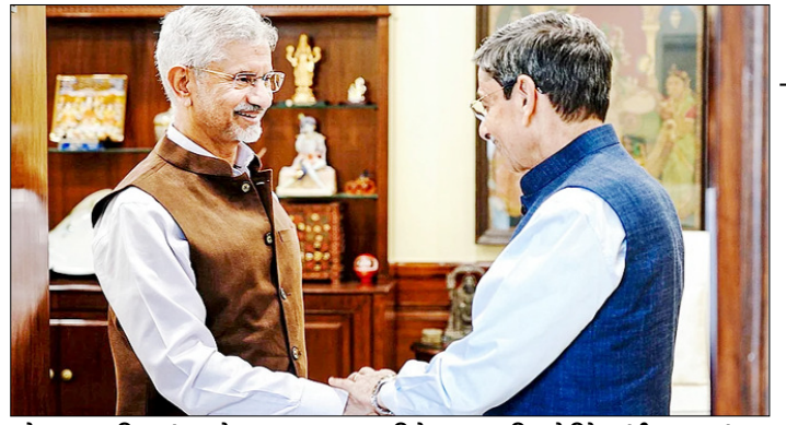
कोलकाता। पश्चिम बंगाल के राज्यपाल आरएन एवि के साथ हाय मिलाते विदेश मंत्री एस जयशंकर।

अड्डे के इस्तेमाल की अनुमति अमेरिकी बमवर्षक विमानों को देने से इन्कार कर दिया था। यूरोपीय देशों के इन्कार से अमेरिकी राष्ट्रपति डोनाल्ड ट्रम्प भी काफी खफा हैं। वो टुथ के अलावा विभिन्न प्लेटफॉर्म पर खुलकर विरोध जता चुके हैं। कई मीडिया साक्षात्कार में खुले तौर पर नाटो और यूरोपीय देशों के खिलाफ राय जाहिर कर चुके हैं। लगभग हर दूसरे दिन वो टुथ पर मदद न करने का तंज कसते हुए कह देते हैं कि अमेरिका याद रखेगा। जिस होर्मुज स्ट्रेट पर कब्जे का वो दावा करते थे अब उसे लेकर भी उन्होंने रुचि नहीं दिखाई है। राष्ट्र के नाम अपने संबोधन में कहा कि अब उसकी जिम्मेदारी वो उठाए, जिन्हें वहां से अपना सामान ले जाना है। हाल ही में डेली टेलीग्राफ को दिए एक साक्षात्कार में ट्रम्प ने ईरान-इजरायल संघर्ष के दौरान नाटो सहयोगियों, खासकर ब्रिटेन और फ्रांस की ओर से सैन्य मदद न देने पर नाराजी जताई। ट्रम्प ने नाटो को कागजी शेर करार दिया और अमेरिका के गठबंधन से बाहर निकलने की धमकी दी।