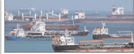
होर्मुज स्ट्रेट में ईरान-ओमान के साथ मिलकर करेगा खेल