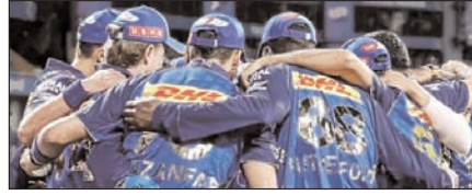
मुंबई के खिलाफ दिल्ली का लक्ष्य इतिहास बदलना