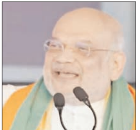
उज्ज्वल भविष्य को पक्का करने के लिए है। सालों से केरल के लोग यूडीएफ और एलडीएफ को बारी-बारी से चुनते रहे हैं, लेकिन दोनों ही पार्टियां भ्रष्टाचार में शामिल रही हैं। अगर आप सच्चा विकास चाहते हैं, तो आपको पीएम मोदी के नेतृत्व में एनडीए सरकार चुननी चाहिए। उन्होंने कहा कि बीजेपी की पॉलिसी बिल्कुल साफ है। सबको जगहों पर एक-दूसरे का साथ देना है, वहीं केरलम में वे पॉलिटिकल ड्रुम हैं।

कुन्नाथुनाडु, वार्ता केंद्रीय गृह मंत्री अमित शाह ने कुन्नाथुनाडु में एक जनसभा को संबोधित करते हुए कहा कि भारत में सबसे पहले कोई राज्य पढ़ा-लिखा बना, तो वह केरलम था। यहां के युवा शिक्षित और बुद्धिमान हैं, परंतु उनके पास नौकरियां नहीं हैं। हम ऐसे केरलम की रचना करना चाहते हैं, जिससे केरलम के युवाओं को यहीं नौकरियां मिलें और अन्य खाड़ी देशों में जाने की आवश्यकता न हो। अब पूरी दुनिया में परिवर्तन आ रहा है।