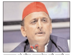
सरकार के बीच तालमेल की कमी या मिलीभगत के कारण आम उपभोक्ताओं की समस्याओं का समाधान समय पर नहीं हो पा रहा है। इसके चलते लोग बार-बार शिकायत करने और कार्यालयों के चक्कर लगाने को मजबूर हैं। सपा अध्यक्ष ने कहा कि भाजपा सरकार में जनता 'उपभोक्ता' से 'उपभूता' बन गई है, जिसे नीतियों की खामियों का खामियाजा भुगतान पड़ रहा है। उन्होंने 'पीडीए' का जिक्र करते हुए कहा कि प्रभावित लोगों की संख्या लगातार बढ़ रही है और अब 'प्रीपेड पीड़ित' भी इसमें शामिल हो गए हैं।

शाह टाइम्स ब्यूरो लखनऊ। स्मार्ट प्रीपेड बिजली मीटर के एकाउंट में पैसे होने के बावजूद बत्ती गुल होने को लेकर समाजवादी पार्टी के राष्ट्रीय अध्यक्ष अखिलेश यादव ने भाजपा सरकार पर तीखा हमला बोला है। उन्होंने कहा कि सरकार की नीतियों के कारण उत्तर प्रदेश में 'प्रीपेड पीड़ित' नाम की एक नई श्रेणी पैदा हो गई है। रविवार को सोशल मीडिया के जरिए अखिलेश यादव ने कहा कि जिन उपभोक्ताओं ने पहले से ही बिजली के लिए भुगतान कर दिया है, वे भी स्मार्ट मीटर की खामियों के चलते बिजली कटौती और तकनीकी समस्याओं से जूझ रहे हैं। उन्होंने सवाल उठाया कि जब बिजली कंपनियों को पहले ही पैसा मिल जाता है, तो फिर आम जनता को परेशान क्यों किया जा रहा है। उन्होंने आरोप लगाया कि बिजली कंपनियों और