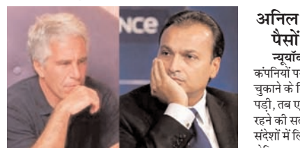
नियुक्ति-विदेश नीति से जुड़ी जानकारी साझा की, जो बाद में सही निकली

अमेरिका के यौन अपराधी जेफ्री एपस्टीन ने 2017 में उद्योगपति अनिल अंबानी के सामने खुद को डोनाल्ड ट्रम्प के पहले कार्यकाल के व्हाइट हाउस के 'इन्साइडर' की तरह पेश किया था। न्यूयॉर्क टाइम्स की रिपोर्ट के मुताबिक दोनों के बीच दो साल तक सैकड़ों मैसेज और ईमेल हुए। इनमें एपस्टीन ने ट्रम्प प्रशासन की नियुक्ति व विदेश नीति से जुड़ी जानकारी साझा की, जो बाद में सही भी निकलीं। हालांकि, इस बात का कोई सबूत नहीं मिला कि एपस्टीन को व्हाइट हाउस तक सीधी पहुंच थी। मैसेज में अनिल अंबानी ने एपस्टीन को लिखा था कि 'भारत के रिश्ते और रक्षा सहयोग के लिए व्हाइट हाउस से डील करने में आपकी गाइडेंस चाहिए।' जवाब में एपस्टीन ने 'इन्साइडर' जानकारी देने का दावा किया। न्यूयॉर्क टाइम्स ने जस्टिस डिपार्टमेंट की तरफ से जारी मैसेज के रोकथाम के आधार पर बताया कि अनिल अंबानी और एपस्टीन के बीच बातचीत सिग्नल और टेलीग्राम जैसे एन्क्रिप्टेड प्लेटफॉर्म पर होती थी, जहां अंबानी 'अरमाना ए' नाम से सक्रिय थे। यह संपर्क उस दौर का है, जब एपस्टीन नाबालिगों से जुड़े अपराधों में जेल की सजा काट चुका था। इनका