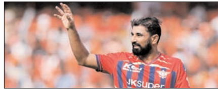
मोहम्मद शमी की आंधी में उड़ी हैदराबाद टीम