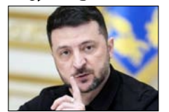
संघर्ष लंबा खिंचता है, तो इससे यूक्रेन के प्रति अमेरिका का समर्थन और कमजोर हो सकता है: जेलेन्स्की

इस्तांबुल। पश्चिम एशिया संकट का असर वैश्विक तौर पर दिख रहा है और पूरी दुनिया में इसे लेकर चिंता का माहौल है। हालांकि यूक्रेन के राष्ट्रपति वोलोदिमिर जेलेन्स्की इस युद्ध से ख़ास तौर पर तनावग्रस्त हैं। जेलेन्स्की ने आशंका जताई है कि अगर अमेरिका-इजरायल और ईरान के बीच संघर्ष लंबा खिंचता है, तो इससे यूक्रेन के प्रति अमेरिका का समर्थन और कमजोर हो सकता है। उन्होंने कहा कि वाशिंगटन की प्राथमिकताओं में बदलाव के चलते यूक्रेन को बेहद जरूरी पैट्रियट एयर डिफेंस मिसाइलें, तो इससे यूक्रेन में कमी का सामना करना पड़ सकता है। इस्तांबुल में 'द एसोसिएटेड प्रेस' को दिए एक इंटरव्यू में जेलेन्स्की ने कहा कि रूस के रोजाना हमलों का सामना करने के लिए यूक्रेन को अमेरिका में बने पैट्रियट एयर डिफेंस सिस्टम की