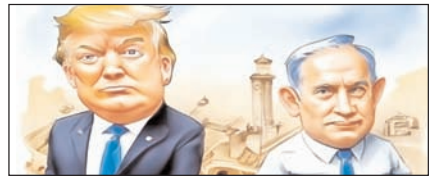
युद्ध अपराधी हैं डोनाल्ड ट्रम्प और नेतन्याहू