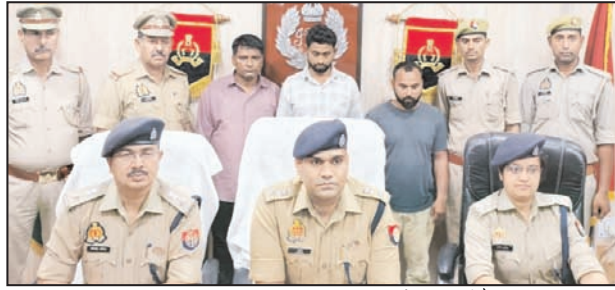
शाह टाइम्स संवाददाता

मंडी धनीरा। पुलिस ने ई-रिक्शा चोरी की वारदातों का खुलासा करते हुए अंतरजनपदीय गैंग के तीन शांति बदमाशों को गिरफ्तार कर बड़ी सफलता हासिल की है। पुलिस ने आरोपियों के कब्जे से चोरी की तीन ई-रिक्शा, वारदात में इस्तेमाल की गई एक ईको कार, 12 बैटरियां और ई-रिक्शा के कई स्टील फ्रेम बरामद किए हैं। बरामद माल की कीमत करीब