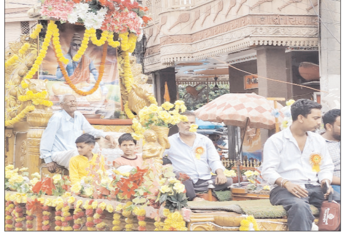
मुजफ्फरनगर: शहर में निकाली गई शोभायात्रा में आकर्षण का केंद्र रही झांकी।