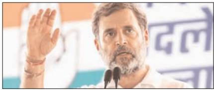
हिमंता बिस्वा सरमा सबसे भ्रष्ट मुख्यमंत्री: राहुल गांधी

नई दिल्ली, मुजफ्फरनगर, देहरादून, हल्द्वानी, मुतादाबाद, बरेली, मेरठ व लखनऊ से प्रकाशित