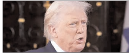
अमेरिकी पायलटों को ईरान से सुरक्षित निकाला: ट्रम्प