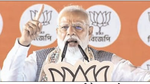
अब जनता बदलाव चाहती है, चुनाव के बाद भ्रष्टाचारियों के खिलाफ कार्रवाई होगी

नई दिल्ली। प्रधानमंत्री नरेंद्र मोदी ने रविवार को पश्चिम बंगाल के कुचबिहार में चुनावी सभा में कहा कि टीएमसी के पापों का घड़ा भर चुका है और अब जनता बदलाव चाहती है। चुनाव के बाद भ्रष्टाचारियों के खिलाफ सख्त कार्रवाई होगी, चुन-चुनकर हिसाब लिया जाएगा। पीएम मोदी ने कहा कि 1905 में मजहबों ताकतों ने बंगाल में लाल इश्तेहार जारी किया था। उसके बाद हिंदुओं का नरसंहार किया गया था।