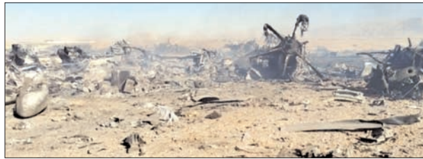
ईरान ने अमेरिकी विमानों को तबाह करने के सबूत देते हुए विमानों के मलबे की तस्वीरें और वीडियो जारी किए

ईरान और अमेरिका के बीच जारी युद्ध लगातार तेज होता दिख रहा है। ईरान की ओर से लगातार अमेरिका विमानों को मार गिराने का दावा किया जा रहा है। रविवार को ईरान की ओर से अमेरिका के विमानों को तबाह करने के सबूत जारी किए गए हैं। ईरानी न्यूज एजेंसी ने अमेरिका के विमानों के मलबे की तस्वीरें और वीडियो जारी किए हैं। ईरान का दावा है कि उसने इस्फहान इलाके में अमेरिकी सैन्य मिशन के दौरान दो ब्लैकहॉक हेलीकॉप्टर और दो सी-130 ट्रांसपोर्ट एयरक्राफ्ट को मार गिराया। ईरान की इस्लामिक