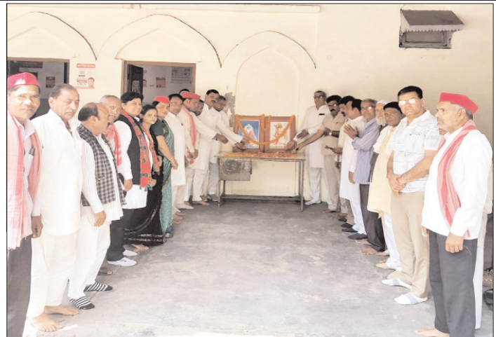
मुजफ्फरनगर: पार्टी कार्यालय पर महर्षि कश्यप व निषादराज को पुष्पांजलि अर्पित करते सपाईं।