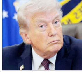
दावा: तेहरान में एक भीषण हमले में ईरान के कई शीर्ष सैन्य अधिकारियों को किया खत्म। पायलट ईरान के दुर्गम पहाड़ों में दुश्मन की सीमा के पीछे था: ट्रम्प

वाशिंगटन। अमेरिकी राष्ट्रपति डोनाल्ड ट्रम्प ने रविवार सुबह घोषणा की कि अमेरिका ने ईरानी क्षेत्र से उन दो लड़ाकू पायलटों को सुरक्षित निकाल लिया है, जो शनिवार को ईरानी सेना के हमले में दो अमेरिकी विमानों के गिराए जाने के बाद से लापता हो गए थे।