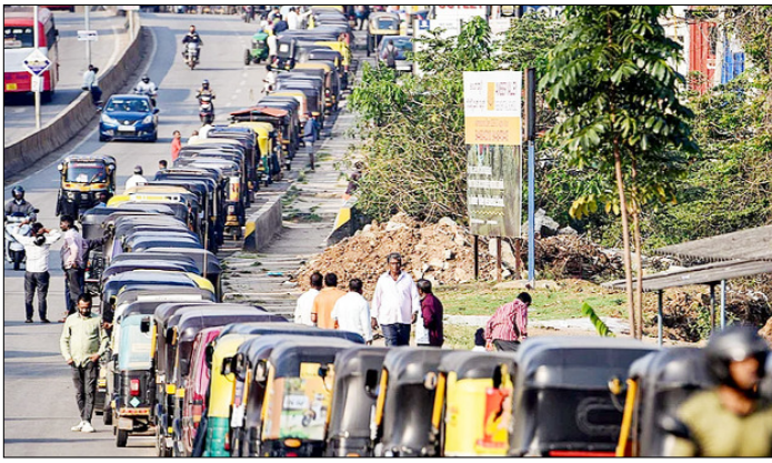
कर्नाटक। चित्तमंगलुरु में एलापीजी की आपूर्ति बाधित होने के कारण ऑटो-रिक्शा की लंबी कतारें।