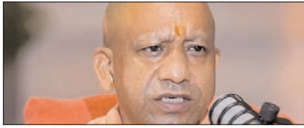
सत्ता नहीं, संस्कार की है भाजपा की विकास यात्रा: योगी

नई दिल्ली, मुजफ्फरनगर, देहरादून, हल्द्वानी, मुगदाबाद, बरेली, मेरठ व लखनऊ से प्रकाशित