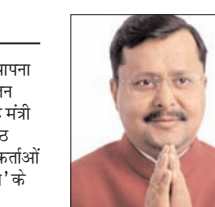
राजनीतिक पार्टी बनने तक का यह सफर कार्यकर्ताओं के त्याग और समर्पण का परिणाम है। प्रधानमंत्री मोदी ने सोशल मीडिया पर एक वीडियो और असम में एक चुनावी रैली के माध्यम से कार्यकर्ताओं को बधाई दी और राष्ट्र प्रथम का संदेश दिया। उन्होंने कहा कि भाजपा हमेशा 'राष्ट्र प्रथम'

श्री नवीन ने इस मौके पर भाजपा मुख्यालय पर कार्यकर्ताओं को संबोधित करते हुए 'राष्ट्र सर्वोपरि' के संकल्प को दोहराया और 'विकसित भारत' के लक्ष्य को प्राप्त करने के लिए एकजुट होकर काम करने का आह्वान किया। उन्होंने कहा कि जनसंघ से लेकर दुनिया की सबसे बड़ी