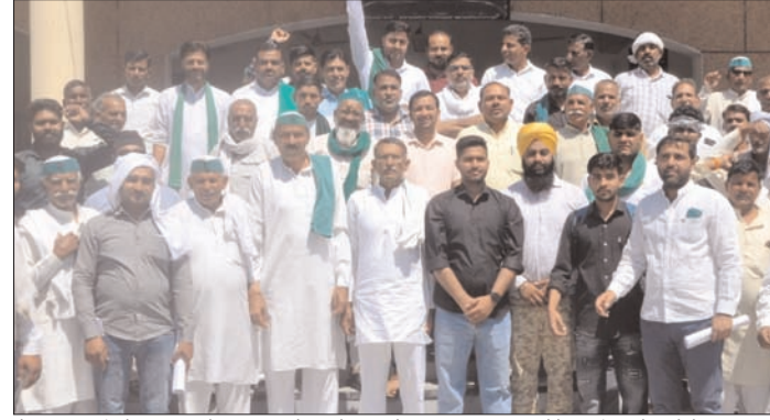
ड्रेस अनिवार्य हो, जबकि ड्रेस व किताबें एक ही दुकान से खरीदने की बाध्यता खत्म हो, सभी विद्यालयों द्वारा किताब एवं ड्रेस से संबंध स्पष्ट लिखित आदेश व सूची सार्वजनिक की जाए और जिला स्तर पर जांच