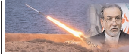
युद्ध कई साल चला, तो भी नहीं होगी मिसाइलों की कमी: ईरान