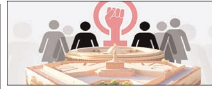
राजनीति का नया भूगोल लोकसभा विस्तार व नारी शक्ति का नया उदय सम्पादकीय