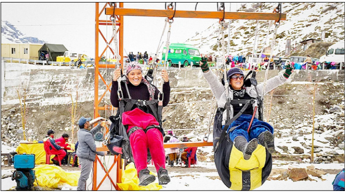
शिमला। लाहौल-स्पीति जिले के रोहतंग स्थित अटल सुरंग के उतरी प्रवेश द्वार पर बर्फ के बीच साहसिक गतिविधियों में भाग लेते पर्यटक।