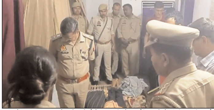
शाह टाइम्स संवाददाता मंडी धनीरा। थाना क्षेत्र के दो अलग-अलग गांवों में फंदा लगाकर आत्महत्या की दो घटनाओं से इलाके में सनसनी फैल गई। पहली घटना गांव आजमपुर की है, जहां

पहली घटना में गांव आजमपुर निवासी बारहवीं की छात्रा ने घर में बने कमरे में दुपट्टे के सहारे फंदा लगा लिया। काफी देर तक कमरे से बाहर न आने पर परिजनों ने अंदर जाकर देखा तो छात्रा का शव लटका मिला। यह दृश्य देखकर परिवार में कोहराम मच