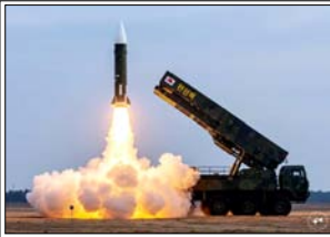
अमेरिका और इजरायल ने 28 फरवरी को ईरान में कई ठिकानों पर हमले किए, जिसमें तेहरान भी शामिल था