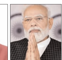
'विकसित भारत' के लक्ष्य को प्राप्त करने के लिए एकजुट होने की जरूरत: पीएम मोदी

के सिद्धांत पर चलते हुए समाज सेवा में अग्रणी रही है। उन्होंने पार्टी कार्यकर्ताओं को निरन्धर सेवा, समर्पण और सूरसासन के प्रति प्रतिबद्धता की सराहना करते हुए कहा कि कार्यकर्ताओं के अथक प्रयासों ने पार्टी को आज इस मुकाम तक पहुंचाया है। उन्होंने उन अनगिनत कार्यकर्ताओं को भी याद किया,