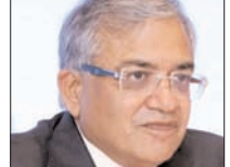
190 से अधिक सांसदों ने किए थे हस्ताक्षर इतिहास में पहली बार आया था सीईसी को हटाने का प्रस्ताव

टीएमसी के नेतृत्व में विपक्ष ने लोकसभा और राज्यसभा में नोटिस दिया था, लेकिन यह बजट सत्र में आगे नहीं बढ़ पाया। विपक्ष ने ज्ञानेश कुमार पर मतदाता सूची से नाम हटाने, चुनावी प्रक्रिया में पक्षपात और सरकारी तंत्र का दुरुपयोग करने का आरोप लगाया था। सीईसी को हटाने के लिए सर्वोच्च न्यायालय के न्यायाधीश के समान महाभियोग की कठिन प्रक्रिया (विशेष बहुमत) की आवश्यकता होती है, जो भारत में अब तक किसी सीईसी के