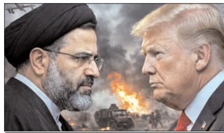
शामिल नहीं होगा। ईरानी विदेश मंत्रालय ने कहा कि अमेरिका का 15 सूत्रीय प्रस्ताव अत्यधिक मांगों वाला है। हमने अपनी मांगों का एक

इस बीच, ईरान ने सोमवार को कहा कि उसने मध्यस्थों की ओर से पेश किए गए प्रस्तावों पर अपना जवाब तैयार कर लिया है। हालांकि, उसने यह भी कहा कि जब तक अमेरिका व इजरायल हमले तेज करते रहेंगे, वह सीधी वार्ता में शामिल नहीं होगा।