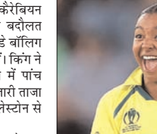
हासिल की और 3-0 से सीरीज अपने नाम कर ली। आईसीसी के अनुसार, उनके इस प्रदर्शन की बदौलत वह ऑलराउंडर रैंकिंग (281) में

दुबई, वार्ता। ऑस्ट्रेलिया के कैरेबियन दौरे के दौरान शानदार प्रदर्शन की बदौलत अलाना किंग आईसीसी महिला वनडे बॉलिंग रैंकिंग में फिर से टॉप पर पहुंच गई हैं। किंग ने सेंट क्रिस्टस में अपने आखिरी मैच में पांच विकेट लिए, जिससे मंगलवार को जारी ताजा रैंकिंग में वह इंग्लैंड की सोफी एक्लेस्टोन से आगे निकल गई।