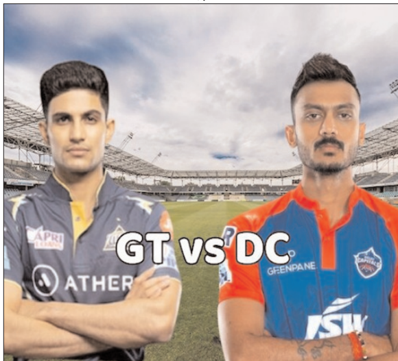
तो भी पावरप्ले के बाद उन्हें परेशान करने वाला कोई है। एनगिडी कर सकते हैं जीटी के शीर्ष क्रम को परेशान भारत में हुए टी-20 विश्व कप से ही लुगी एनगिडी

पिछले आईपीएल के दो मैचों में जीटी को दोनों में जीत मिली है, वहीं दिल्ली में भी दोनों टीमों के बीच खेले गए तीन मैचों में जीटी 2-1 से आगे है। राहुल को रहना होगा रबाडा और प्रसिद्ध से सावधान केल राहुल के लिए आईपीएल 2026 की शुरुआत कुछ खास नहीं रही है और दो मैचों में उनका स्कोर 0 और 1 का है। राहुल का यह खराब फॉर्म जीटी के खिलाफ मैच में भी जारी रह सकता है क्योंकि जीटी के तेज गेंदबाज प्रसिद्ध कृष्णा और कगिसो रबाडा उन्हें परेशान करते हैं। प्रसिद्ध अपने राज्य के साथी को सात पारियों में तीन जबकि रबाडा भी उन्हें 12 पारियों में तीन बार आउट कर चुके हैं। राशिद खान ने भी राहुल को तीन बार आउट किया है, जिसका मतलब है कि अगर राहुल टिक भी जाते हैं