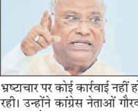
भ्रष्टाचार पर कोई कार्रवाई नहीं हो रही। उन्होंने कांग्रेस नेताओं गौरव गोंगई और पूर्व मुख्यमंत्री तरुण गांगई का जिक्र करते हुए कहा कि उनका रिकॉर्ड साफ रहा है और उन्होंने कभी इस तरह के आरोपों का सामना नहीं किया। श्री खड़गे ने असम के गायक जुबिन गर्ग से जुड़े मामले में न्याय में देरी का मुद्दा भी उठाया। उन्होंने कहा कि फास्ट ट्रैक कोर्ट बनाने में देरी हुई और सवाल उठाया कि आखिर मुख्यमंत्री किस बचाना चाहते हैं। कांग्रेस अध्यक्ष ने वादा किया कि यदि राज्य में कांग्रेस की सरकार बनती है, तो 100 दिनों के भीतर इस मामले में न्याय सुनिश्चित किया जाएगा और दक्षिणों को सजा दिलाई जाएगी।

नई दिल्ली। असम विधानसभा चुनाव मतदान से पहले कांग्रेस अध्यक्ष मल्लिकार्जुन खड़गे ने प्रेस वार्ता कर भारतीय जनता पार्टी सरकार पर निशाना साधा। श्री खड़गे ने राज्य की जनता से अपील की कि वे अपने वोट के जरिए प्खबसे भ्रष्ट सरकार को सत्ता से बाहर का रास्ता दिखाएं। उन्होंने आरोप लगाया कि हिमंता बिस्वा सरमा के नेतृत्व में असम में भ्रष्टाचार बढ़ा है और मुख्यमंत्री केवल अपने निजी हितों को साध रहे हैं। उन्होंने कहा कि कांग्रेस ने पंचमिडिकेट राज चल रहा है, जिसमें जमीन उनके करीबी लोगों और कॉर्पोरेट्स को सौंपी जा रही है। कांग्रेस अध्यक्ष ने प्रधानमंत्री नरेंद्र मोदी और गृहमंत्री अमित शाह पर भी सवाल उठाते हुए कहा कि एक तरफ भाजपा नेता भ्रष्टाचार को खिलाफ होने का दावा करते हैं, जबकि दूसरी ओर असम में कथित