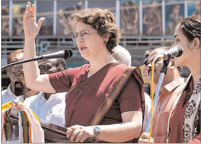
केरल विधानसभा चुनाव से पहले, वायनाड जिले के पदिनजरथारा में कांग्रेस महासचिव और वायनाड सांसद प्रियंका गांधी ने एक नुककड़ सभा को संबोधित किया।