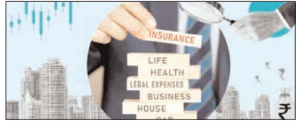
क्यों कम हुई हेल्थ इंश्योरेंस कंपनियों की विश्वसनीयता