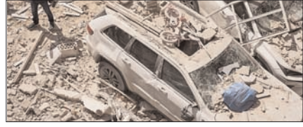
ईरान समर्थित समूहों का अमेरिकी ठिकानों पर झोन हमला