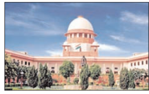
सुप्रीम कोर्ट में सबरीमाला मंदिर में महिलाओं के प्रवेश से जुड़े 2018 के फैसले की समीक्षा याचिकाओं पर अंतिम सुनवाई शुरू

मुख्य न्यायाधीश सूर्यकांत की अध्यक्षता में नौ न्यायाधीशों की पीठ इस मामले को सुनवाई कर रही है। पीठ में न्यायमूर्ति बीवी नारगला, एमएम सूद्रे, अहसानुद्दीन अमानुल्लाह, अरविंद