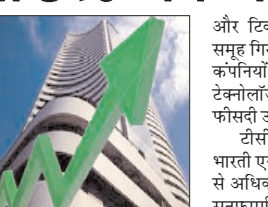
कंपनियों में बिकवाली हावी रही। निपटी मिडकैप 5.50 सूचकांक 0.43 प्रतिशत ऊपर बंद हुआ। वहीं, स्मॉलकैप-100 सूचकांक 0.06 प्रतिशत फिसल गया। आईटी कंपनियों में दोपहर बाद लिवाली तेज होने से बाजार को समर्थन मिला। धातु, रियल्टी, एफएमसीजी, निजी बैंकों और मीडिया कंपनियों के समूहों में भी तेजी रही। वहीं, सार्वजनिक बैंक

मुंबई, वार्ता घरेलू शेयर बाजारों में मंगलवार को लगातार चौथे दिन तेजी देखी गई और बीएसई का सेंसेक्स 509.73 अंक (0.69 प्रतिशत) चढ़कर 74,616.58 अंक पर बंद हुआ। नेशनल स्टॉक एक्सचेंज का निपटी-50 सूचकांक भी 155.40 अंक यानी 0.68 प्रतिशत की वृद्धि में 23,123.65 अंक पर पहुंच गया।