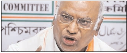
खड़गो का हिमंत पर हमला, लगाए क्षुब्धाचार के आरोप

नई दिल्ली, मुजफ्फरनगर, देहरादून, हल्द्वानी, मुगदाबाद, बरेली, मेरठ व लखनऊ से प्रकाशित