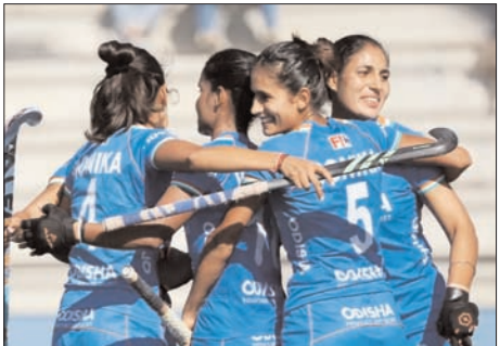
प्रदान करेगा। यह हॉकी इंडिया के रणनीतिक कैलेंडर के साथ पूरी तरह से मेल खाता है, जिसका उद्देश्य एफआईएच हॉकी विश्व कप बर्लिनजयम और नीदरलैंड्स 2026 और इस साल के अंत में होने वाले एशियाई खेलों के एकल अहम दौर में प्रवेश कर रही है। इस दौरे के बारे में बात करते हुए,

नई दिल्ली, वार्ता। भारतीय सौनियर महिला हॉकी टीम अप्रैल में अर्जेंटीना के दौरे पर जाने के लिए तैयार है। इस दौरे पर चार मैचों की एक सीरीज खेलेगी जाएगी, जो 13 से 17 अप्रैल तक ब्यूस आयर्स के सेनाई में आयोजित होगी।