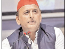
जब बीजेपी हारती है तो मिलती है ईसी से

लखनऊ। उत्तर प्रदेश में एसआईआर प्रक्रिया पूरी होने के साथ ही शुक्रवार को निर्वाचन आयोग द्वारा फाइनल वोटर लिस्ट जारी कर दिए जाने के बाद समा. जवादी पार्टी के राष्ट्रीय अध्यक्ष अखिलेश यादव ने तीखा हमला बोला है।