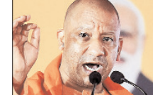
सरकार ने इलाज को 1400 करोड़ रुपये दिए

लखनऊ। उत्तर प्रदेश के मुख्यमंत्री योगी आदित्यनाथ ने अटल बिहारी वाजपेयी चिकित्सा विश्वविद्यालय में कार्डियोलॉजी सोसायटी ऑफ इंडिया द्वारा आयोजित 'नेशनल इंटरवेंशनल का उद्घाटन किया।