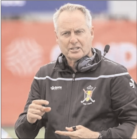
के बीच, वह बेल्जियम की राष्ट्रीय महिला टीम के कोचिंग स्टाफ का भी एक अहम हिस्सा था। इस दौरान टीम ने अपनी विश्व रैंकिंग में

उनका मुख्य लक्ष्य अंतर्राष्ट्रीय स्तर के सितारों की अगली पीढ़ी को तैयार करना है। भारत आने से पहले, व्हाइट बेल्जियम की अंडर-21 महिला टीम के कोच थे, और उन्होंने दिसम्बर में हुए 2025 जूनियर विश्व कप में टीम को कांस्य पदक दिलाने में अहम भूमिका निभाई थी। 2021 से 2024