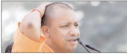
स्वास्थ्य सेवाओं में यूपी नेरचा नया इतिहास: योगी पेज 2

नई दिल्ली, मुजफ्फरनगर, देहरादून, हल्द्वानी, मुद्राबाद, बरेली, मेरठ व लखनऊ से प्रकाशित