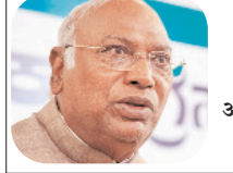
सरकार लंबी खामोशी के बाद अचानक सक्रिय हुई, 33 प्रतिशत आरक्षण को 16 से 18 तक हो रही संसद की बैठक

कांग्रेस अध्यक्ष मल्लिकार्जुन खड़गे ने महिला आरक्षण बिल पर मोदी सरकार की मंशा पर सवाल उठाए हैं। उन्होंने कहा कि सरकार 2029 से इसे लागू कर सीटों को 50 प्रतिशत बढ़ाना चाहती है, जिसका परिशीलन प्रस्ताव गंभीर होगा। खड़गे ने इसे चुनावी लाभ का प्रयास बताया।