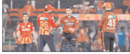
पंजाब किंग्स का लक्ष्य एसआरएच के खिलाफ अपनी लय को बनाए रखना खेल टाइम्स