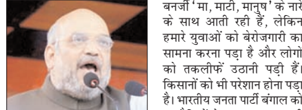
बेरोजगार युवकों को भी तीन हजार की मदद: गृहमंत्री

गृहमंत्री अमित शाह ने शुक्रवार को पश्चिम बंगाल के देवरा में जनसभा को संबोधित करते हुए कहा कि ममता बनर्जी बंगाल के लोगों की चिंता नहीं करती हैं। उन्हें बस भतीजे अभिषेक बनर्जी को अगला सीएम बनाने में दिलचस्पी है। भारतीय जनता पार्टी ने शुक्रवार को पश्चिम बंगाल के लिए पार्टी का घोषणा पत्र यानी 'भरोसे का पत्र' जारी किया। इसमें महिलाओं को 3 हजार महीना, युवा बेरोजगारों को 3 हजार महीना को मदद, पहले 6 महीने में यूसीसी लागू करना और सरकारी कर्मचारियों को 45 दिन में सातवां वेतनमान देने की घोषणा की गई। शाह ने पत्र जारी करते हुए कहा कि बंगाल की जनता के लिए पिछले 15 साल बुरे सपने के जैसे