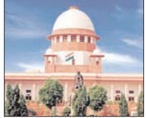
ऐसी अभद्र भाषा कहां से लाते हैं, सीजेआई ने याचिकाकर्ता को लगाई कड़ी फटकार

सुप्रीम कोर्ट में सीजेआई सुर्यकांत की अध्यक्षता वाली न्यायमूर्ति जायमाल्या बागची और न्यायमूर्ति विपुल पंचोली को पीठ ने इस याचिका को खारिज कर दिया। इस दौरान सीजेआई सुर्यकांत ने याचिकाकर्ता से कहा कि आप इस याचिका में इस्तेमाल की गई भाषा