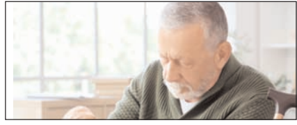
वृद्धावस्था का एक रोग जो बना चुनौती सम्पादकीय