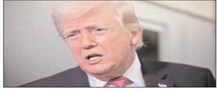
होर्मुज में ईरान के टैक्स लेने पर भड़के ट्रम्प, बोले- यह वह समझौता नहीं जो हमने किया पेज 12