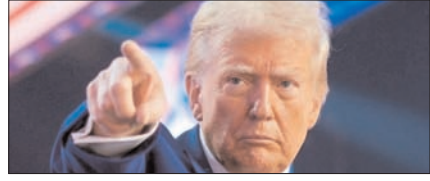
ईरान से वार्ता विफल होने पर भड़के ट्रम्प, ईरान को बताया जिम्मेदार