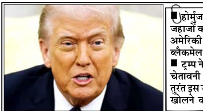
होर्मुज से पास होने वाले जहाजों की निगरानी करेगी अमेरिकी नौसेना, ईरान पर ब्लैकमेल करने का आरोप

वाशिंगटन। अमेरिका और ईरान के बीच तनाव एक बार फिर खतरनाक मोड़ पर पहुंच गया है। पाकिस्तान में हुई नाकाम शांति वार्ता के बाद अमेरिका के राष्ट्रपति डोनाल्ड ट्रम्प ने बेहद सख्त और तीखा बयान जारी किया है, जिसने वैश्विक राजनीति में हलचल मचा दी है। ट्रम्प ने आरोप लगाया कि ईरान ने होर्मुज जलडमरूमध्य खोलने का वादा किया था, लेकिन जानबूझकर उसे तोड़ा, जिससे दुनिया भर में आर्थिक अस्थिरता, डर और संकट की स्थिति पैदा हो गई है।