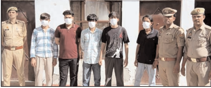
कहा कि सोशल मीडिया पर लो. कारप्रियात के लिए ऐसे खतरनाक स्टंट करना कानूनी अपराध है।

शाह टाइम्स संवाददाता ग्रेटर नोएडा। ग्रेटर नोएडा के दनकौर कोतवाली क्षेत्र में गलगाटिया यूनिवर्सिटी के पास कार की छत पर खतरनाक स्टंट करने का वीडियो वायरल हुआ था। इस मामले में पुलिस ने रविवार को पांच छात्रों को गिरफ्तार किया है। सभी आरोपियों को कोर्ट में पेश किया गया है।