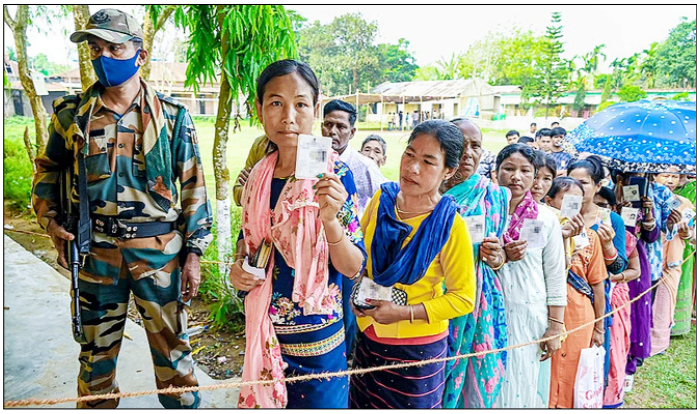
अगरतला। त्रिपुरा जनजातीय क्षेत्र स्वायत्त जिला परिषद (टीटीएएडीसी) चुनाव के दौरान मतदान केंद्र के बाहर अपना वोट डालने के लिए कतार में खड़े होकर अपने पहचान पत्र दिखाते मतदाता।