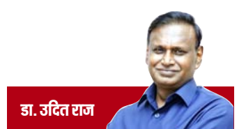
डा. उदित राज

भारतीय समाज में जाति एक जटिल और गहराई से जड़ जमाई हुई संरचना रही है, जिसे समाप्त करने का सबसे सशक्त और स्पष्ट आह्वान डॉ. भीमराव आम्बेडकर ने किया था। उन्होंने न केवल जाति-प्रथा की आलोचना की, बल्कि एक ऐसे समाज की कल्पना की जो समानता, स्वतंत्रता और बंधुत्व के सिद्धांतों पर आधारित हो। उनके विचारों का मूल उद्देश्य था, जाति का उन्मूलन। आज एक महत्वपूर्ण प्रश्न उठता है कि क्या स्वयं को आम्बेडकरवादी कहने वाले लोग इन मूल्यों को व्यवहार में उतार पा रहे हैं या कहीं वे भी उसी जातिवादी सोच के शिकार हो गए हैं, जिसका विरोध आम्बेडकर ने किया था। शादी-विवाह जाति के भीतर ही हो रहा है और गैर आम्बेडकरवादी जातियों की तरह खुद को जाति के संगठन खड़ा कर दिया है। रीति-रिवाज, शादी-विवाह, जाति के आधार पर राजनीति का समर्थन, अपनी जाति को ऊंचा मानना आदि व्यवहार वैसे ही हैं जैसे अन्य हिंदू समाज का है। पुरुष समाज अपनी महिलाओं को उन्हीं बंधनों में रखता है जैसे अन्य। जो जागृति दिखती है वो मुख्यतः खुद की सुविधा, धन और सम्मान को प्राप्ति के लिए है। डा आम्बेडकर ने अपनी प्रसिद्ध कृति Annihilation of Caste में स्पष्ट लिखा था जाति केवल श्रम का विभाजन नहीं है, बल्कि श्रमिकों का विभाजन है। इस कथन में उन्होंने यह रेखांकित किया कि जाति-प्रथा समाज को केवल कार्य के आधार पर नहीं, बल्कि मनुष्यों को स्थाई रूप से अलग-अलग वर्गों में बांट देती