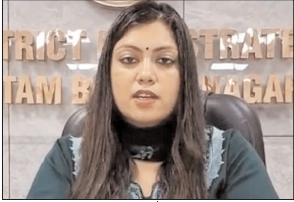
प्रत्येक श्रमिक को साप्ताहिक अवकाश मिलेगा, और यदि रविवार को काम कराया जाता है, तो उसका भुगतान भी दोगुनी दर से होगा। सभी श्रमिकों को नियमानुसार बोनस का भुगतान अधिकतम 30 नवंबर तक उनके बैंक खातों में किया जाएगा। इसके अतिरिक्त, प्रत्येक कारखाने में कार्यस्थल पर यौन उत्पीड़न रोकथाम समिति गठित की जाएगी, जिसकी अध्यक्ष महिला होगी। शिकायत पेट्री भी स्थापित की