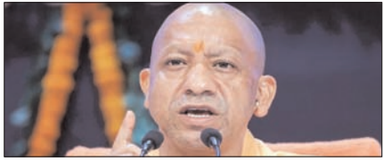
वोट बैंक के सौदागर बंगाल की डेमोग्राफी को बदलना चाहते हैं: योगी

नई दिल्ली, मुजफ्फरनगर, देहरादून, हल्द्वानी, मुतादाबाद, बरेली, मेरठ व लखनऊ से प्रकाशित