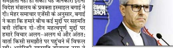
ईरान के प्रस्ताव 'व्यावहारिक' अब अमेरिका को यथार्थवादी रुख अपनाना होगा

मस्को। ईरान और अमेरिका कई मुद्दों पर सहमत हुए लेकिन दो-तीन महत्वपूर्ण मुद्दों पर असहमति होने के कारण इस्लामाबाद में हुई बातचीत के बाद समझौता नहीं हो सका। यह जानकारी ईरानी विदेश मंत्रालय के प्रवक्ता इस्माइल बगई ने दी। मेहर समाचार एजेंसी के अनुसार, बगई ने कहा कि हमारे बीच कई मुद्दों पर सहमति बनी लेकिन दो-तीन महत्वपूर्ण मुद्दों पर हमारे विचार अलग-अलग थे और अंततः वार्ता किसी समझौते पर पहुंचने में विफल रही। अमेरिकी राष्ट्रपति डोनाल्ड ट्रम्प ने आठ अप्रैल को रात ईरान के साथ दो सप्ताह के युद्धविराम समझौते की घोषणा की थी जिसके बाद, ईरान और अमेरिका ने शनिवार को इस्लामाबाद में वार्ता की।