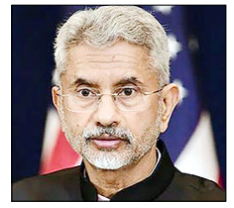
जयशंकर ने भारतीय समुदाय के लोगों को दिया पीएम मोदी का संदेश, राष्ट्रपति से भी की मुलाकात

नई दिल्ली। विदेश मंत्री एस जयशंकर के यूएई दौरे ने एक बार फिर भारत और यूएई के मजबूत रिश्तों को चर्चा में ला दिया है। उन्होंने दुबई और अबू धाबी में शीर्ष नेतृत्व से मुलाकात कर भारत की चिंताओं और प्राथमिकताओं को सामने रखा। खास तौर पर पश्चिम एशिया में चल रहे तनाव के बीच भारतीय समुदाय की सुरक्षा और दोनों देशों के रणनीतिक रिश्तों पर जोर दिया गया। जयशंकर ने बताया कि उन्होंने यूएई के राष्ट्रपति शेख मोहम्मद से मुलाकात कर प्रधानमंत्री नरेंद्र मोदी का संदेश दिया। इस दौरान दोनों देशों के बीच ऊर्जा, व्यापार और आर्थिक सहयोग जैसे महत्वपूर्ण मुद्दों पर चर्चा हुई। साथ ही हालिया संघर्ष के दौरान यूएई में भारतीय समुदाय की सुरक्षा और देखभाल के लिए धन्यवाद भी व्यक्त किया गया। जयशंकर ने यूएई के राष्ट्रपति को अलावा दुबई के क्राउन प्रिंस शेख हमदान बिन मोहम्मद और विदेश मंत्री शेख अब्दुल्ला से भी मुलाकात की। इन बैठकों में दोनों देशों के रणनीतिक संबंधों को और मजबूत करने पर चर्चा हुई। उन्होंने भारतीय समुदाय की भावनाएं और अनुभव भी यूएई नेतृत्व तक पहुंचाए। विदेश मंत्री ने साफ कहा कि इस पूरे दौर में भारतीय समुदाय उनकी सबसे बड़ी चिंता