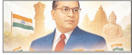
आम्बेडकरवादी भी जातिवादी हैं!