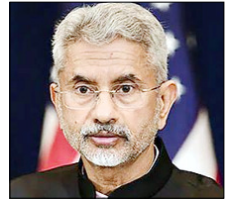
जयशंकर ने भारतीय समुदाय के लोगों को दिया पीएम मोदी का संदेश, राष्ट्रपति से भी की मुलाकात

नई दिल्ली। विदेश मंत्री एस जयशंकर के यूएई दौरे ने एक बार फिर भारत और यूएई के मजबूत रिश्तों को चर्चा में ला दिया है। उन्होंने दुबई और अबू धाबी में शीर्ष नेतृत्व से मुलाकात कर भारत की चिंताओं और प्राथमिकताओं को सामने रखा। खास तौर पर पश्चिम एशिया में चल रहे तनाव के बीच भारतीय समुदाय की सुरक्षा और दोनों देशों के रणनीतिक रिश्तों पर जोर दिया गया।