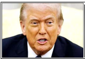
होर्मुज से पास होने वाले जहाजों की निगरानी करेगी अमेरिकी नौसेना, ईरान पर ब्लैकमेल करने का आरोप

वाशिंगटन। अमेरिका और ईरान के बीच तनाव एक बार फिर खतरनाक मोड़ पर पहुंच गया है। पाकिस्तान में हुई नाकाम शांति वार्ता के बाद अमेरिका के राष्ट्रपति डोनाल्ड ट्रम्प ने बेहद सख्त और तीखा बयान जारी किया है, जिसने वैश्विक राजनीति में हलचल मचा दी है। ट्रम्प ने आरोप लगाया कि ईरान ने होर्मुज जलडमरूमध्य खोलने का वादा किया था, लेकिन जानबूझकर उसे तोड़ा, जिससे दुनिया भर में आर्थिक अस्थिरता, डर और संकट की स्थिति पैदा हो गई है।