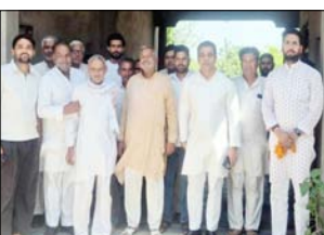
दिरास देने के साथ-साथ जनता और जनप्रतिनिधियों के बीच संबंदा को मजबूत करेंगे। जनसंघर्ष के दौरान ग्रामीणों में जिस तरह का

जिससे यह आवाजें और भी खास बन जात है। कार्यकर्ताओं ने गांव-गांव जाकर लोगों से अवगत की कि ये अभिषेक से अधिक संख्या में पहुंचकर जनसभा को ऐतिहासिक बनाएं, जनसभा के दौरान विकास कार्यों के प्रस्ताव, क्षेत्रीय समस्याओं और सरकार की विभिन्न जनकल्याणकारी योजनाओं पर विस्तार से चर्चा की गई। ग्रामीणों ने भी खुलकर अपनी बात रखी, जिनमें सड़क, बिजली, पानी और अन्य बुनियादी सुविधाओं से जुड़ी समस्याएँ प्रमुख थीं। प्रतिनिधियों ने इन सूझों पर त्वरित कार्रवाई का प्रभोसा दिलाया। अभियान से जुड़े कार्यकर्ताओं का कहना है कि यह जनसभा क्षेत्र के विकास को नई