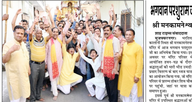
मुजफ्फरनगर, रथ यात्रा निकालते जैन श्रद्धालु।