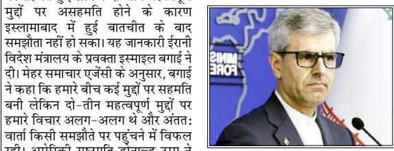
ईरान के प्रस्ताव 'व्यावहारिक' अब अमेरिका को यथार्थवादी रुख अपनाना होगा

कई मुद्दों पर सहमति बनी, अंततः वार्ता किसी समझौते पर पहुंचने में विफल रही