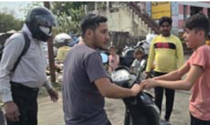
घटना की वीडियो सांकेतिक रूप से वायरल हो गई। पुलिस हस्तगत की गई।

शाह टाइम्स संवाददाता हापुड़। शहर के भीड़-भाड़ वाले रोड पर 13 वर्षीय मासूम बच्चों के साथ मारपीट का घटनाक्रम वीडियो में कैद हो गया। घटना की वीडियो सांकेतिक रूप से वायरल हो गई। पुलिस हस्तगत की गई।