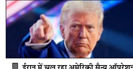
ईरान में चल रहा अमेरिकी सैन्य ऑपरेशन बहुत जल्द खत्म कर दिया जाएगा, एक माह से जारी जंग के बीच आया ट्रंप का बयान

वाशिंगटन। परिचय एशिया में जारी संघर्ष दिन-ब-दिन और भीषण हो रहा है। अमेरिका और इराकल के भीषण हमलों से युद्ध रूढ़ मोर्चे पर ईरान भी इराकल और खाड़ी देशों में मैनुद अमेरिकी सैन्य ठिकानों पर और परतवार कर रहा है। मिसौल और दून की भी गज के बीच यह संघर्ष अब अपने 33वें दिन में प्रवेश कर चुका है और पूरे क्षेत्र में तनाव अब भी चरम पर है।