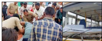
पत्नी गंभीर रूप से घायल, बाइक पर सवार होकर पकड़ा जाने जा रहा था परिवार, बस चालक गिरफ्तार

तिरुवाकी ( मुजफ्फरनगर ) बुधवार दोपहर को एक भीषण सड़क हादसे में पिता और उनके दो बच्चों की मौत हो गई। एक ठोस पत्थर स्कूल बस ने बाइक को टक्कर मार दी, जिससे यह हादसा हुआ है। हादसे में एक महिला भी गंभीर रूप से घायल हुई है। हादसे के वक्त बस में स्कूली छात्रा भी जुड़ी थी। टक्कर मामले में क्राइम इन्वैस्टिगेशन के लेंकर खेत में घुस गया, जहां लोगों ने उसे पकड़ लिया। जलसा तिरुवाकी थाना क्षेत्र में हैदरनगर हादसा रोड पर बुधवार को घटा हुआ।