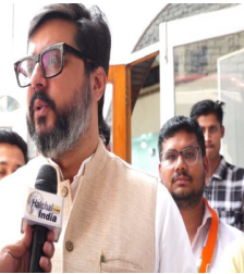
दौरान कांग्रेस नेताओं ने केंद्र और राज्य सरकार की नीतियों की आलोचना करते हुए संविधान और लोकतांत्रिक मूल्यों की रक्षा की बात दोहराई। कार्यक्रम शांतिपूर्ण तरीके से संपन्न हुआ, लेकिन बयान को लेकर उठे सवालोंने राजनीतिक हलकों में रुई बहस को जन्म दे दिया है।

किया कि कानून तब लागू होता है जब किसी व्यक्ति को लक्षित कर अपमान, जनक तरीके से जातिसूचक शब्दों का इस्तेमाल किया जाए। उनके अनुसार, यदि किसी को संबोधित कर गाली या अपमान किया जाता है, तभी यह अपराध की श्रेणी में आता है और ऐसे मामलों में कार्रवाई भी होनी चाहिए। हालांकि, इस बयान को लेकर सम्मेलन में शामिल कुछ लोगों के बीच चर्चा का विषय बना रहा। राजनीतिक कार्यक्रम के बीच उठे इस विवाद ने सम्मेलन की चर्चाओं को एक अलग दिशा दे दी। सम्मेलन के