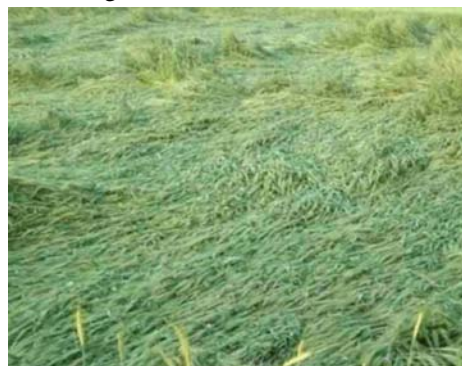
की फसल को नुकसान होने से किसानों के माथे पर चिंता दिखाई दे रही है। आशंका जताई गई है। इस साल क्षेत्र में पहले से ज्यादा सरसों की खेती की गई थी। फसल भी इस बार अच्छी थी। किसानों को उम्मीद थी कि इस बार पैदावार अधिक होगी। लेकिन बेमौसम बरसात ने

शाह टाइम्स संवाददाता गढ़मुक्तेश्वर। क्षेत्र में शनिवार रात से ही रही तेज हवा के साथ बेमौसम बारिश से सरसों व गेहूं की फसल को अत्यधिक नुकसान हुआ है। रविवार को भी सारा दिन बारिश हुई और ओलावृष्टि भी हुई, उधर सरसों की फसल पक कर तैयार थी। किसानों ने फसल को सूखने के लिए खेत में ही छोड़ दिया था। जबकि कई किसानों ने अपनी सरसों और गेहूं की फसले काट ली थी, जो की बारिश में भीग गई और गेहूं की खड़ी फसल भी तेज हवा से परस (गिर) गई है। उधर सूखने के लिए छोड़ी सरसों की फसल ओलावृष्टि होने से आधे से ज्यादा खेत में झड़ गई है, जिसको देखकर किसान परेशान हैं। अचानक बदले मौसम की वजह से सरसों और गेहूं