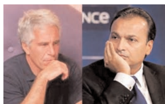
नियुक्ति-विदेश नीति से जुड़ी जानकारी साझा की, जो बाद में सही निकली

अमेरिका के यौन अपराधी जेफ्री एपस्टीन ने 2017 में उद्योगपति अनिल अंबानी के सामने खुद को डोनाल्ड ट्रम्प के पहले कार्यकाल के व्हाइट हाउस के 'इन्साइडर' की तरह पेश किया था। न्यूयॉर्क टाइम्स की रिपोर्ट के मुताबिक दोनों के बीच दो साल तक सैकड़ों मैसेज और ईमेल हुए। इनमें एपस्टीन ने ट्रम्प प्रशासन की नियुक्ति व विदेश नीति से जुड़ी जानकारी साझा की, जो बाद में सही भी निकलीं। हालांकि, इस बात का कोई सबूत नहीं मिला कि एपस्टीन को व्हाइट हाउस तक सीधी पहुंच थी। मैसेज में अनिल अंबानी ने एपस्टीन को लिखा था कि 'भारत के रिश्ते और रक्षा सहयोग के लिए व्हाइट हाउस से डील करने में आपकी गाइडेंस चाहिए।' जवाब में एपस्टीन ने 'इन्साइडर' जानकारी देने का दावा किया। न्यूयॉर्क टाइम्स ने जस्टिस डिपार्टमेंट की तरफ से जारी मैसेज के रोकथाम के आधार पर बताया कि अनिल अंबानी और एपस्टीन के बीच बातचीत सिग्नल और टेलीग्राम जैसे एन्क्रिप्टेड प्लेटफॉर्म पर होती थी, जहां अंबानी 'अरमाना ए' नाम से सक्रिय थे। यह संपर्क उस दौर का है, जब एपस्टीन नाबालिगों से जुड़े अपराधों में जेल की सजा काट चुका था। इनका