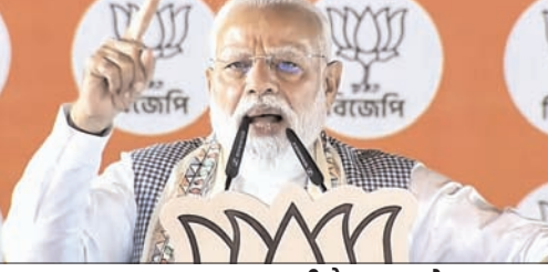
अब जनता बदलाव चाहती है, चुनाव के बाद भ्रष्टाचारियों के खिलाफ कार्रवाई होगी

नई दिल्ली। प्रधानमंत्री नरेंद्र मोदी ने रविवार को पश्चिम बंगाल के कुचबिहार में चुनावी सभा में कहा कि टीएमसी के पापों का घड़ा भर चुका है और अब जनता बदलाव चाहती है। चुनाव के बाद भ्रष्टाचारियों के खिलाफ सख्त कार्रवाई होगी, चुन-चुनकर हिंसा ली जाएगी। पीएम मोदी ने कहा कि 1905 में मजहबों ताकतों ने बंगाल में लाल इश्तेहार जारी किया था। उसके बाद हिंदुओं का नरसंहार किया गया था। टीएमसी उसी की याद दिलाना चाहती है। ये खास मजहब के लोग बंगाल में हिंदुओं का रहना मुश्किल कर देंगे। प्रधानमंत्री ने आरोप लगाया कि टीएमसी शासन में लोकतंत्र कमजोर हुआ है। संवैधानिक संस्थाओं की अनदेखी की जा रही है। राज्य में भ्रष्टाचार, घुसपैठ और महिलाओं के खिलाफ अत्याचार ने जनता को भय और असुरक्षा के माहौल में धकेल दिया है। उन्होंने संदेशवाली जैसी घटनाओं का जिक्र करते हुए महिलाओं