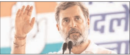
हिमंता बिस्वा सरमा सबसे भ्रष्ट मुख्यमंत्री: राहुल गांधी

नई दिल्ली, मुजफ्फरनगर, देहरादून, हल्द्वानी, मुतादाबाद, बरेली, मेरठ व लखनऊ से प्रकाशित