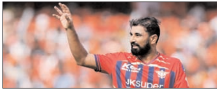
मोहम्मद शमी की आंधी में उड़ी हैदराबाद टीम