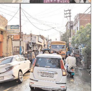
सरधना के तहसील रोड पर गड्डों में गिरा ट्रैक्टर व कार का दृश्य।

उजागर कर दिया है। स्थानीय नागरिकों ने प्रशासन से मांग की है कि निर्माण कार्य के दौरान सुरक्षा मानकों का पालन सुनिश्चित किया जाए, गड्डों के पास चेतावनी बोर्ड और बैरिकेडिंग लगाई जाए, ताकि भविष्य में इस तरह की घटनाओं से बचा जा सके।