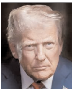
चल रहा है। उन्होंने आशा व्यक्त किया कि सब कुछ ठीक चलेगा। ट्रम्प ने कहा कि यह अमेरिका की तरह पश्चिम एशिया का स्वर्ण युग हो सकता है।

वाशिंगटन। अमेरिकी राष्ट्रपति डोनाल्ड ट्रम्प ने ईरान के साथ दो सप्ताह के युद्धविराम को विश्व शांति के लिए एक बड़ा दिन बताया और कहा कि अमेरिका होर्मुज स्ट्रेट में यातायात व्यवस्था को सुचारू बनाने में मदद करेगा। उन्होंने कहा कि ईरान ऐसा चाहता है, क्योंकि वे तंग आ चुके हैं। इसी तरह बाकी सभी भी तंग आ चुके हैं। उन्होंने कहा कि अमेरिकी होर्मुज स्ट्रेट में यातायात बढ़ाने में मदद करेगा और कई सकारात्मक कदम उठाए जाएंगे। उन्होंने कहा कि खूब पैसा बनाया जाएगा और ईरान पुनर्निर्माण प्रक्रिया शुरू कर सकता है। ट्रम्प ने कहा कि हम हर तरह की आपूर्ति लेकर आएं और यहाँ आसपास मंडराते रहेंगे, ताकि यह सुनिश्चित हो सके कि सब कुछ ठीक चल रहा है। उन्होंने आशा व्यक्त किया कि सब कुछ ठीक चलेगा। ट्रम्प ने कहा कि यह अमेरिका की तरह पश्चिम एशिया का स्वर्ण युग हो सकता है।