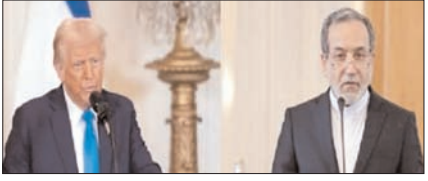
अमेरिका का ईरानी शांति योजना स्वीकार करना युद्ध में जीत: ईरानी सुरक्षा परिषद