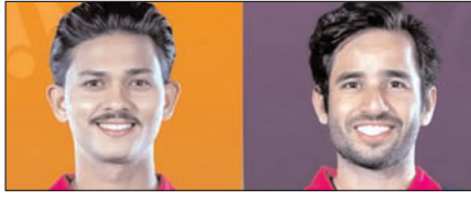
ऑरेंज कैप और पर्पल कैप पर आरआर के खिलाड़ियों का कब्जा खेल टाइम्स