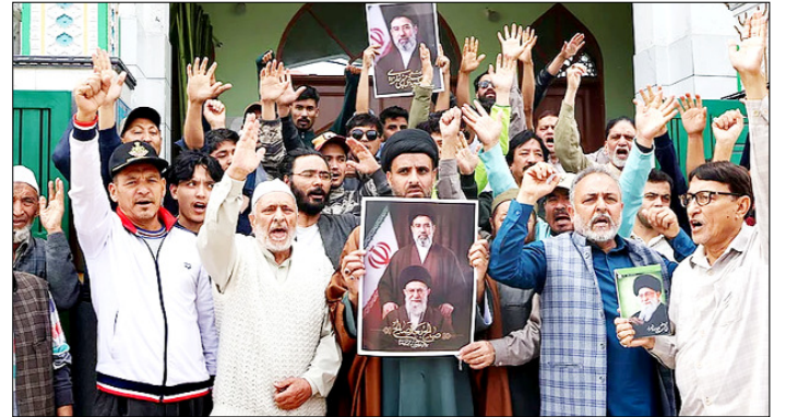
जम्मू। ईरान, अमेरिका व इजरायल के बीच हुए दो सप्ताह के युद्धविराम समझौते के मद्देनजर ईरान के सर्वोच्च नेता अयातुल्ला अली खामेनेई का चित्र लहराकर नारे लगाते लोग।

युद्धविराम पर आगे की बातचीत करेंगे। वहीं पाकिस्तान के प्रधानमंत्री शहबाज शरीफ ने बुधवार को घोषणा किया कि इस्लामिक रिपब्लिक ऑफ ईरान और अमेरिका अपने सहयोगियों के साथ लेबनान सहित सभी मोर्चों पर तत्काल एवं व्यापक युद्धविराम के लिए सहमत हो गए हैं। शरीफ ने कहा कि अत्यंत विनमता के साथ, मुझे यह घोषणा करते हुए खुशी महसूस हो रही है कि ईरान और अमेरिका हर जगह तत्काल प्रभाव से युद्धविराम पर सहमत हो गए हैं। उन्होंने इस कदम को संघर्षरत पश्चिम एशिया क्षेत्र में शांति एवं स्थिरता बहाल करने के उद्देश्य से उठाया गया एक दूरदर्शी कदम बताया। इस घटनाक्रम का स्वागत करते हुए पाकिस्तानी प्रधानमंत्री ने दोनों देशों के नेतृत्व के प्रति आभार व्यक्त किया और औपचारिक रूप से उनके प्रतिनिधिमंडलों को 10 अप्रैल को इस्लामाबाद में उच्च स्तरीय वार्ता के लिए आमंत्रित किया। प्रस्तावित वार्ता को 'इस्लामाबाद वार्ता' नाम दिया गया है जिसमें लंबे समय से चले आ रहे विवादों को सुलझाने के लिए एक व्यापक एवं स्थाई समझौते पर पहुंचने पर ध्यान केंद्रित किए जाने की उम्मीद है। शरीफ ने इस बात पर बल दिया कि दोनों पक्षों ने असाधारण बुद्धिमता और सूझबूझ का प्रदर्शन किया है और शांति को आगे बढ़ाने में रचनात्मक रूप से लगे हुए हैं। उन्होंने आगे कहा, हम पूरी उम्मीद करते हैं कि इस्लामाबाद वार्ता स्थाई शांति प्राप्त करने में सफल होगी और उन्होंने आने वाले दिनों में और भी सकारात्मक घटनाक्रमों होने के प्रति आशा व्यक्त की।