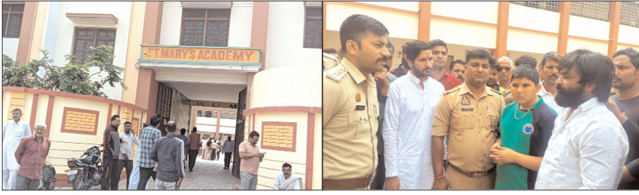
हादसे के बाद सैंट मैरी स्कूल में पहुंचे अधिभावक।