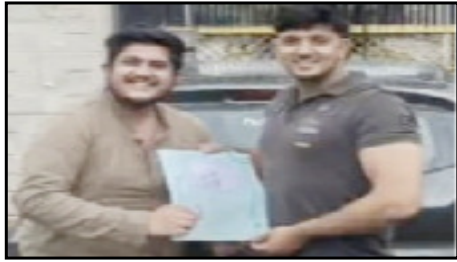
मृतकों के फाइल फोटो

शाह टाइम्स संवाददाता बागपत । दो इंजीनियर दोस्तों की मंगलवार देर रात करीब। बजे सड़क हादसे में मौत हो गई। दोनों को एक दिन पहले ही बोटक की डिग्री मिली थी। मंगलवार रात दोनों नौकरी की मन्नत मांगने दिल्ली से ऋषिकेश के नीलकंठ मंदिर जा रहे थे।