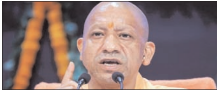
किसानों को त्वरित राहत के निर्देश, क्षतिपूर्ति में नहीं होगी देरी: योगी

नई दिल्ली, मुजफ्फरनगर, देहरादून, हल्द्वानी, मुरादाबाद, बरेली, मेरठ व लखनऊ से प्रकाशित