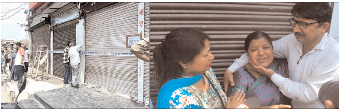
दुकानों को सील करते आवास विकास परिषद् के कर्मचारी। सीलिंग से परेशान महिला अपनी दुकान के लिए रोती बिलखती हुई।