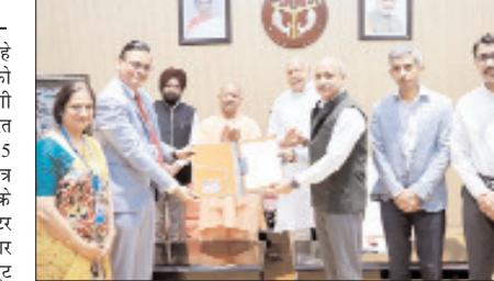
सीएम योगी ने बीईएल को सौंपा 75 हेक्टेयर जमीन का आवंटन पत्र

इस यूनिट में राडार और एयर डिफेंस सिस्टम तैयार किए जाएंगे। इससे 300 से ज्यादा लोगों को सीधे रोजगार मिलेगा, जबकि आसपास के क्षेत्रों में अप्रत्यक्ष रूप से और भी रोजगार के अवसर बनेंगे। सीएम योगी आदित्यनाथ ने कहा कि इस परियोजना से बुंदेलखंड क्षेत्र में औद्योगिक विकास