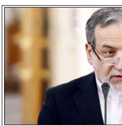
■ समझौता कराने के लिए पाक पीएम शरीफ और सेना प्रमुख आसिम मुनीर के प्रति जताया

तेहरान। ईरान के विदेश मंत्री सैयद अब्बास अराघची ने कहा है कि उनका देश अमेरिका के साथ दो सप्ताह के युद्धविराम के लिए सहमत हो गया है और इस दौरान होर्मुज जलडमरूमध्य से जहाजों को सुरक्षित आवाजाही की अनुमति दी जाएगी। अराघची ने युद्धविराम समझौता करवाने के लिए पाकिस्तान के प्रधानमंत्री शहबाज शरीफ और सेना प्रमुख आसिम मुनीर के प्रति आभार व्यक्त किया। अराघची ने बुधवार तड़के ईरान की सुरक्षा परिषद की ओर से जारी बयान में कहा कि इस्लामिक गणराज्य ईरान की ओर से क्षेत्र में युद्ध समाप्त करने के लिए अथक प्रयास के लिए अपने भाई पाकिस्तान के प्रधानमंत्री शहबाज शरीफ और फील्ड मार्शल मुनीर के प्रति आभार और सराहना व्यक्त करता हूँ।