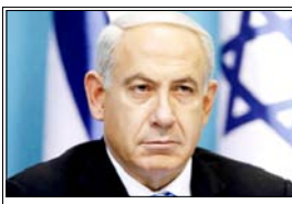
■ नेतन्याहू का यह बयान पाक के प्रधानमंत्री शहबाज शरीफ की उस घोषणा के बाद आया

नेल अवीव। इजरायल के प्रधानमंत्री बेंजामिन नेतन्याहू ने ईरान पर हमले रोकने के अमेरिका के फंसले का समर्थन किया है, लेकिन कहा कि दो सप्ताह का यह युद्धविराम लेबनान में इजरायल के जारी सैन्य अभियानों पर लागू नहीं होगा। उन्होंने कहा कि इस युद्धविराम में लेबनान शामिल नहीं है, जबकि पाकिस्तानी प्रधानमंत्री शहबाज शरीफ ने युद्धविराम की घोषणा करते हुए कहा था कि इस संघर्ष विराम में लेबनान सहित ईरान के तमाम सहयोगियों पर भी तत्काल प्रभाव से हमले रोकना है।