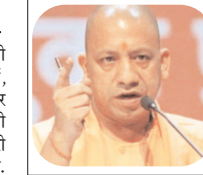
रबी फसलों को हुए नुकसान पर गहरी संवेदना व्यक्त की, अफसरों को त्वरित, पारदर्शी और संवेदनशील कार्रवाई के निर्देश

योगी ने बुधवार सुबह आयोजित उच्चस्तरीय समीक्षा बैठक में कहा कि इस संकट की घड़ी में राज्य सरकार अन्नदाताओं के साथ मजबूती से खड़ी है। उन्होंने अधिकारियों को निर्देश दिए कि प्रत्येक प्रभावित किसान एवं बिगड़दार के नुकसान का सटीक, निष्पक्ष और समयबद्ध आकलन कर तत्काल क्षतिपूर्ति सुनिश्चित