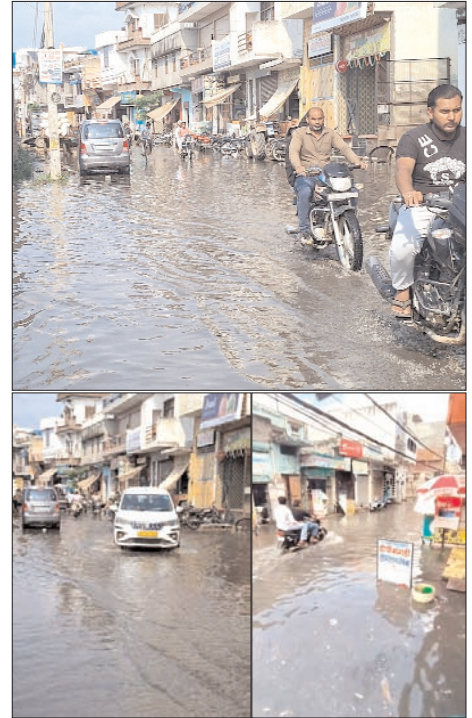
सरधना नगर में हुए जलभराव के बीच गुजरते राहगीर।

नालों की सफाई न होने से कई इलाकों में जलभराव