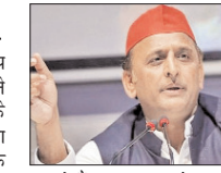
चाहते हैं। सपा प्रमुख ने कहा कि आम जनता शांति और भाईचारा चाहती है, लेकिन कुछ स्वार्थी लोग समाज में भय और अविश्वास का वातावरण बनाकर अपने राजनीतिक हित साधने में लगे हैं। उन्होंने आरोप लगाया कि ऐसे लोग भोले-भाले लोगों को बहकाकर हिंसा और तनाव की स्थिति पैदा करते हैं। यादव ने दावा किया कि अब जनता इन तथ्यों को समझ रही है और ऐसे लोगों को अपने बीच जगह नहीं दे रही है। उन्होंने विश्वास जताया कि आने वाले समय में जनता इन नीतियों को पूरी तरह खारिज कर देगी और देश में सकारात्मक बदलाव होगा।

समाजवादी पार्टी के राष्ट्रीय अध्यक्ष अखिलेश यादव ने भारतीय जनता पार्टी और उसके सहयोगियों पर जोरदार हमला बोलेते हुए आरोप लगाया है कि उनको नीतियां समाज में विभाजन और भय का माहौल पैदा कर रही हैं। यादव बुधवार को कहा कि ये लोग 'बांटो और राज करो' की सोच पर काम कर रहे हैं और देश के लोगों को आपस में लड़ाने का प्रयास कर रहे हैं।