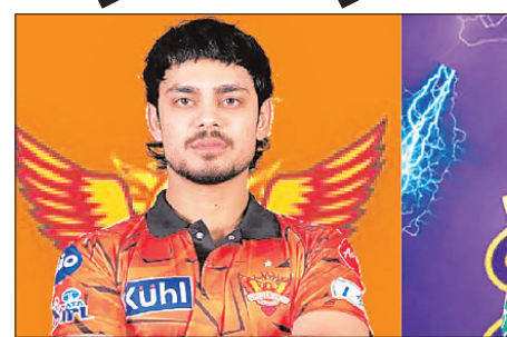
सबकी नजरों का केंद्र होगी केकेआर, जब वे गुरुवार को इंडन गार्डन्स में लखनऊ सुपर जायंट्स की मेजबानी करेंगे, मुकाबला खिलाड़ियों के व्यक्तिगत प्रदर्शन व बढ़ते दबाव के बीच

यह मुकाबला दोनों टीमों की अलग-अलग फॉर्म, खिलाड़ियों के व्यक्तिगत प्रदर्शन और बढ़ते दबाव के बीच खेला जाएगा। कोलकाता और लखनऊ के बीच होने वाला यह मैच अब एक ऐसी कहानी बन गया है, जिसमें एक संघर्षरत टीम अपने अभियान को फिर से पटरी पर लाने की कोशिश कर रही है, जबकि दूसरी टीम आईपीएल में ज्यादा संतुलित और लय में नजर आ रही है। केकेआर के लिए, इस कहानी की मुख्य बातें हैं—जल्दबाजी और टीम के सभी 11 खिलाड़ियों के प्रदर्शन में लगातार उतार-चढ़ाव। बल्लेबाजी