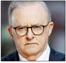
■ प्रधानमंत्री एंथनी अल्बानीज ने अमेरिकी राष्ट्रपति ट्रम्प की भाषा पर कड़ी आपत्ति जताई

कैनबरा। ऑस्ट्रेलिया के प्रधानमंत्री एंथनी अल्बानीज ने अमेरिका, इजरायल और ईरान के बीच हुए दो सप्ताह के युद्धविराम का स्वागत करते हुए इसे पश्चिम एशिया में तनाव कम करने की दिशा में महत्वपूर्ण कदम बताया, लेकिन साथ ही अमेरिकी राष्ट्रपति डोनाल्ड ट्रम्प की भाषा पर कड़ी आपत्ति जताई। अल्बानीज ने आधिकारिक बयान में कहा कि यह अस्थायी युद्धविराम व्यापक समाधान की दिशा में मार्ग प्रशस्त कर सकता है, जबकि लंबे समय तक चलने वाला युद्ध वैश्विक अर्थव्यवस्था और मानव जीवन पर गंभीर प्रभाव डाल सकता है। उन्होंने होर्मुज जलडमरूमध्य के बाधित होने का उल्लेख करते हुए कहा कि इससे वैश्विक ऊर्जा आपूर्ति और कीमती पर असर पड़ा है, जिससे बाजारों में अनिश्चितता बढ़ी है। उन्होंने कहा कि ऑस्ट्रेलिया