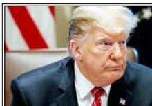
■ स्क्रीन पर इजरायल की खुफिया एजेंसी मोसाद के प्रमुख डेविड बार्निया और इजरायली सैन्य अधिकारी जुड़े हुए थे

वाशिंगटन। इजरायल के प्रधानमंत्री बेंजामिन नेतन्याहू सुबह ही व्हाइट हाउस पहुंच चुके थे। वह कई महीनों से अमेरिका पर दबाव डाल रहे थे कि ईरान पर बड़ा हमला किया जाए। हालांकि इस बार की मुलाकात बेहद सीक्रेट थी। उन्हें बिना किसी औपचारिक स्वागत के सीधे अंदर ले जाया गया ताकि मीडिया को कुछ पता न चले। पहले कैबिनेट रूम में बातचीत हुई और फिर उन्हें व्हाइट हाउस के सिचुएशन रूम में ले जाया गया, जहाँ असली बैठक हुई। यह वही जगह है जहाँ अमेरिका युद्ध और राष्ट्रीय सुरक्षा से जुड़े बड़े फैसले करता है, लेकिन आमतौर पर यहाँ विदेशी नेताओं को नहीं लाया जाता। आमतौर पर